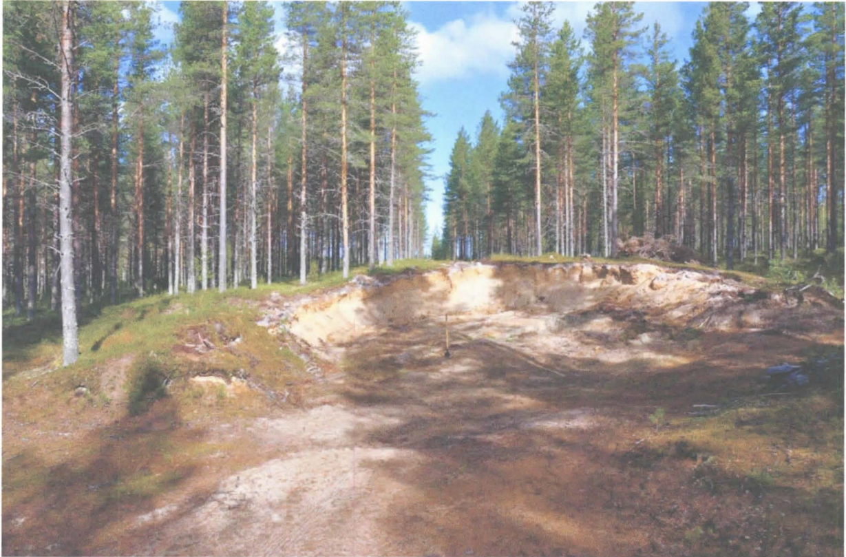
Kuva 1. Hiekkakuoppa kaakosta. Renkaiden löytökohta on kuopan vasemmassa reunassa. KaiM 7724:1.