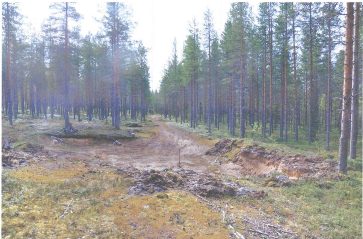
Kuva 2. Kuoppa luoteesta. Renkaiden löytökohta on kuopan oikeassa reunassa. KaiM 7724:3.