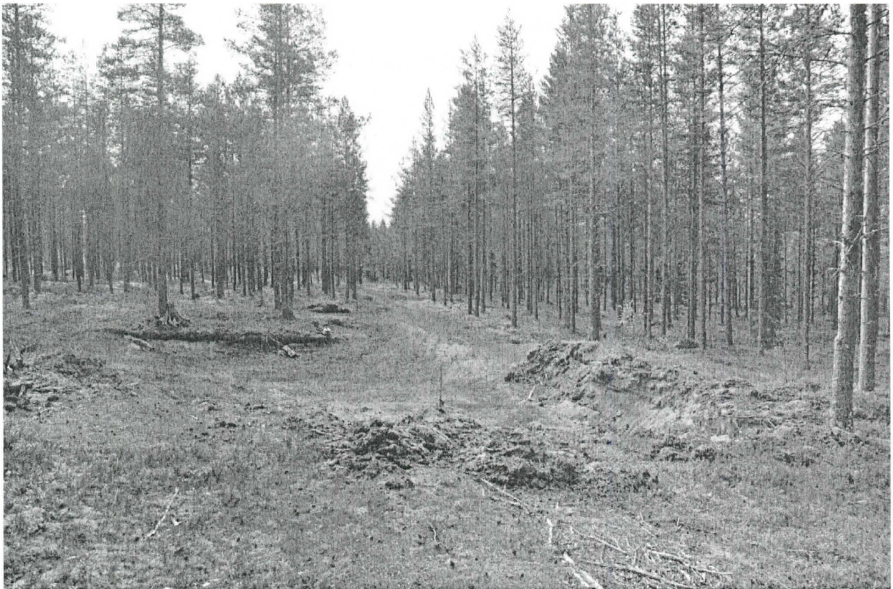
Kuva 2. Kuoppa luoteesta. Renkaiden löytökohta on kuopan oikeassa reunassa. KaiM 7724:3.