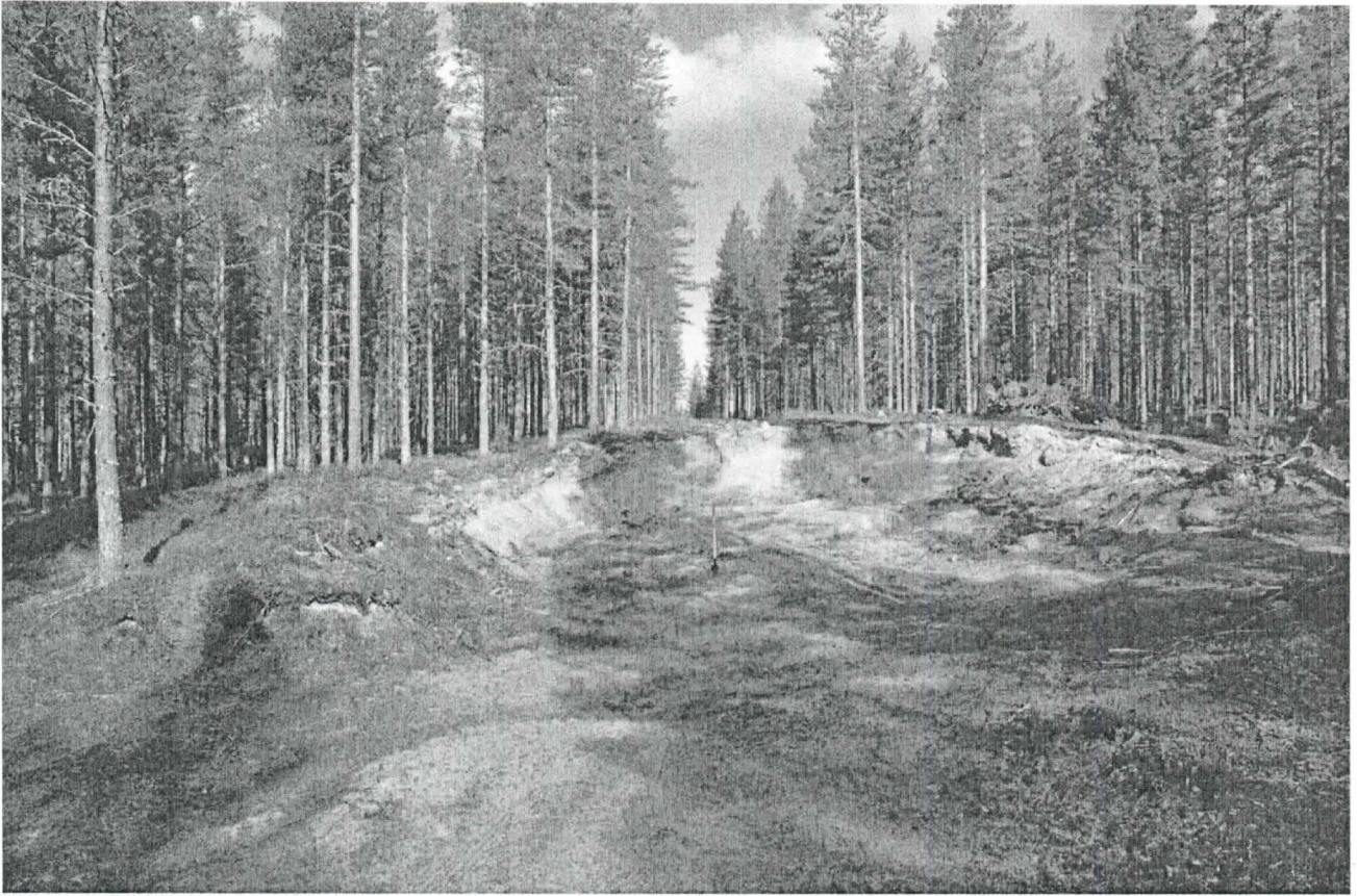
Kuva 1. Hiekkakuoppa kaakosta. Renkaiden löytökohta on kuopan vasemmassa reunassa. KaiM 7724:1.