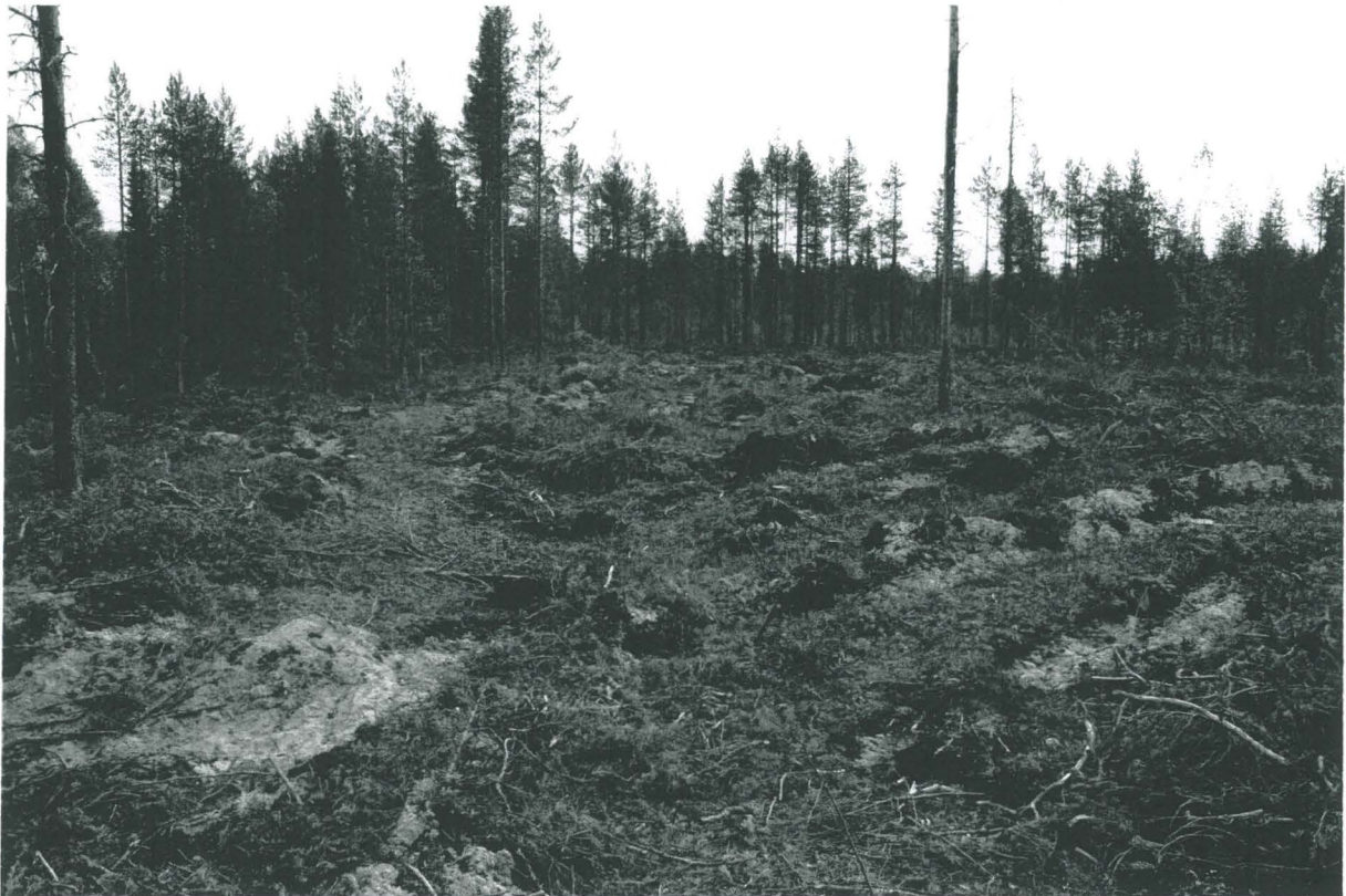
PPM DG VH 6:2011:13:04 Painanne 3 lännestä, kuv. M. Sarkkinen.