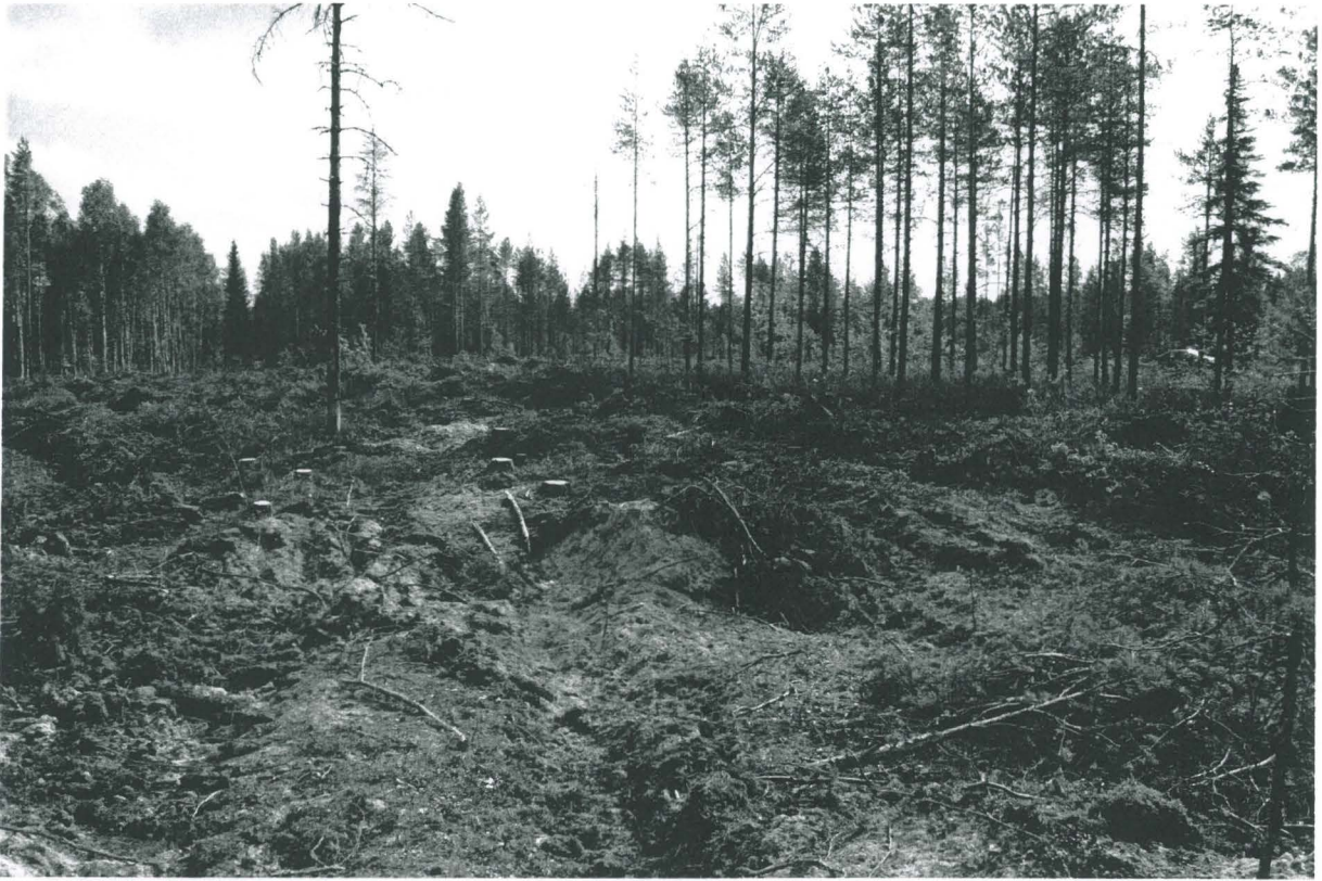
PPM DG VH 6:2011:13:01 Läntisin painanne 1 lännestä, kuv. M. Sarkkinen.