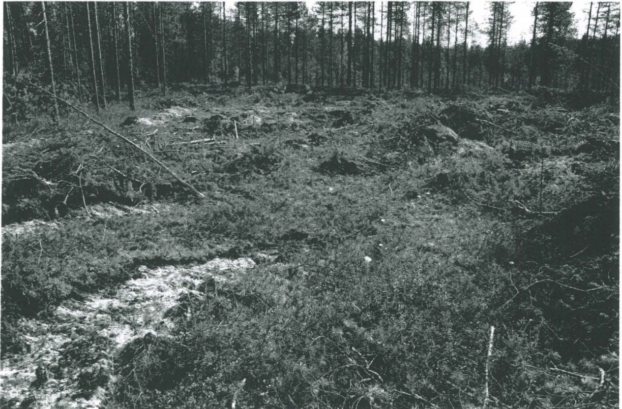
PPM DG VH 6:2011:13:05 Painanne 4 lännestä, kuv. M. Sarkkinen.