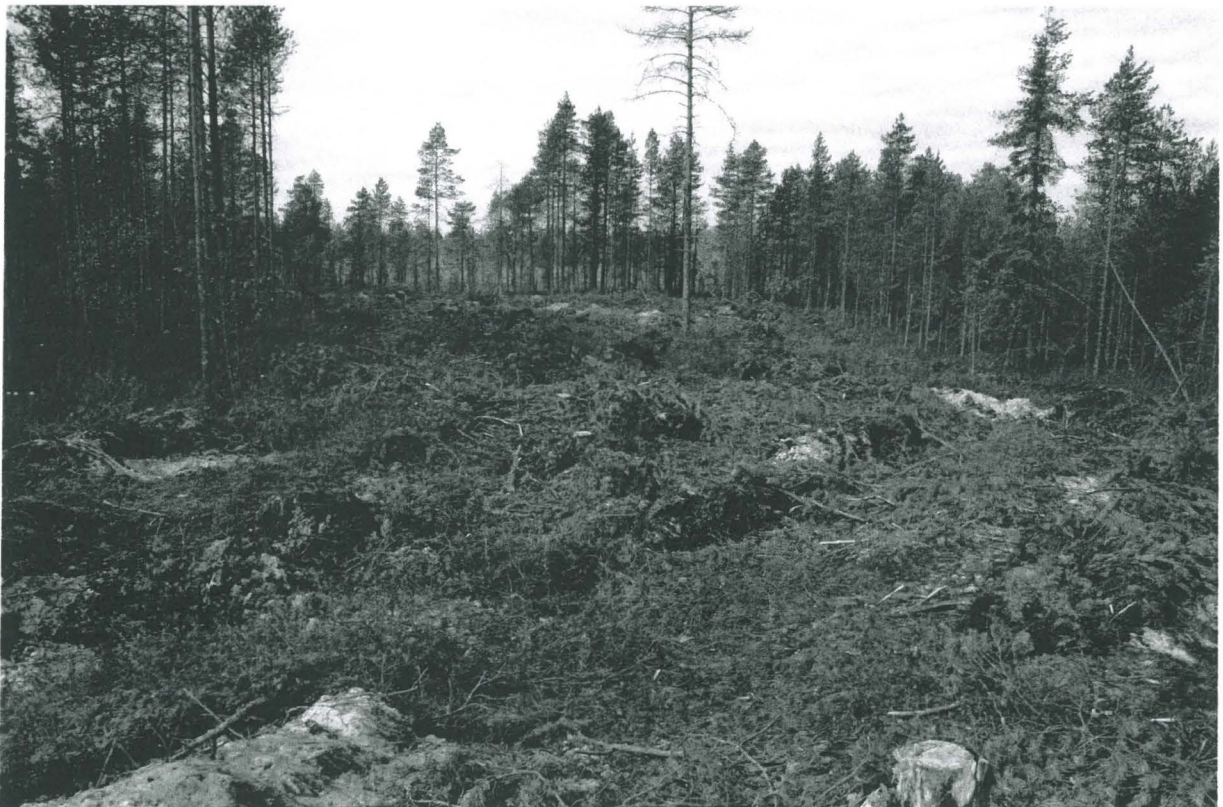
PPM DG VH 6:2011:13:03 Etualalla painanne 2 idästä, kuv. M. Sarkkinen.