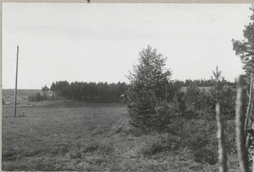
Kuva 1. Lounaasta, Perhonjoen länsipu- lta nähtynä. Joen takana vasemmalla Hongiston talo, taustalla oikealla näky- vässä metsässä hiikkakuoppia, joissa kulttuurikerrosta.