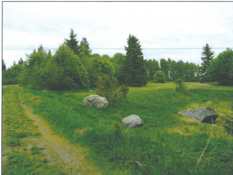
Muinaisrantatörmä tien vasemmalla puolella, kuvattu koilliseen.