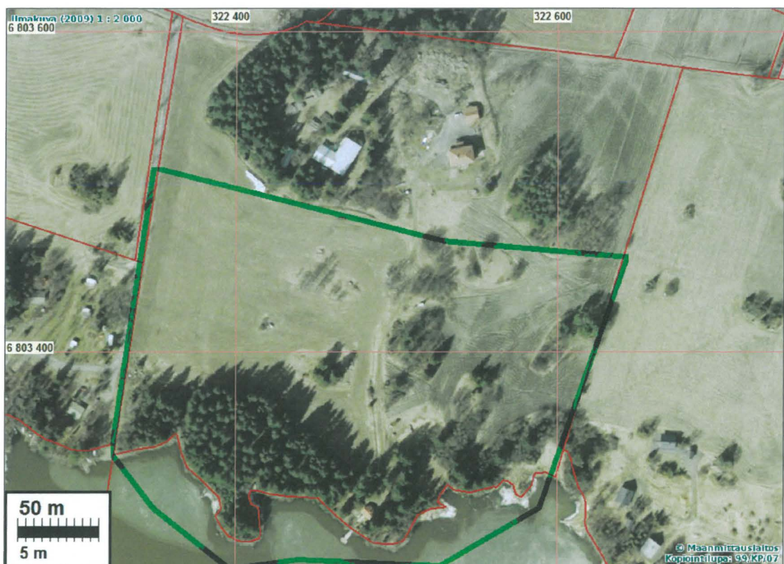
Ilmakuva tutkimusalueesta, joka rajattu vihreällä.