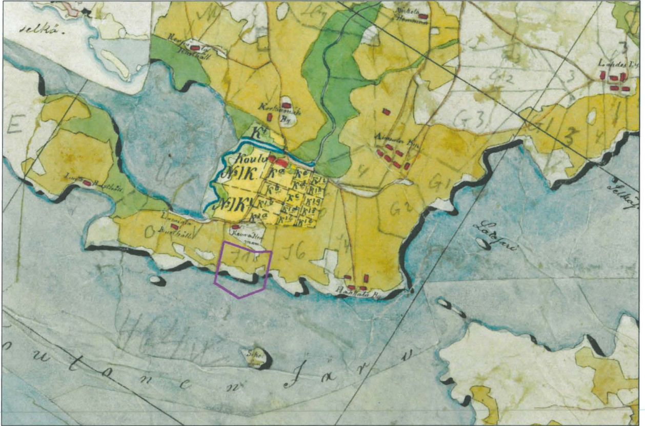
Ote pitäjänkartasta 1840l. Tutkimusalue piirretty päälle sinipunaisella.