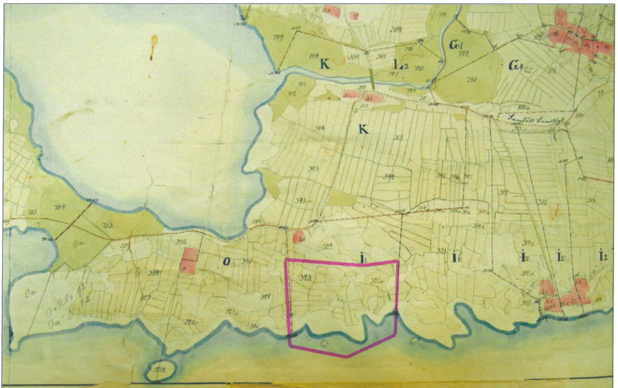
Ote aluetta kuvaavasta isojaon toimituskartasta vuodelta 1831 (H43 7/2). Päälle piirretty tutkimusalue. Sen länsipuolella Lumialan rustholli ja itäpuolella Hakkalan kylä.