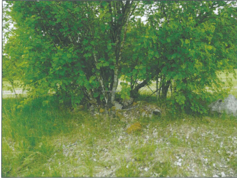
Pieni pellonraivauskivikko maapohjalla.