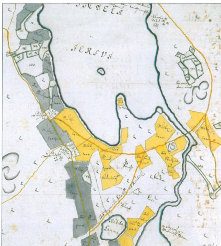
Ote kartasta 1703, H61 13 2/1