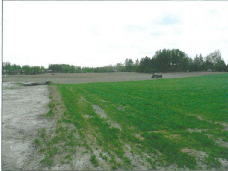
Niemen kärjestä etelään.