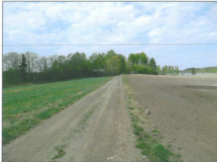
Löytöalue taustalla metsikössä, pohjois-luoteeseen.