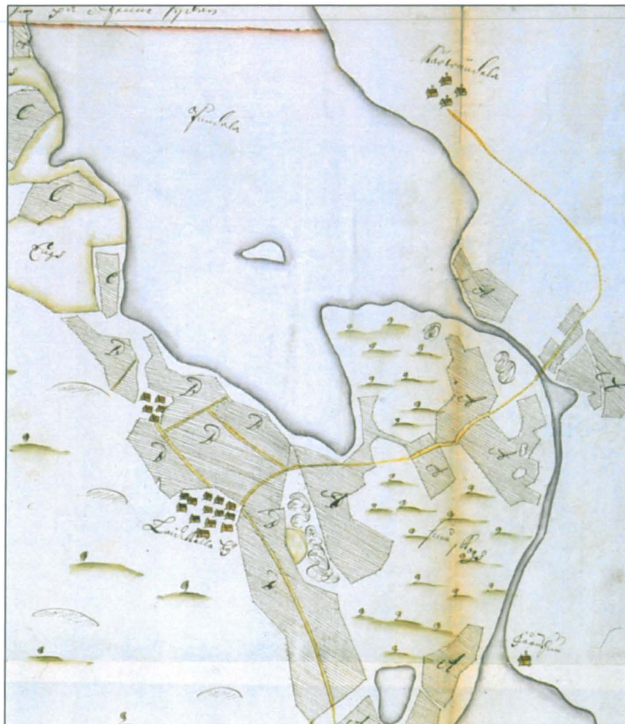
Ote maakirjakartasta 1691, H61 18/1