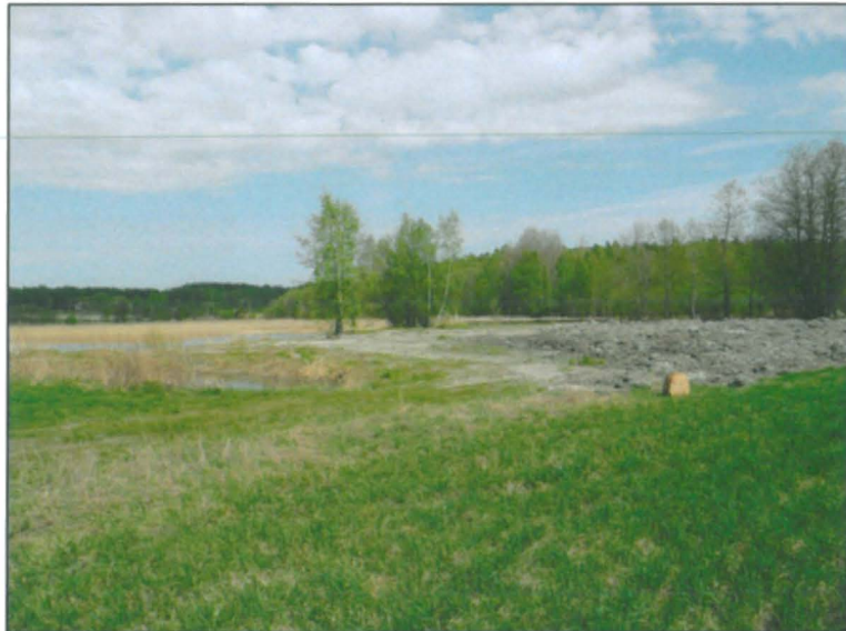
Niemen kärjen rantaa, uusi rakennusalue. Alla Katajan tilaa pohjoisesta.