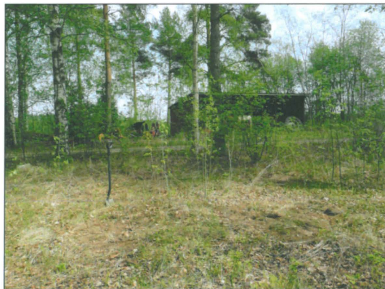
Löytöaluetta sen länsireunalta itään