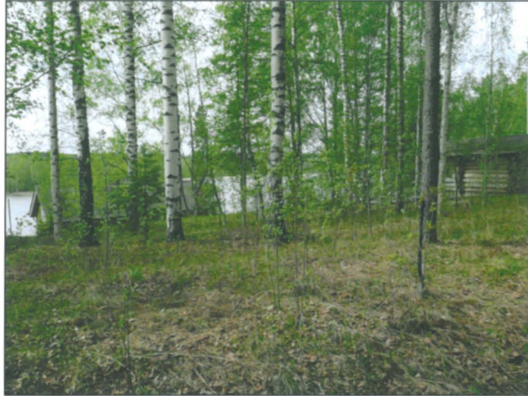
Löytöaluetta rannan suuntaan.