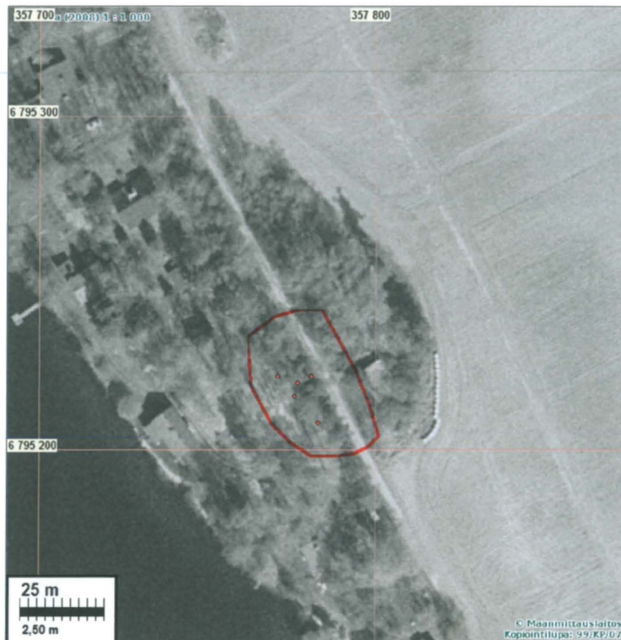
Muinaisjäännöksen arvioitu rajaus punaisella

Huomiot: Paikka sijaitsee Pinteleen ja Kyllönjoen välisellä leveällä niemellä, Katajankärkeen menevän pelto/mökkkitien länsipuolella. Paikalla on rakentamaton, pieni metsäinen alue. Ko. muinaisjäännöskohteen käytännössä kaikki ympäröivät alueet ovat rakennettuja ja/tai pihamaata. Paikalle kaivettiin 14 koekuoppaa, joista kolmesta -viidestä tuli arkeologisesti kiinnostavia löytöjä suhteellisen suppealta alalta: ainakin yksi selvä esihistoriallinen saviastian pala, kappale palanutta luuta ja osittain sulanut lasihelmi. Lisäksi alueella on laajemmalla alueella myöhäisen historiallisen ajan löytöjä, joita ei otettu talteen: lasia, tiiltä ja rautanauvoja. Maa-aines on löytökohtalla hiettaa, rannempänä hiesua. Maa-aines on kauttaaltaan sekoittunut 20-30 cm syvyydeltä eikä mahdollisesta esihistoriallisesta kulttuurikerroksesta havaittu merkkejä. Muinaisjäännös, mahdollisesti rautakautinen asuinpaikka, onkin kyseisellä kohdalla pahoin tuhoutunut. On myös mahdollista, että muinaisjäännös jatkuu/on jatkunut sittemmin rakennetuille tonteille ja niiden pihamaille, jonne inventoinnin yhteydessä ei tehty koekuoppia. Muinaisjäännöksen laajuus on siten arvio ja perustuu rakentamattomalle alueelle tehtyihin koekuoppiin ja niistä saatuihin löytöihin. Mainittakoon, että myös vanhan rantatörmän alapuolella löytöpaikan kohdalla on kesämökki.