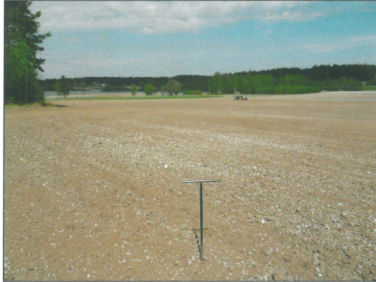
Länsirannan tuntumasta pohjois-koilliseen.