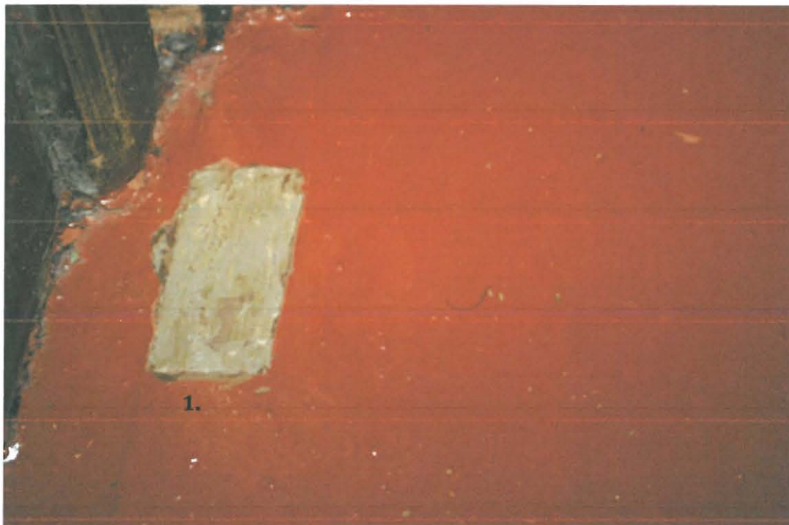
Erillinen esiinotto 1. maalikerroksesta