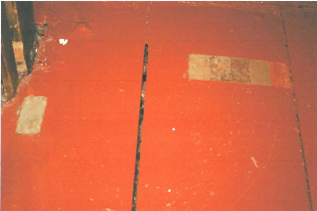
Fragmentti kirkon lattiasta.

Tutkimuskohta on dokumentoitu valokuvaamalla. Löydetyt värisävyt on määritelty NCS-värikartan koodein. Huomioitavaa on, että esiin otettu maalisävyt eivät täysin vastaa alkuperäisiä sävyjä. Erilaiset maalikerrokset ja välihionnat alkuperäisen maalin päällä ovat muuttaneet alkuperäisiä sävyjä. Väritys on alun perin ollut nyt esillä olevia fragmentteja puhtaampi. NCS-värikartan sävy on viitteellinen, joten sitä ei voi sellaisenaan käyttää ilman maalin sävyn tarkistusta.