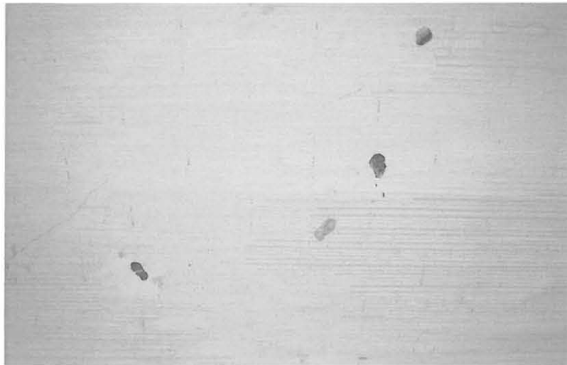
Seinä ennen paikkausta