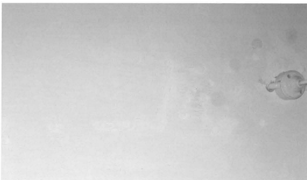
Paikkauksen ja retusoinnin jälkeen