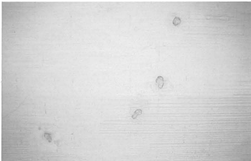
Reiät täytetty japaninpaperi-liisteri-massalla