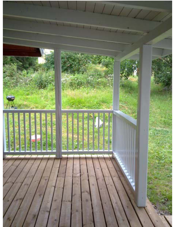
Kuva 4. kuisti jälkeen Kuva 6. Ovi jälkeen