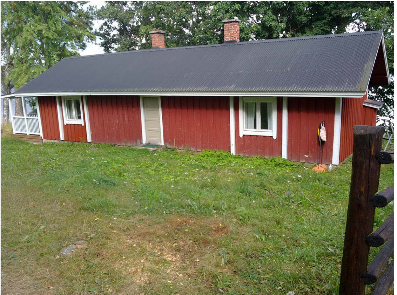
Kuva 1. Kanala vasemmalla valmista pintaa.

Tmi Elina Wirkkala/ Elina Wirkkala