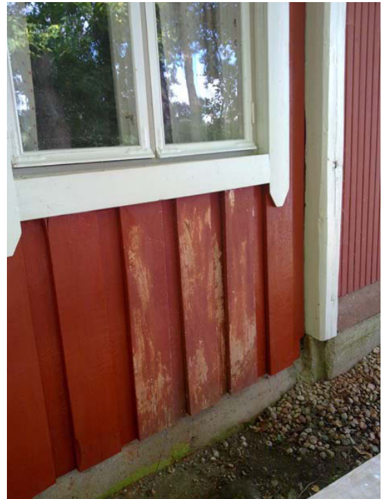
Kuva 8. Ikkuna valmis. Punamultaus menossa.