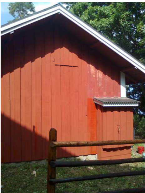
Kuva 2. Valmista pintaa, kirkaampi kohta on vielä märkä.