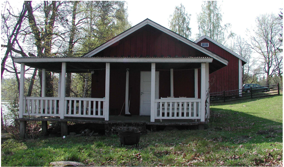
Purettava kuisti pohjoissuunnasta kuvattuna vuonna 2008.

Rantamajan pois purettava betonirakenteinen kuisti lienee rakennettu 1950-luvun muutostöiden yhteydessä. Kivinen ja routiva maa on aiheuttanut betonikannassa ja runkorakenteissa halkeamia ja vääntymiä. Uuden kuistin rakentamisen yhteydessä tehtiin salaojitus rakennuksen länsiseinustalle ja kaivettiin kuistin alta pois suuret kivilohkareet. Maapohja tiivistettiin ja tilalle ajettiin soraa.