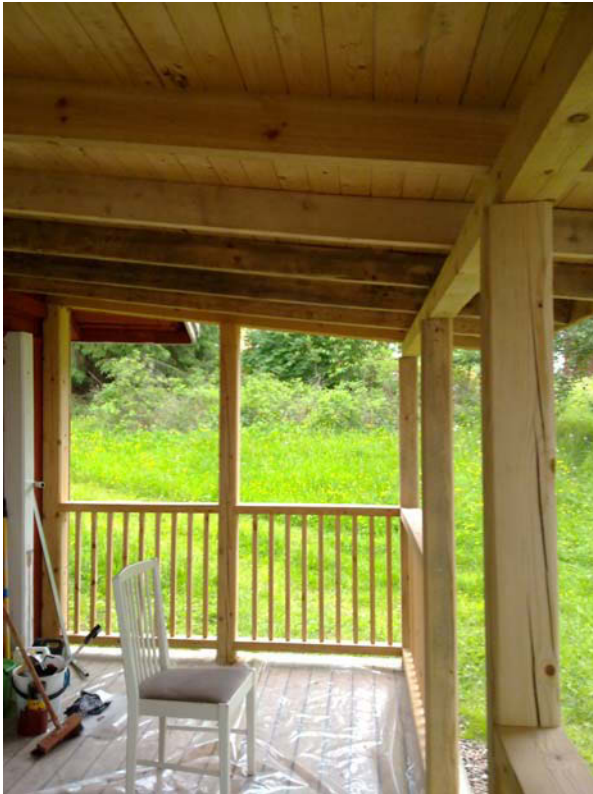
Kuva 3. kuisti ennen Kuva 5. Ovi ennen