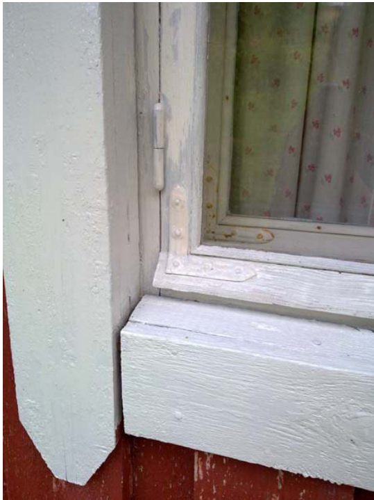
Kuva 7. Ikkuna välimaalissa