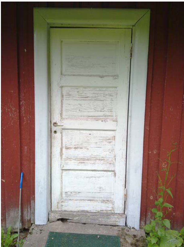
Kuvassa näkyy oven alapuolella lahovaurio ja vasemmalla rotan kolo.