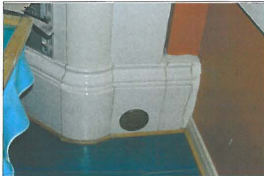
Pappilan kaakeliuunin profiloitu alaosa