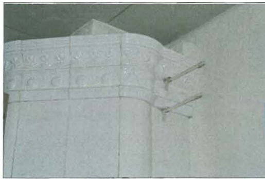
Pappilan kaakeliuunien yläosan koristelua.

Lähtö- ja tulokatselmuksen asiakirjojen perusteella uunit ovat olleet usein korjauksen tarpeessa. Niiden perustukset lienevät olleet alun pitäen huonot. Pappilan uuneja on varmasti uusittu, mutta ne ovat säilyneet tähän päivään varsin hyvin. Uunit eivät ole enää käytössä.