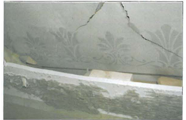
Huoneen 102 katon maalaukset.

Huoneen katto on vanhimmalta kerrokseltaan höylätystä laudasta ja se on maalattu vaaleaksi ilmeisesti jonkinlaisella liitupohjaisella liimamaalilla. Tämän kerroksen päällä on valkea paperikerros. Seuraavaan, myös valkeaan paperikerrokseen on maalattu vaaleanvihreällä maalilla rokokoohenkistä ornamenttikuviota (ks. kuva), joka kiertää kattoa nauhamaisena. Kuvio on noin 15 cm korkeudeltaan. Kattoa on madallettu viimeisimmän remontin yhteydessä ja eristetty villalla.