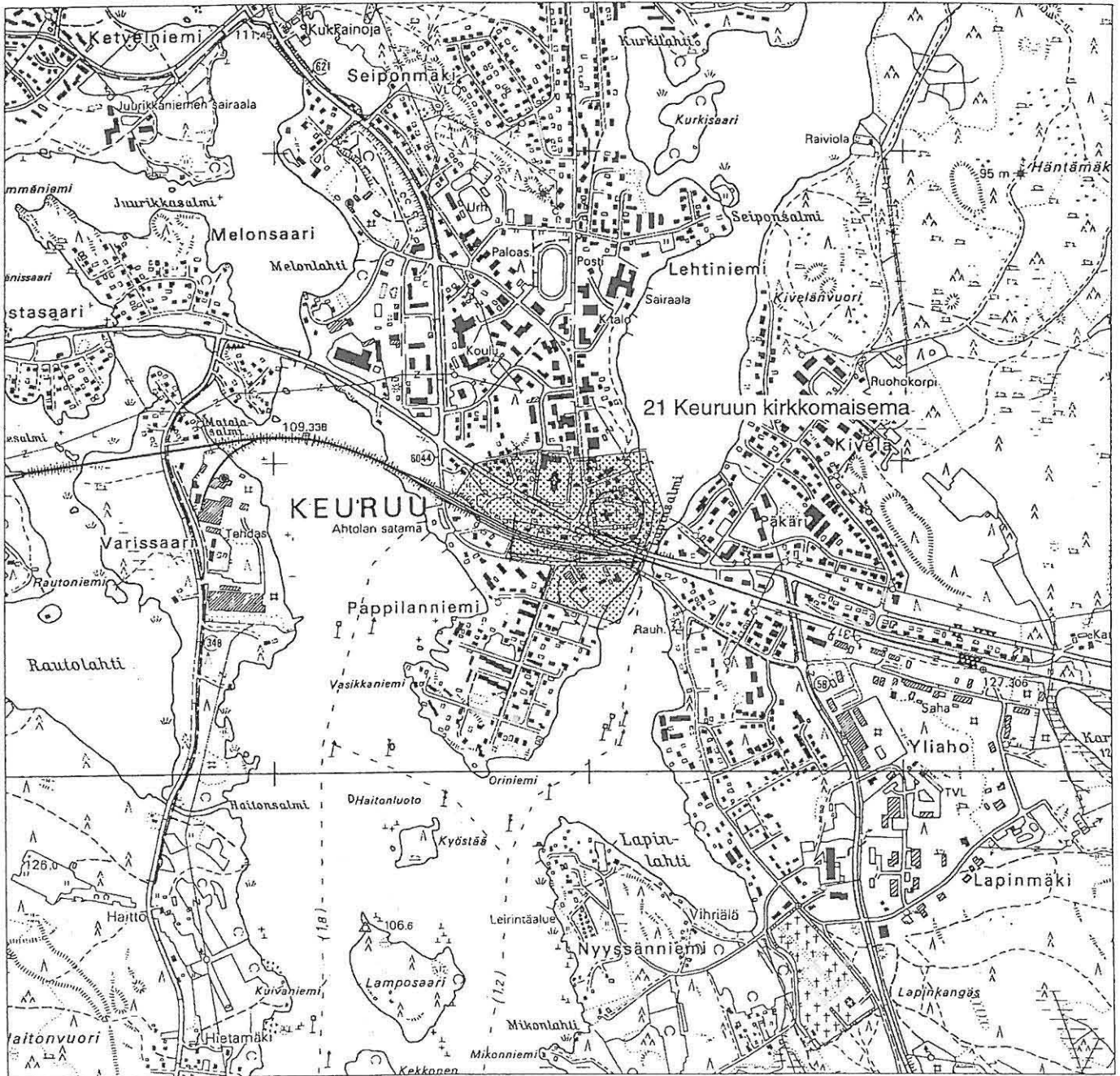
Keuruun kirkkomaisema. Museoviraston esitys valtakunnalliseksi kulttuuriympäristöksi. Karttaote vuodelta 1998. Pappilan alue rajattu katkoviivalla.