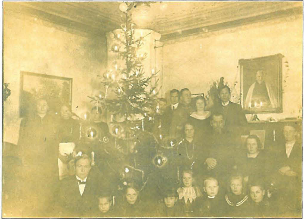
Salin katon ornamenttikuviointi on ollut hyvin rikasta.