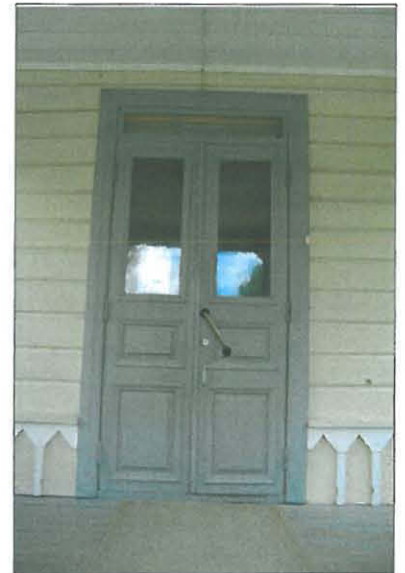
Pappilan pääsisäänkäynnin ovi.

Ulko-ovi on täysranskalainen kaksoisovi, jossa ylimmät, kapeat peilit on korvattu laseilla. Oven yläpuolella on kolmeen osaan puitteilla jaettu oven levyinen, kapea ikkuna. Listat ovat leveät, profiloidut, tyyliltään enemmän uusrenessanssia kuin empireä. Ovi on maalattu harmaaksi.