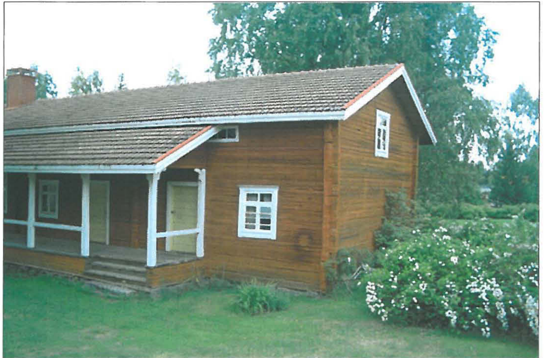
Pihapiirin suojeltu aittarakennus.

Miespihan aittarakennus on suojeltu pappilan mukana vuonna 1972. Muista pihapiirin rakennuksista jäljellä on uusi, 1960-luvulla rakennettu saunarakennus ja rannassa oleva venevaja. Pihapiirin ulkopuolella on jyväaitta. Pihapiirin rakennuksista monet on siis purettu, muun muassa nykyistä aittarakennusta vastapäätä ollut väentupa (ks. liite 2).