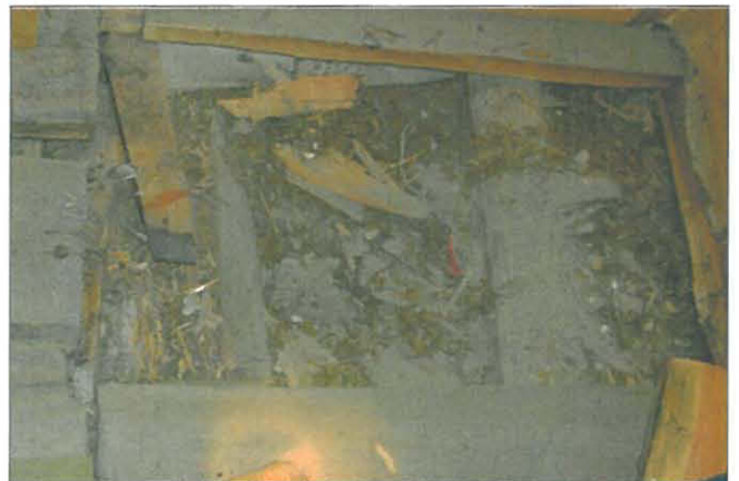
Välipohjan materiaaleja kuvattuna vinttikomeron lattiasta.

Yläpohja eristekerros on ohut, noin 25 cm, ja siinä on eristeenä sekalaista maatuva aineesta. Lisäeristettä on laitettu asuinkerroksen sisäkattoon, samalla kattoa on laskettu. Mikäli huonekorkeus halutaan palauttaa, tulee välipohjan eristys suunnitella uudestaan.