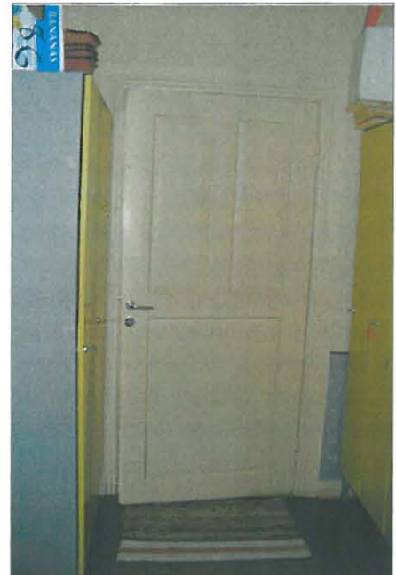
Arkistosiipeen johtava 1920-luvun ovityyppi.

Ullakon sisäovet poikkeavat alakerran ovista. Ullakkokamareiden ovet ovat pintapeiliovia, jotka on maalattu valkeiksi. Ullakon neljän vaatekammeron oviin on kiinnitetty molemmille puolille listat, jotta saataisiin aikaiseksi vaikutelma kolmepeilisestä ovesta.