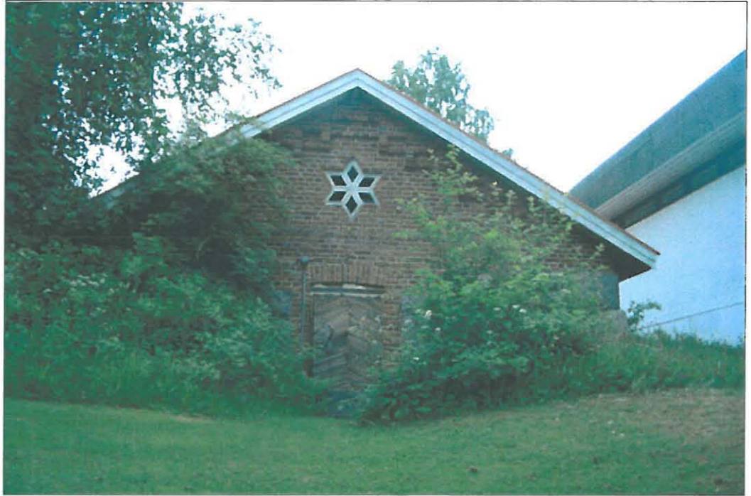
Kellarin ulko-oven päällä on koristeellinen tähti-ikkuna.