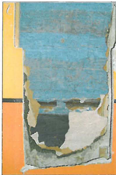
Huoneen 102 seinästä avattu aukko ja siinä näkyvät kerrokset.

Sinisen kerroksen päälle on laitettu paperikerros, johon on maalattu vaaleanpunainen värikerros. Paperikerros koostuu ilmeisesti sanomalehdistä ja asiakirjoista. Painettu teksti on ruotsinkielistä, kun taas käsin kirjoitettu on suomenkielistä. Seuraava kerros on pahvi ja siihen on liimattu varsinaiset tapettikerrokset, joita on yhteensä seitsemän. Tapetit vaikuttavat olevan tyyliä perusteella 1900-luvulta, joten täydellistä kuvaa sisätilan muutoksista ei saa.