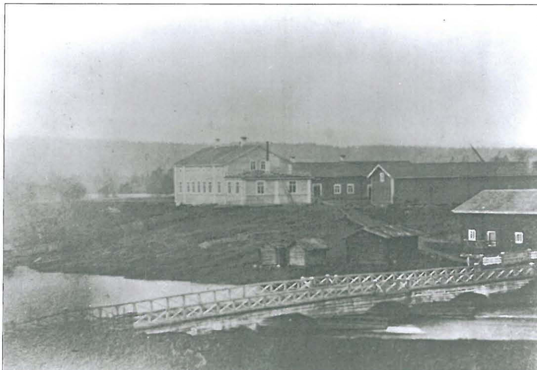
Kangasmanillan pappila 1880-luvun alussa. Lisäsiipi on jo rakennettu.