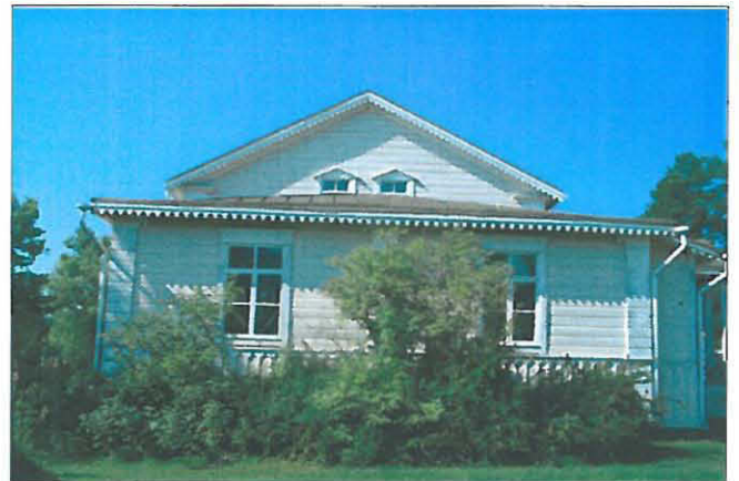
Nyt pensaita on seinävierissä useassa kohtaa.