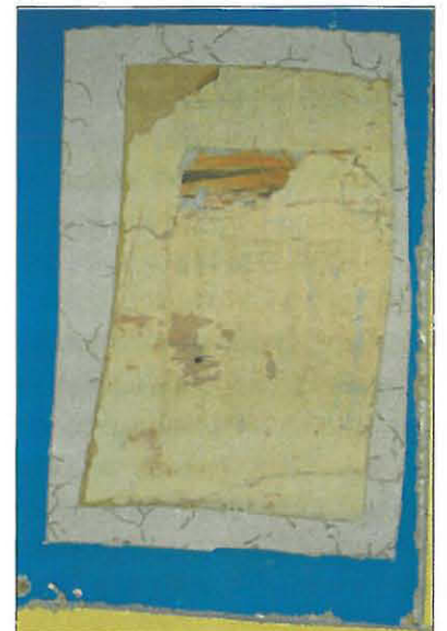
Salin seinän kerrostumia, alimpana vaalean- punainen kerros.

Valokuva-aineiston perusteella on mahdollista saada selville niin salin sisustusta kuin niitä sisustusfragmentteja, joita ei muuten olisi enää saatavilla. Yksi tällainen on salin katto. Vuodelta 1925 olevassa kuvassa pap-pilan salista on näkyvissä runsaasti orna-menttimaalauksin koristeltu katto.