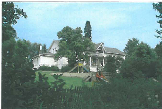
Pappilan puutarhan olemus tulee muuttua takaisin pappilan puutarhaksi.