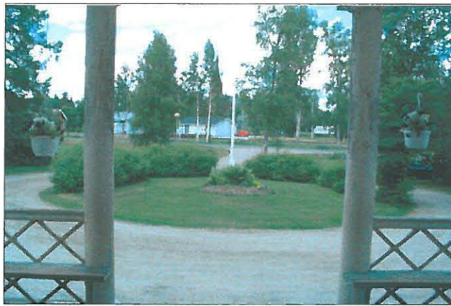
Kukkaympyrä kuvattuna kesällä 2003.