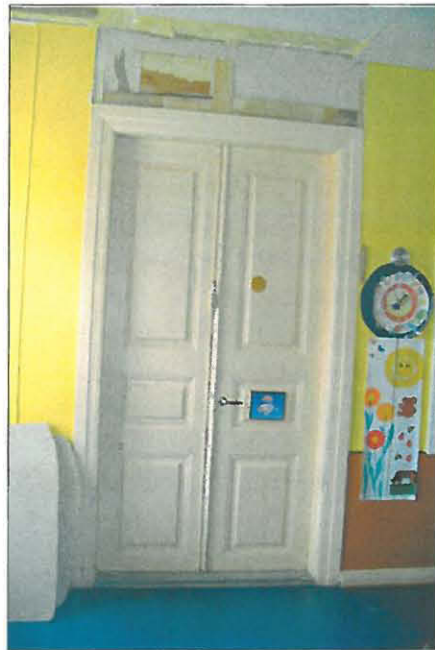
Saliin johtaa kolme puoliranskalaisista pariovea.

Pappilan sisäovet ovat puoliranskalaisia peliovia. Saliin johtavat kolme ovea ovat kaksoisovia. Muut ovet ovat tavallisia ovia. Pariovet tulivat Suomessa käyttöön 1700-luvun lopussa. Empiren aikana ovipeili koristeltiin esimerkiksi vinoneliöillä. Ovet maalattiin öljymaalilla tai ootrattiin. (Heikkinen & al. 1989, 117.) Empireaikana käytettiin enimmäkseen puoliranskalaista rakennetta. Ovien malli, jossa on matala keskipeili ja korkea yläpeili syntyi jo 1700-luvulla ja oli vallitseva ovityyppi 1800-luvun lopulle saakka. (Leinos 1988, 12.) Oven maalikerrostumissa on havaittavissa ainakin kuusi eriväristä maalikerrosta. Alin näyttäisi olevan vaalea, lähellä valkoista oleva sävy. Vaaleat sävyt olivat 1800-luvun alkupuolella suosittuja, kun taas 1800-luvun lopulla ovet maalattiin tummemmiksi ja maalauksessa käytettiin useita värejä. (Leinos 1988, 13.) Maalikerroksissa on nähtävissä kerrostuma, jossa ovi on maalattu vaaleanruskeaksi, ja listat tummanruskeaksi.