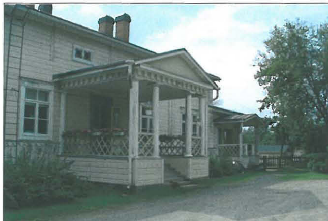
Pääsisäänkäynnin kuisti osoittaa koristeellisuu- dellaan rakennuksen arvoa.