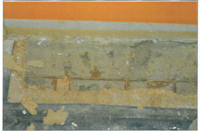
Muovimaton alla on rus- keaksi maalattu lautalattia.

Lattian alin kerros on ruskeaksi maalattu lautalattia. Lautalattiaan on sitten kiinnitetty jonkinlainen huopakeros eristämään ja sen päälle on laitettu las-tulevy, jolle nykyinen muovimatto on kiinnitetty. Lattialistojen jäänteitä ei ole. Vuoden 1906 lähtö- ja tulokatselmuksen yhteydessä suositeltiin lattia-materiaalin vaihtamista linoleumiksi tai maalaamaan lautalattiat uudestaan.