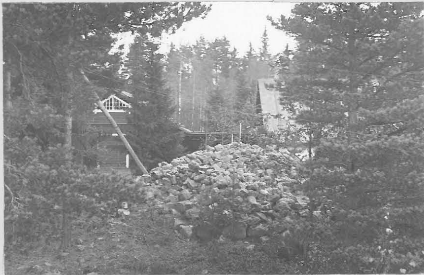
Valokuva etelästä päärakennuksen yläkerran akkunasta.