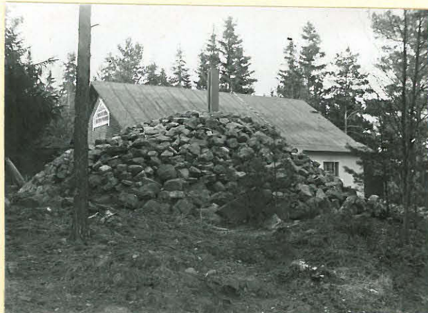
Suojan vare siirtämisen jälkeen. 8728.