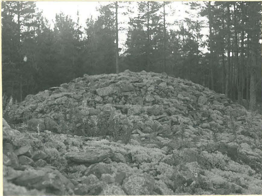
8731. Kirkkainen, Paanelia. Hiidenkivaas läheellä asemaa.