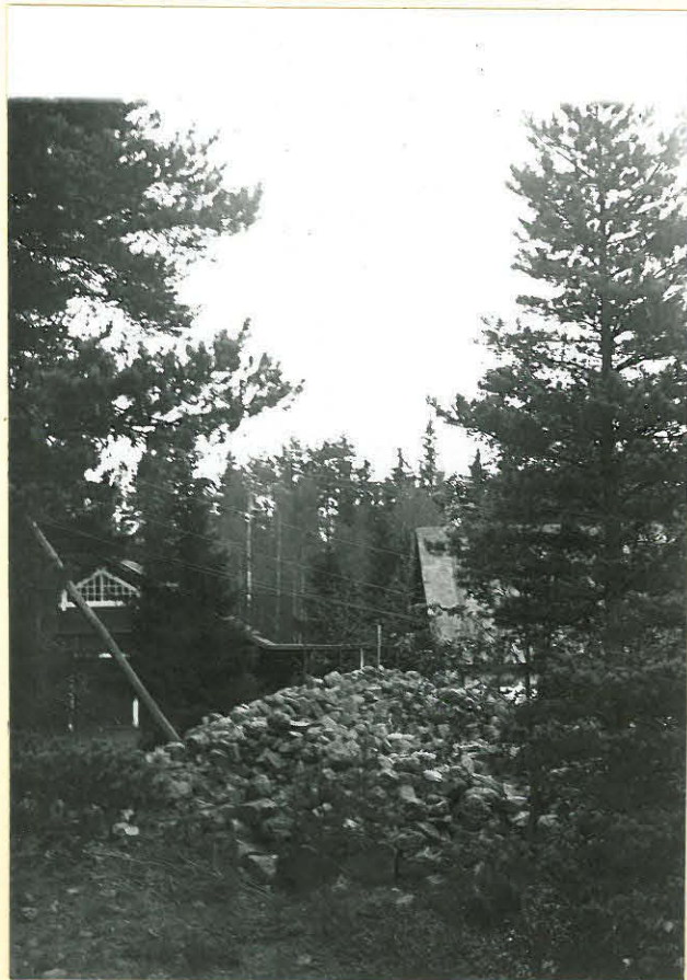
Suojan vare etelästä. 8725.