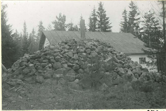
Suojan vare siirtämisen jäl- keen. 8727.