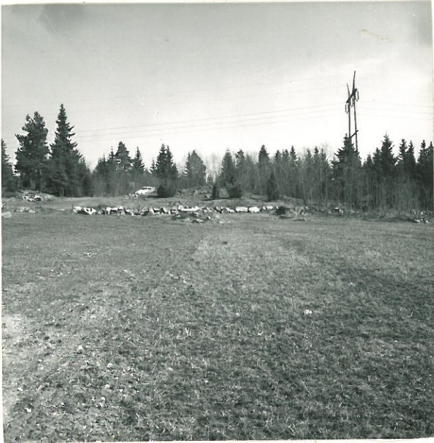
1. Sat. mus. neg. 18876 Yleiskuva kalmistosta joelta käsin. Pellon päässä oikealla näkyy uhrikivi. Katajien takaisella kalliolla rauniot 3,2,1.

PAISTILA. KYLÄ-KÖÖNIKKÄ, DERÄVAI- NIONMÄKI