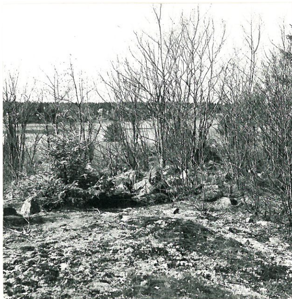
6. Sat. mus. neg. 18881 Raunio 9.