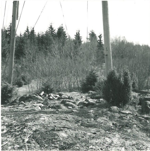
5. Sat. mus. neg. 18880 Raunio 8