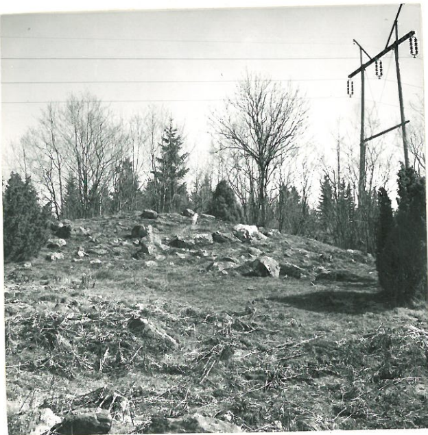
3. Sat. mus. neg. 18878 Raunio 1. (rakennettu kalliolle) joen puolelta.