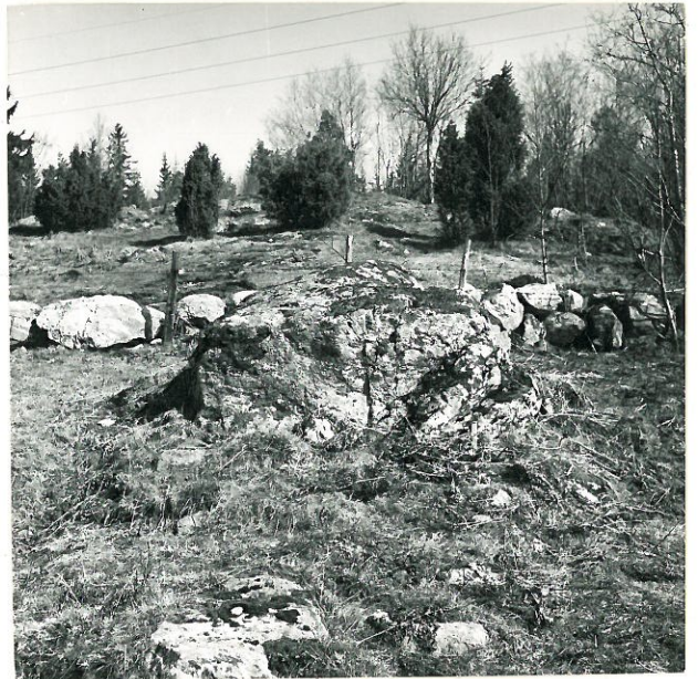
2. Sat. mus. neg. 18877 Uhrikivi, katajien takana raunio 1.