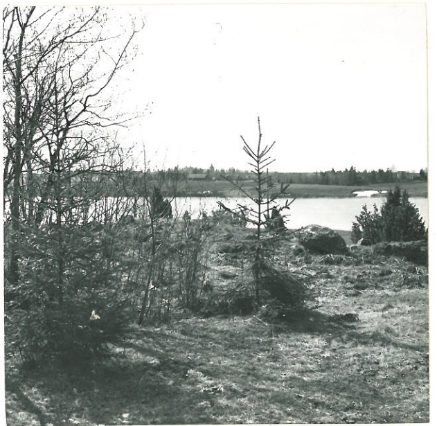
4. Sat. mus. neg. 18879 Raunio 1 ylhäältä katsottuna.