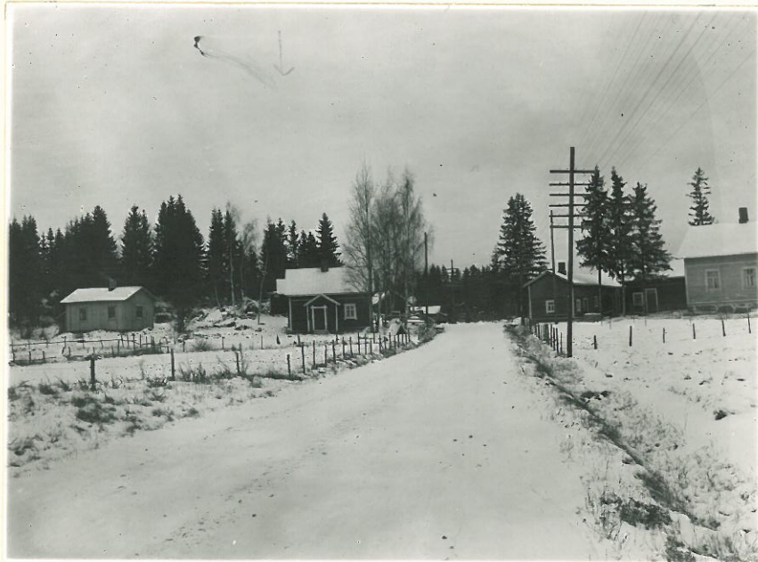
1. Pronsiik. kätkölöydön K.M. 10732 löytö- l. 11314. paikka tien vasemmalla puolella näkyvän Vähämäen asunnon ulkohuonerakennuksen takana. Kuva S:stä päin.