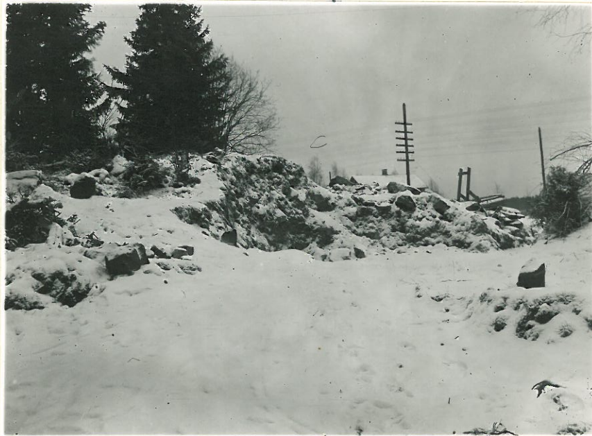
2. Mäennyppylä, josta kätkö on löydetty l. 11315. nyk. tiellä sorakuopan korkeimman paikan kohdalla.