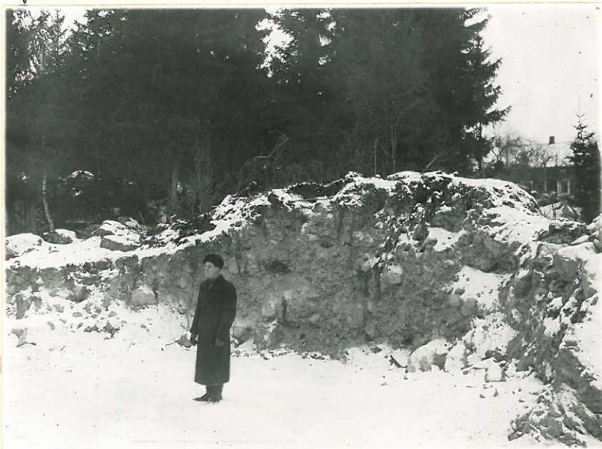
3. Sama paikka toiselta suunnalta ja l. 11316. lähempää. Mies, löytäjä Matti Mattila, löytöpaikalla.