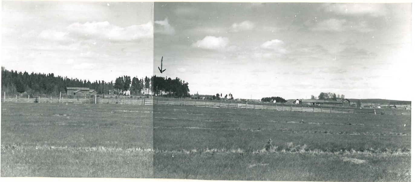
Kaistilammäki etelästä katsottuna. Hongikon takaa näkyvä valkoinen talonpäätty on Kaistilan päärakennus.