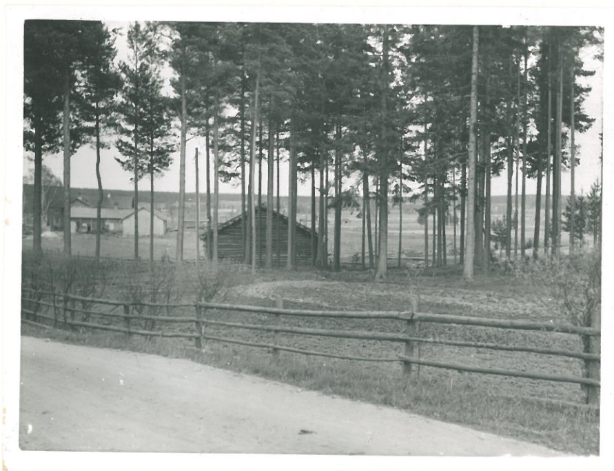
Aruinpaikka lännestä katsottuna. Löydöt on tehty etualalla olevasta pellosta.