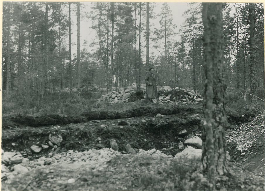
Sama paikka. Löytökohta kuopassa. Kuopan reunassa tarkastusta varten pal- jastettu alue. L. 14616.