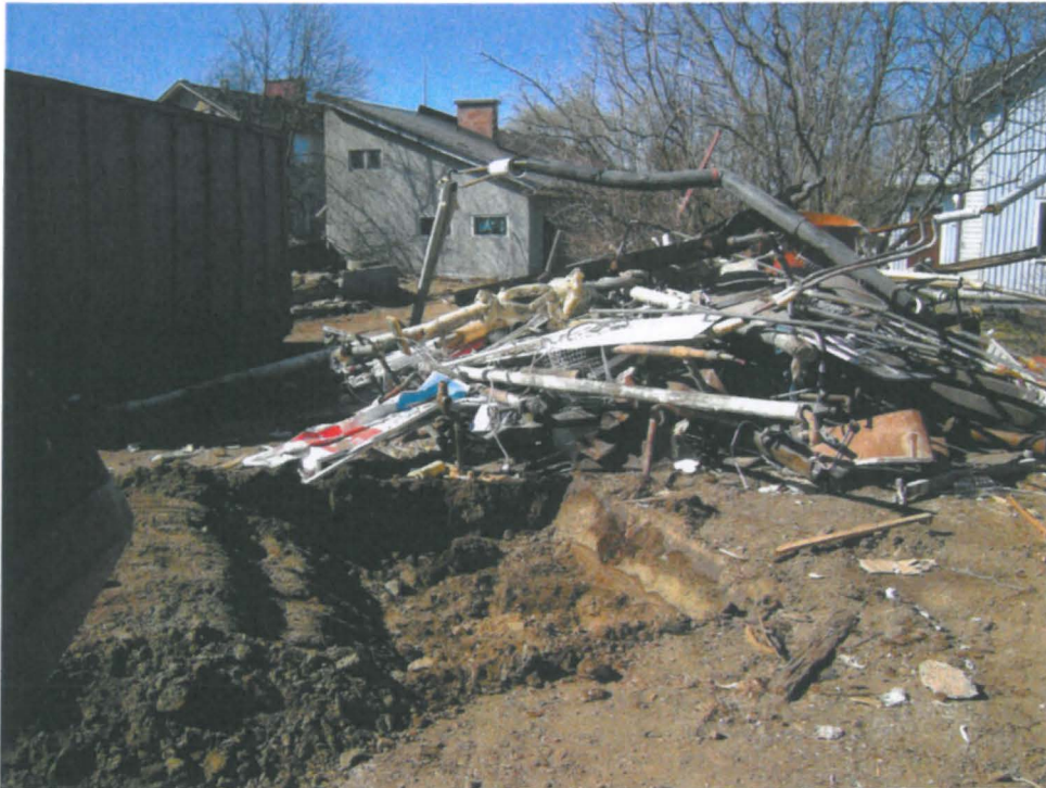
17 Autokatoksen koekuoppa C, takana tontilla säilyvät rakennukset, itäkoillisesta. Profiili erottuu etualalla keskilinjan oikealla puolen