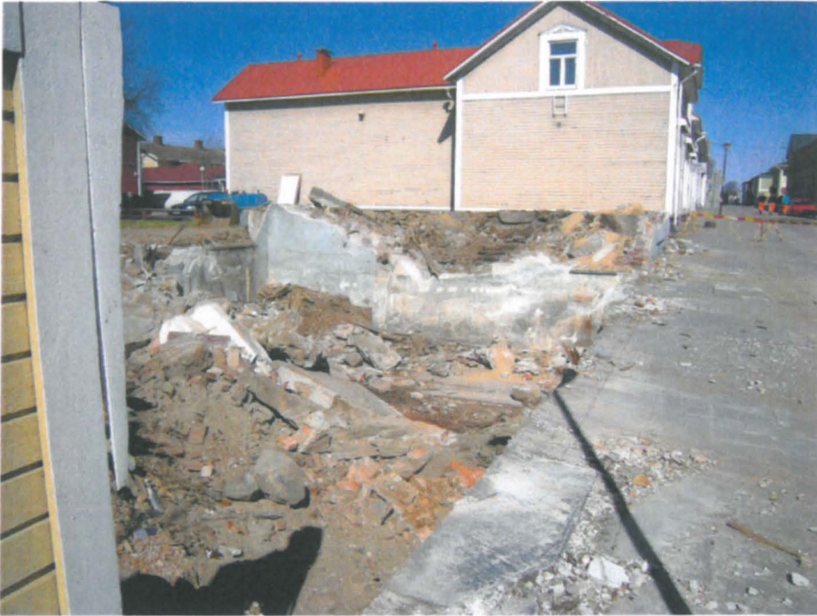
01 Raahe Kauppakatu 35 kadunvarren talon rauniot, etelästä.

Kuvat M. Sarkkinen, Pohjois-Pohjanmaan kuva-arkisto PPM DG VH 7:2012:01:(kuvanumero)