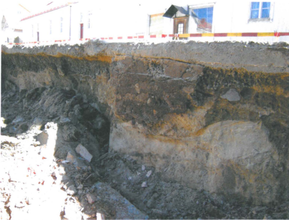
04 Puretun kellarinseinän paljastamaa profiilia Kauppakadun alla, alimpana koskematon kerroksellinen hiesu, sen päällä paikoin luontaista soraa, jonka päällä tiekerroksia. Selviä kulttuurikerroksia ei havaittu.