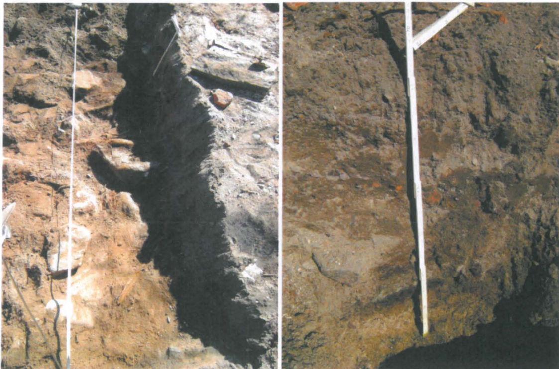
14 Kohdan A taso alemman puuroskakerroksen pinta lännestä. Huomaa ilmeinen rakennepuu kuvan keskellä profiilin vieressä olevan kiven päällä