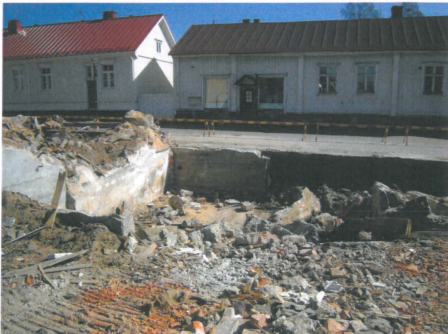
03 Raahe Kauppakatu 35 Kadunvarren talon kellaria lännestä tontilta päin, huomaa tiilet keskiliinjan vasemmalla puolella olevassa nurkkasyvennyksessä.