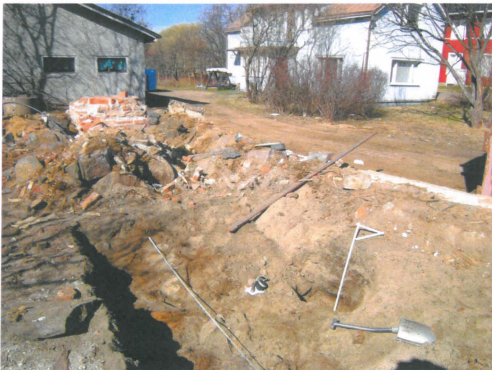
15 Vasemmalla koekuopan kohta A profiili varjossa tarkemmin katsottu alue profiilin ja kuvassa olevan vaakasuoran mitan välissä. Levennyskohta B oikealla, mitta pystyssä profiilia vasten, taustalla tontille jäävät vanhat talot, itäkaakosta.