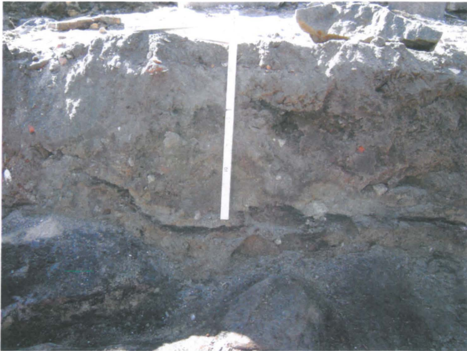
12 Kohdan A eteläprofiilia ja alemman puuroskakerroksen pintaa pohjoisesta. Huomaa hiesumaisia täyttökerroksia erottava tummana juovana näkyvä puuroskakerros.