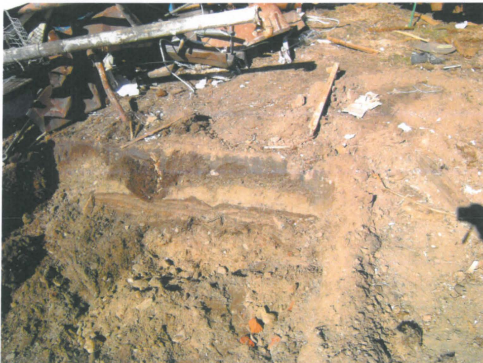
19 Kuopan C profiili kaakosta, ylimpänä tumma pelto/pihakerros, sitten vaalea hiesu, jonka alla kerroksellinen vanha pihataso, jonka alla karkea pohjasora (etualan tiilet sekundaarisia ja kauhan sekoittamassa maassa), kaakosta