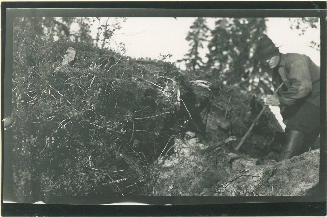
Kuva 4. Pöyliö.