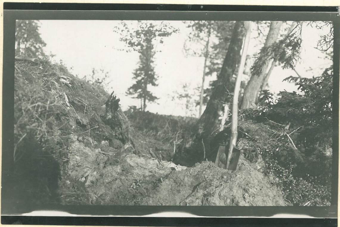
Kuva 5. Pöyliö.