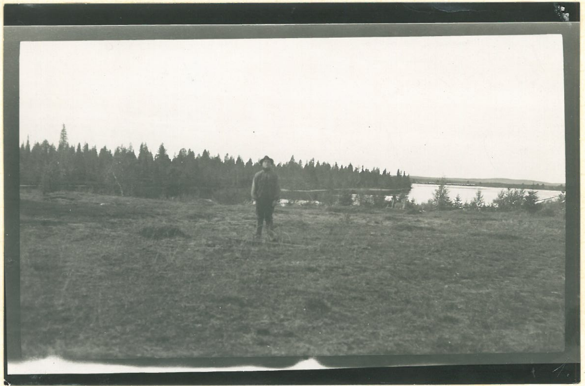
Kuva 1. Jaapontani, Kuusamo.