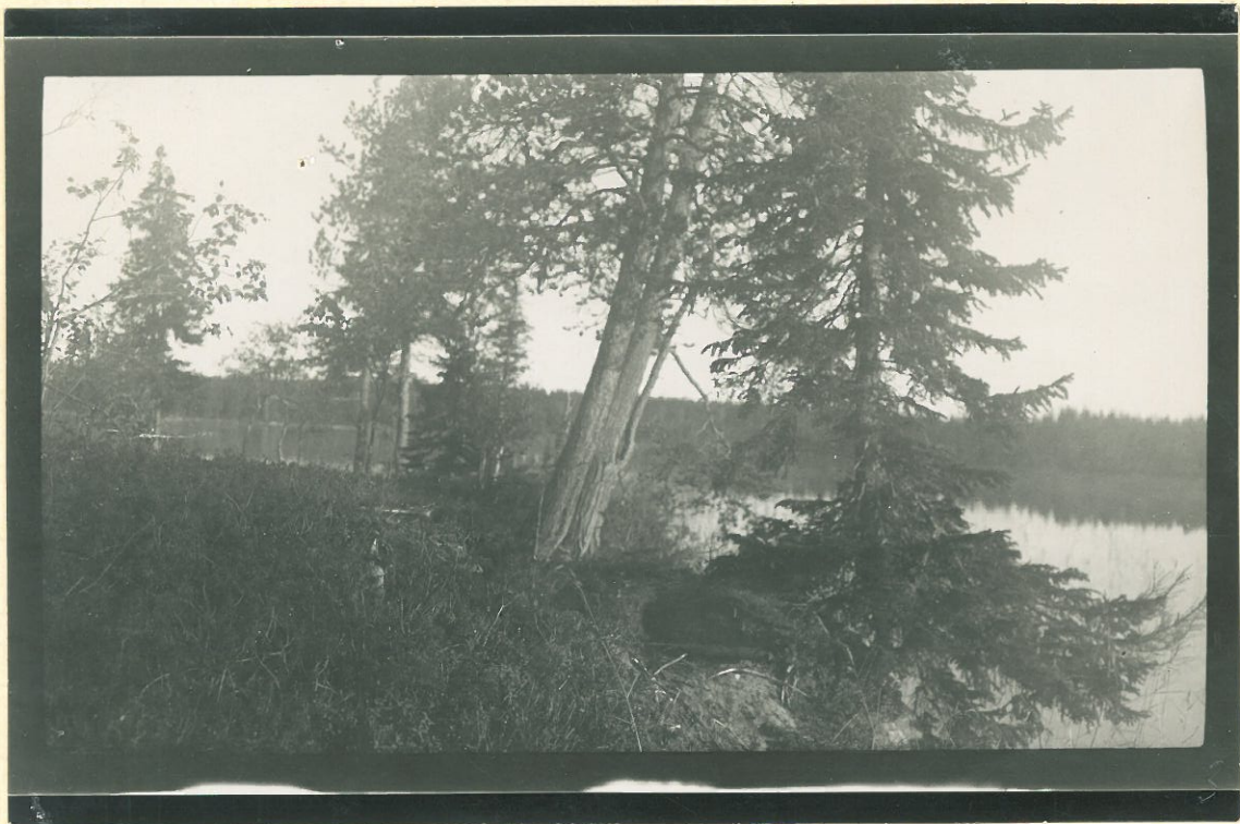
Kuva 3. Pöyliö.