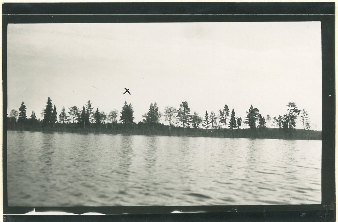
Kuva 2. Pöyliö.