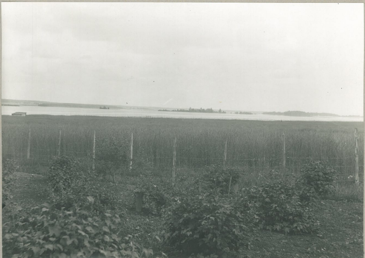
4. Köyliönjärvi katsottuna NW:stä Vinnarin kylästä. lev. 8108. Nä- näkyvissä ovat Kirkkosaari, Haukko ja Luoto.