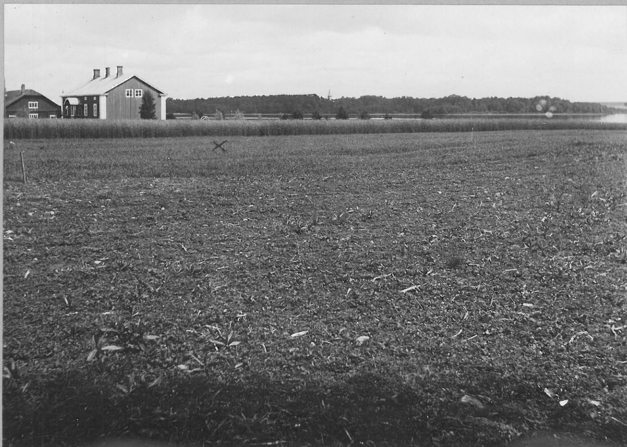
2. Etualalla olevasta pellosta on keihäänkärki H. M. 9358 löydetty. Vasemmalla Hällän kartanon rakennukset. Taustalla Köyhön kirkko. lev. 8106.