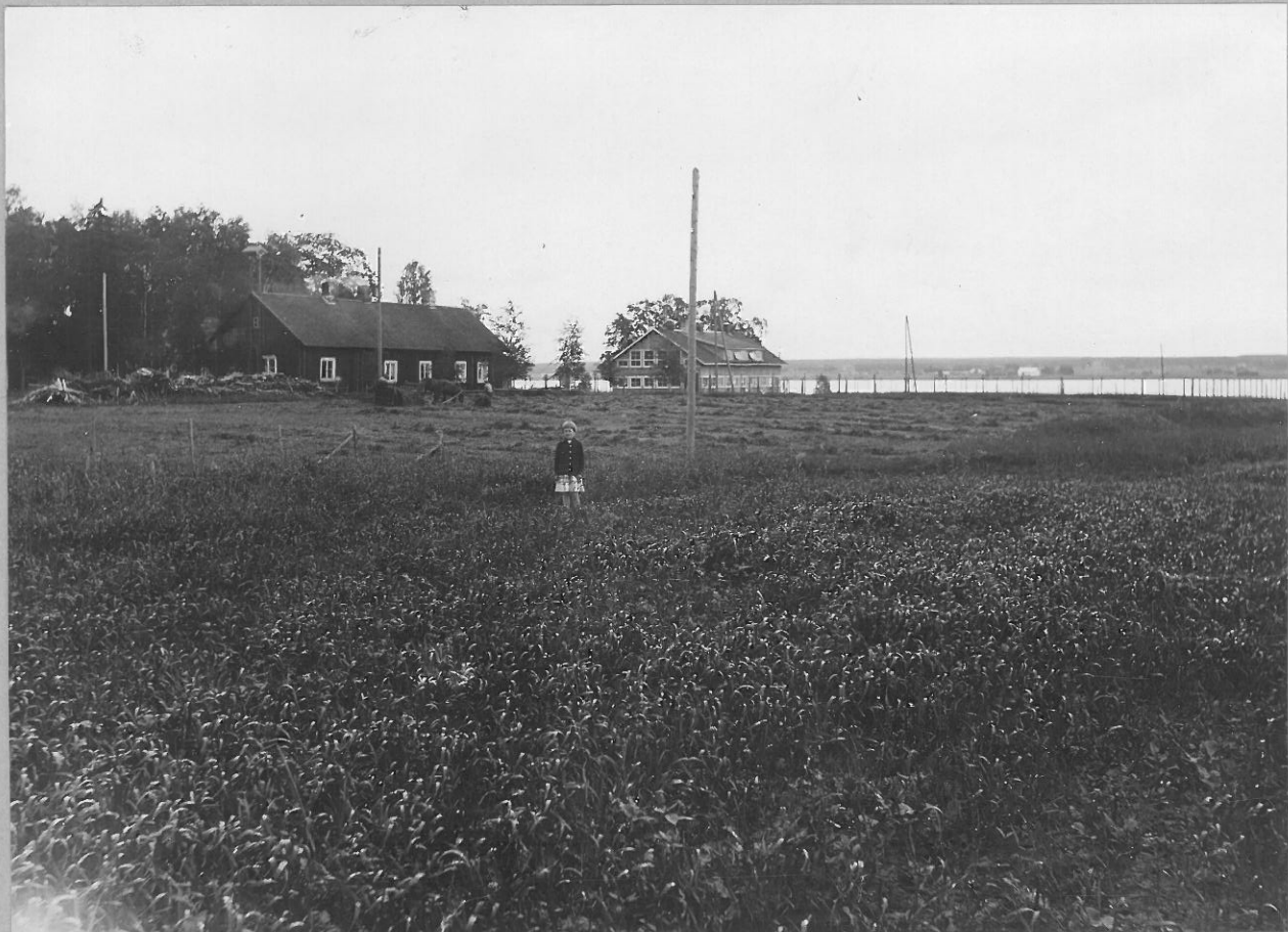
1. Keihäänkärjen H. M. 9266 löytöpaikka Repolan kartan maalla. Tyttö seisoo löytökohdalla. lev. 8105.