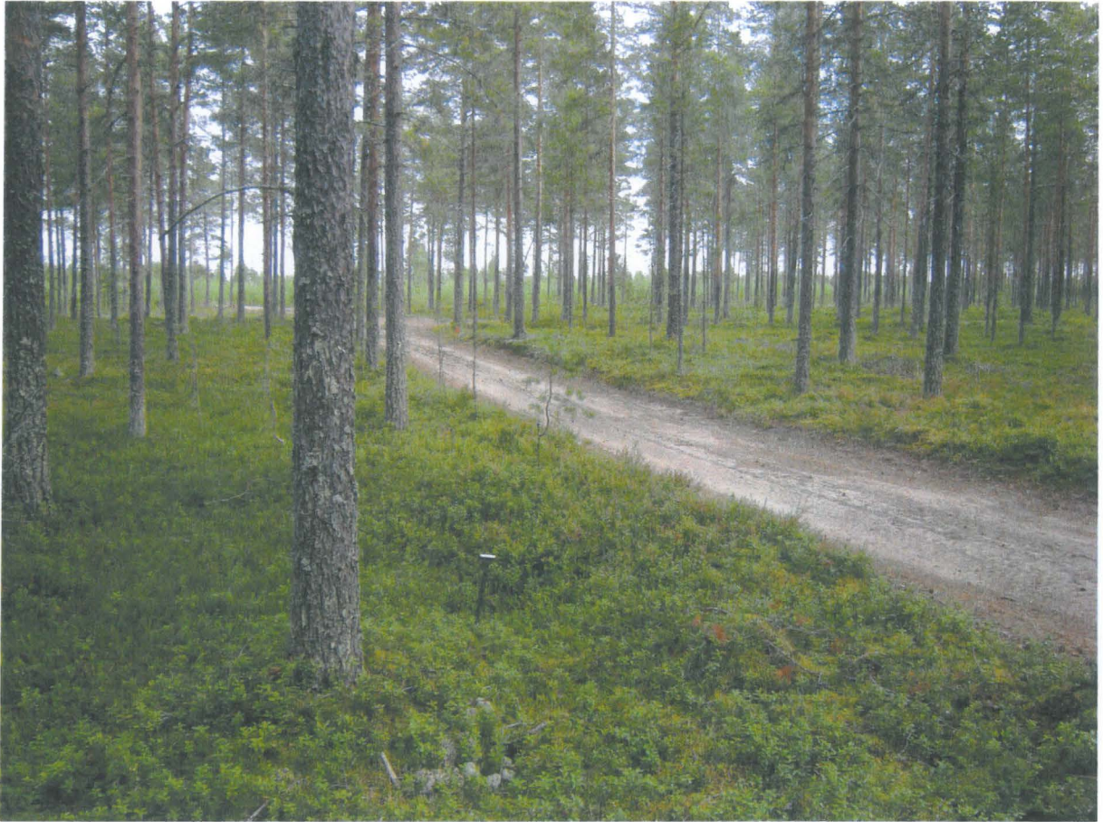
Eteläisin kuoppa lounaasta, takana erottuu punainen rajapyykki