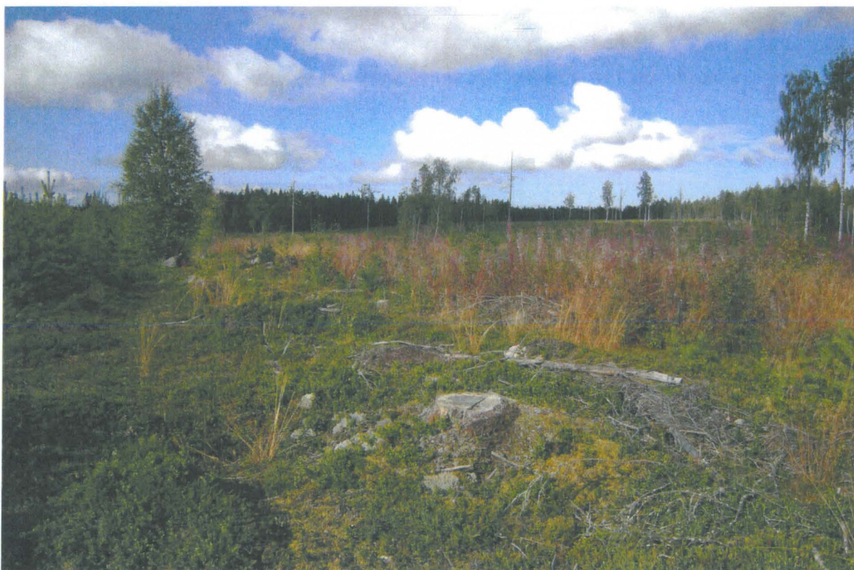
Kuoppa etualalla kannon vasemmalla puolella, kuva idästä