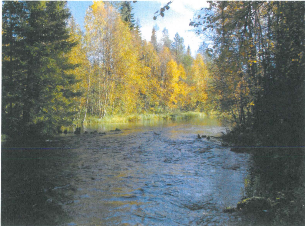
Pato lännestä. Kuva M. Sarkkinen (PPM DG VH 7:2012:15:01)