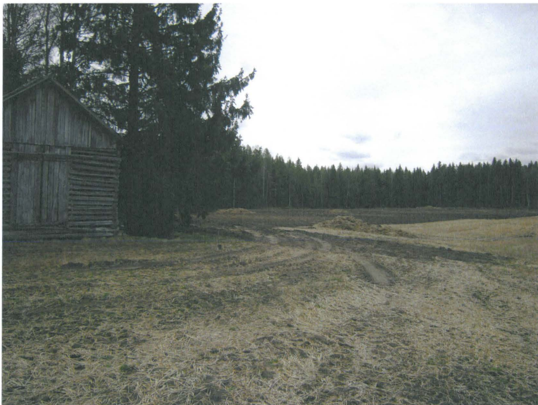
Keskeisintä löytöaluetta luoteesta, kuva M. Sarkkinen / PPM DG VH 7:2012:09:03