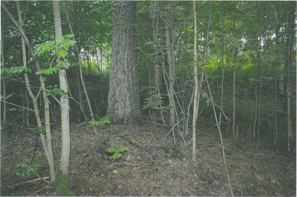
Mahdollinen taisteluhaudan osa (?), valli "rintaman" puolella. 15.7.2009