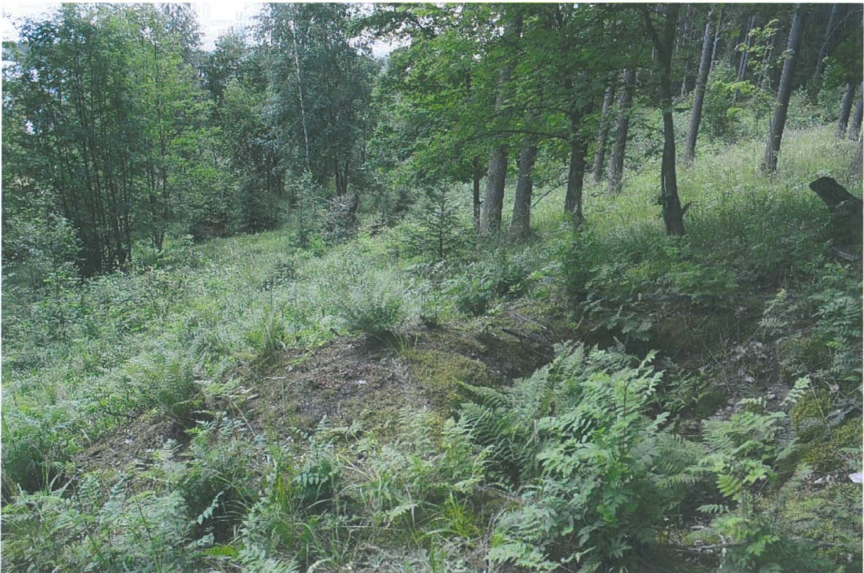
Rinteen puolelta vallin reunustama kuoppa, jolla on tuliasemalle sopiva sijainti. 15.7.2009