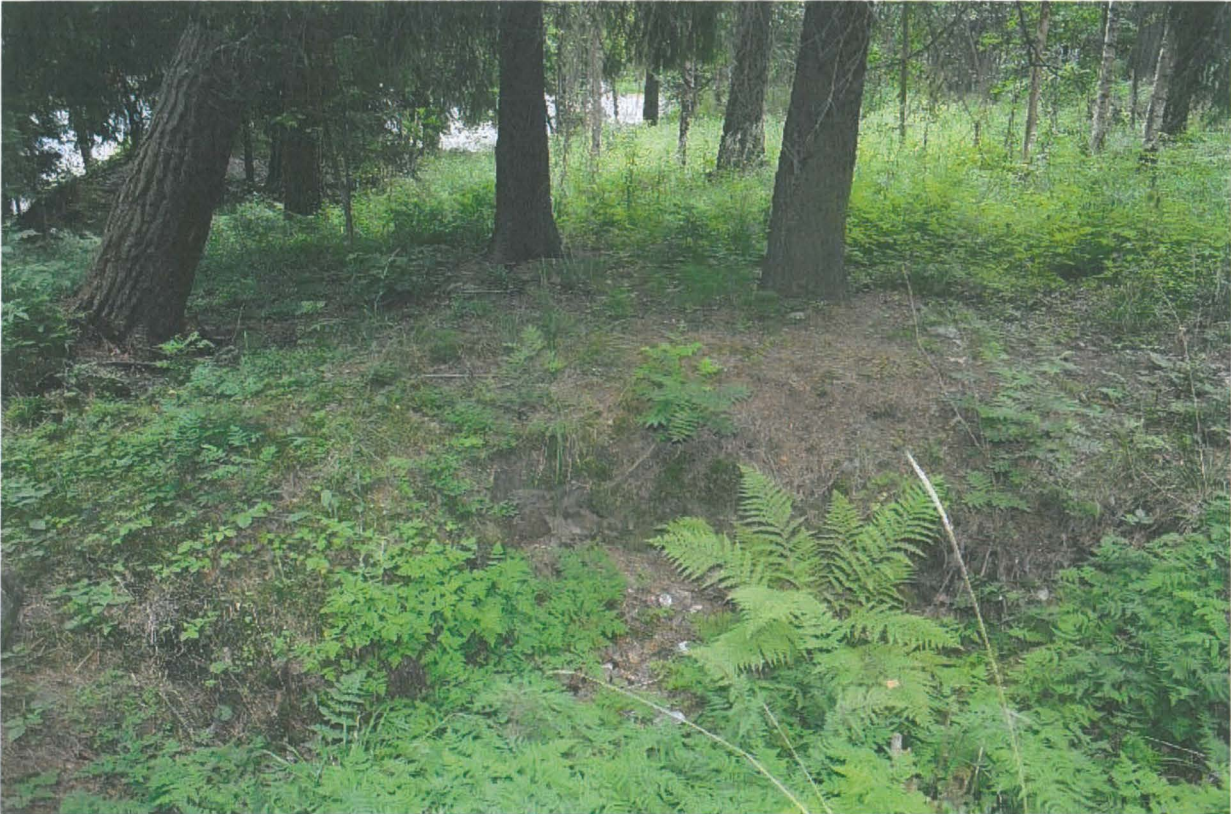
Suorakulmainen, rinteen puolelta vallin reunustama kuoppa, jolla on tuliasemalle sopiva sijainti. 15.7.2009