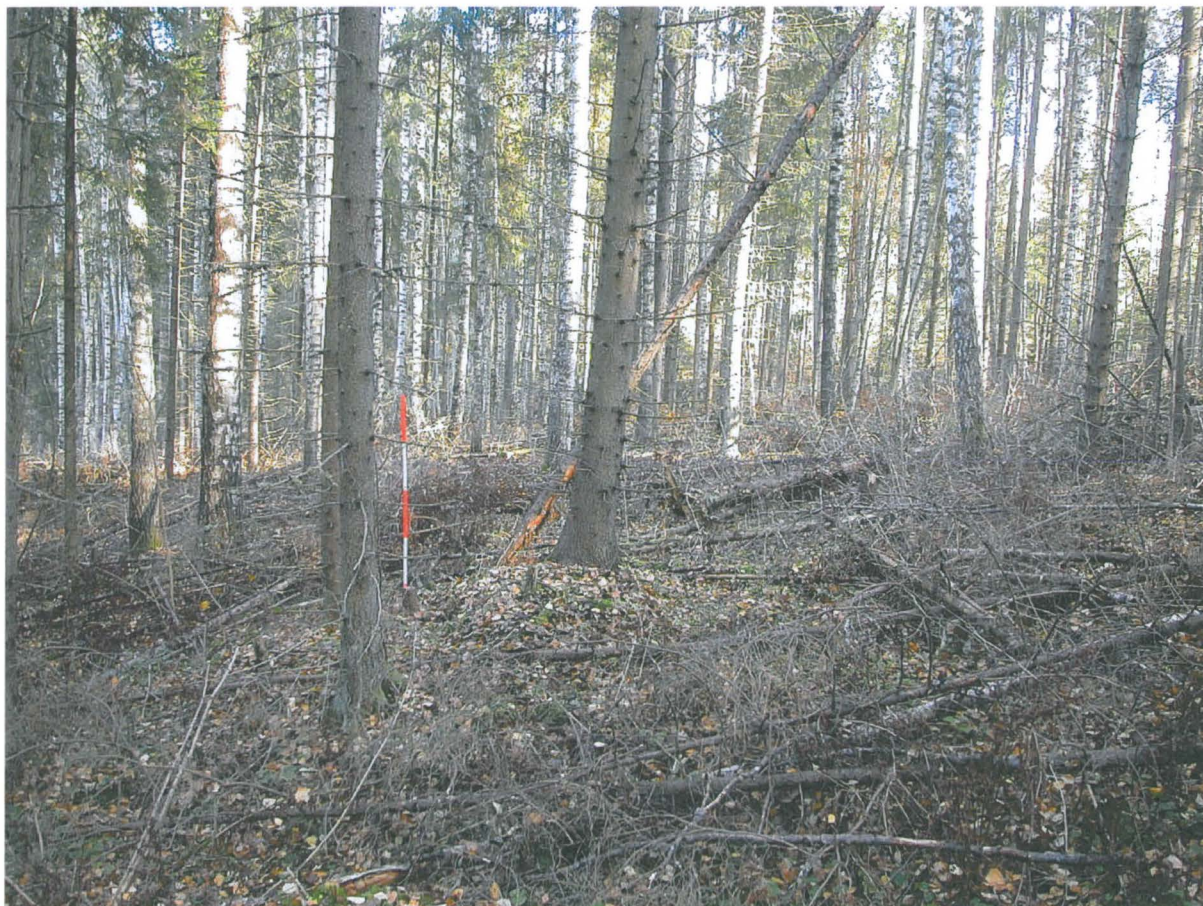
Yleiskuva tasanteesta, röykkiö keskellä. WNW 15.10.2008