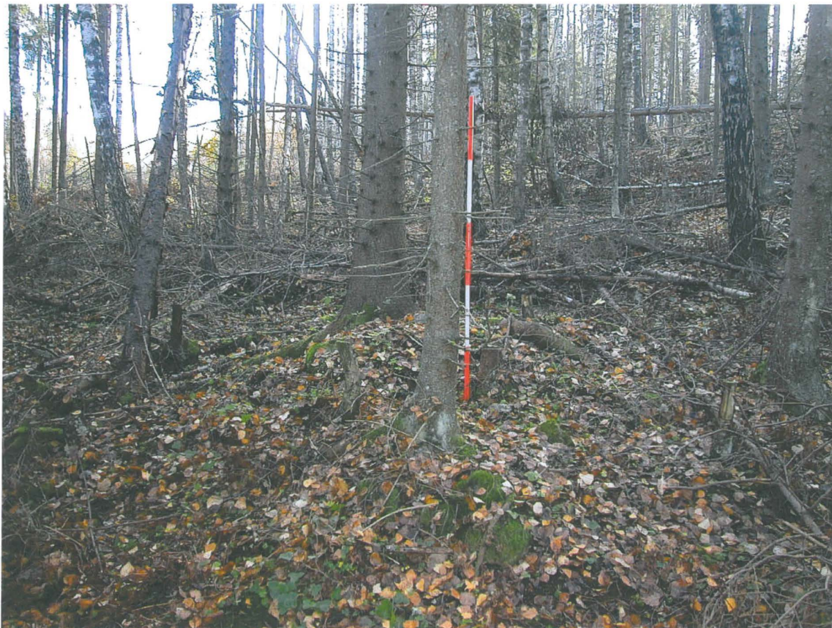
Kiviröykkiö. NNW 15.10.2008