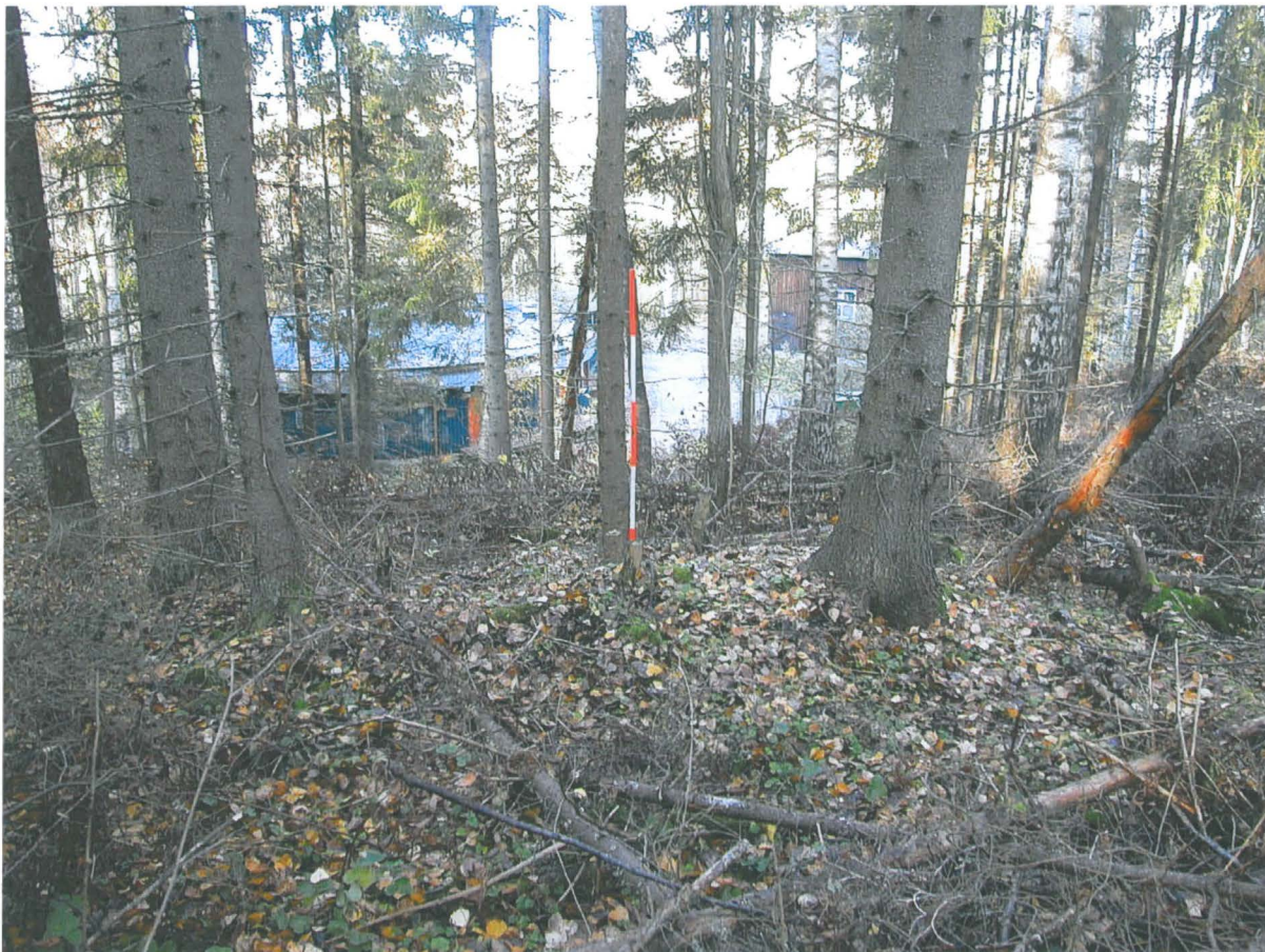
Röykkiö, taustalla puhdistamon rakennukset.