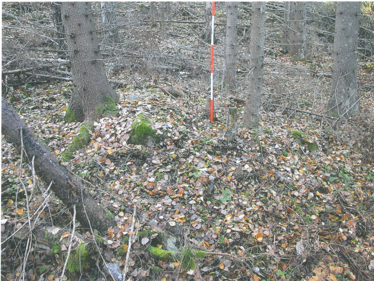
Kiviröykkiö.