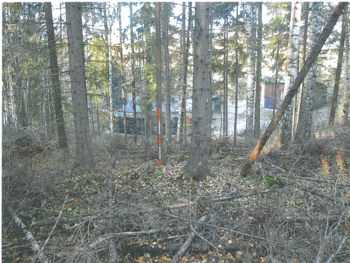
Röykkiö, taustalla puhdistamon rakennukset.