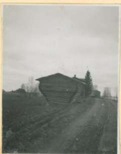
Tien varresta littohen Tappuraan 10171