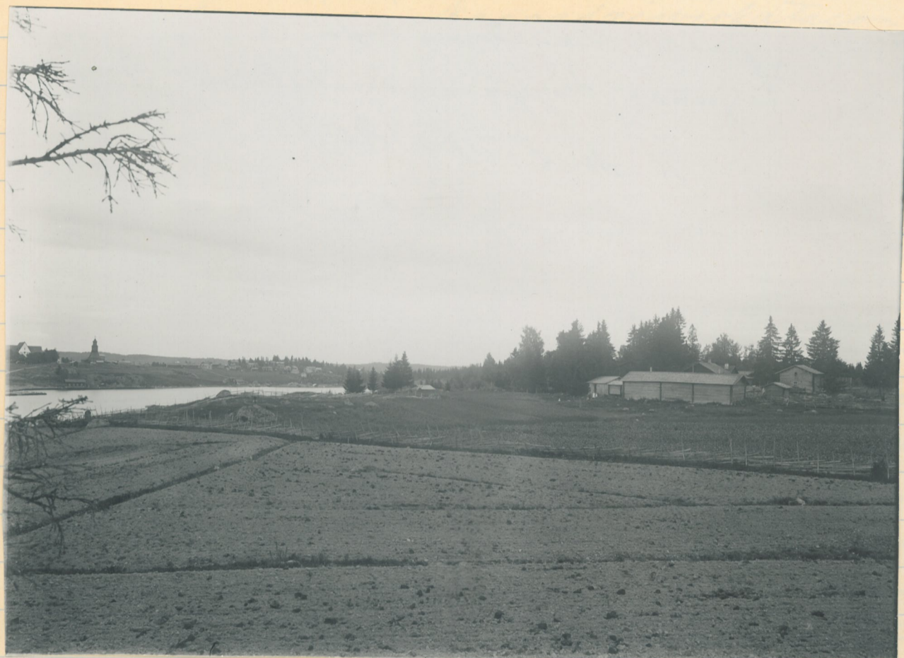
Kuva 3. Lempiäälä, Hauralan kylä. L. 131 Kiijakan Eppalaisriikatalon maata. H.M.L. n:o 4575:2. 2951