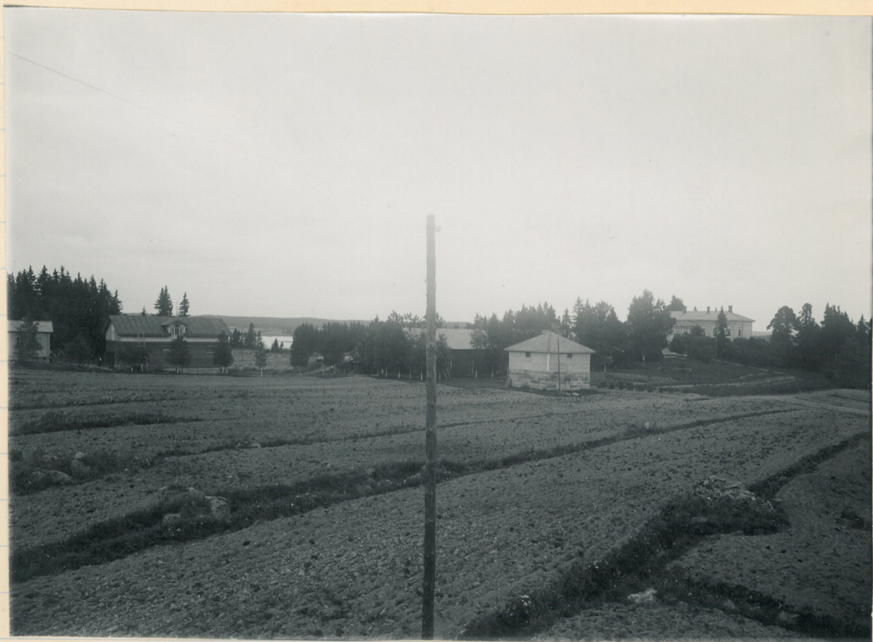
Kuva 2. Sama kuin edellä.