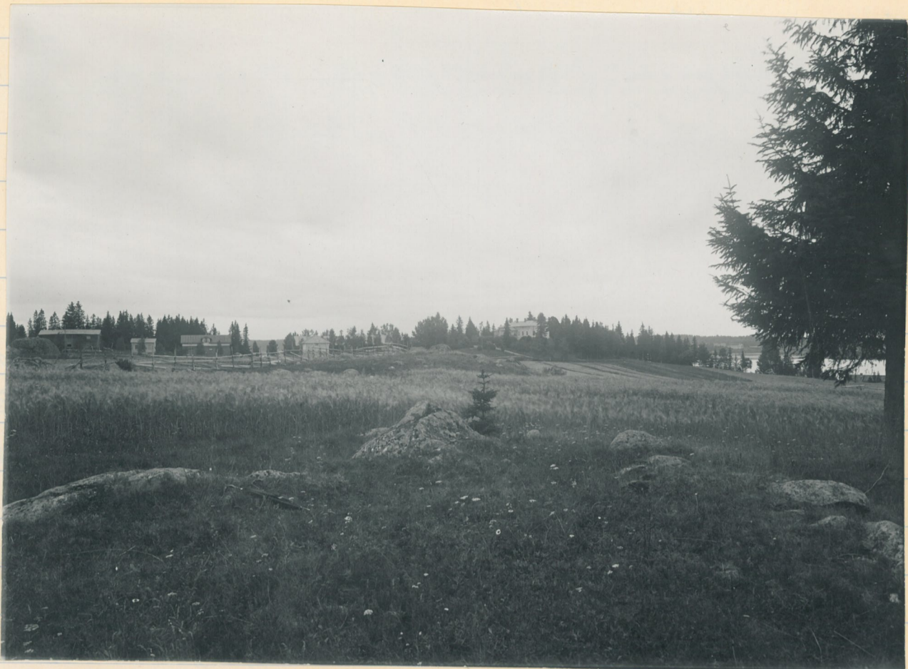
Kuva 1. Lempiälä, Hauralan kylä, Heunen. L. 131. Luettelo n:o 4254 ja 4244. 2949.