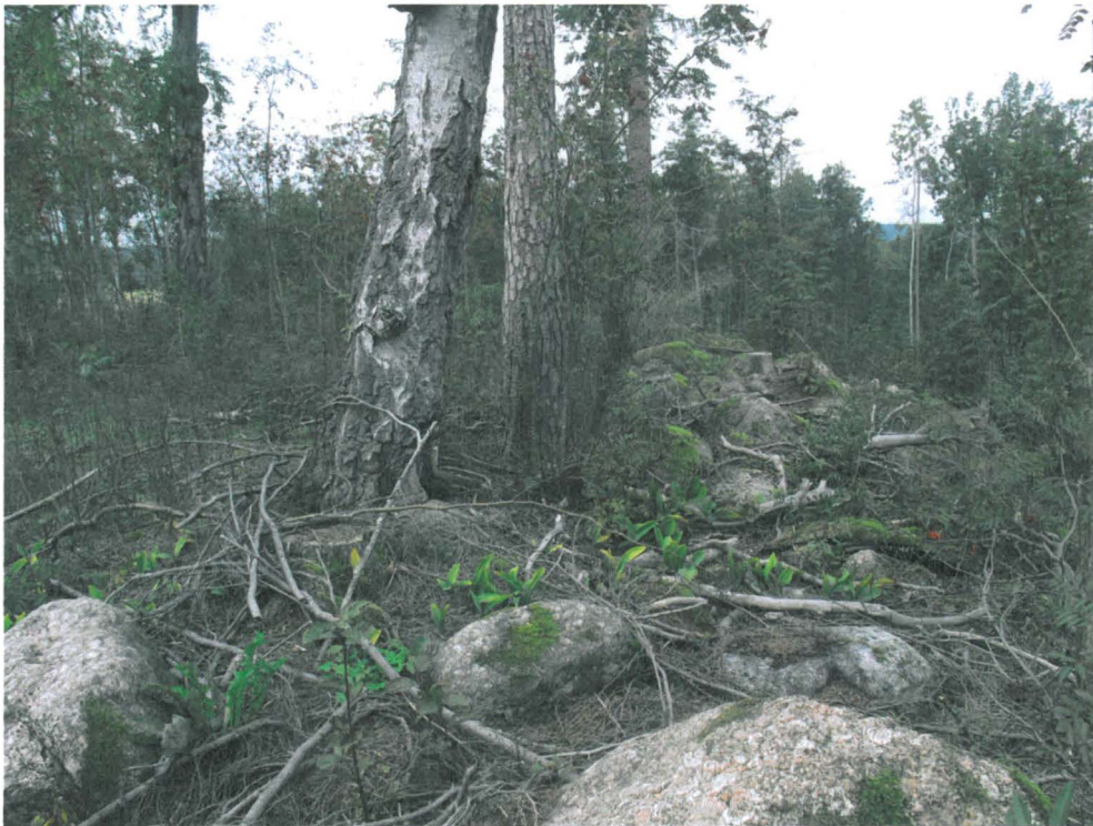
Kuva 6. Linnanmäen koillislaitaa. Kuvattu luoteeseen.