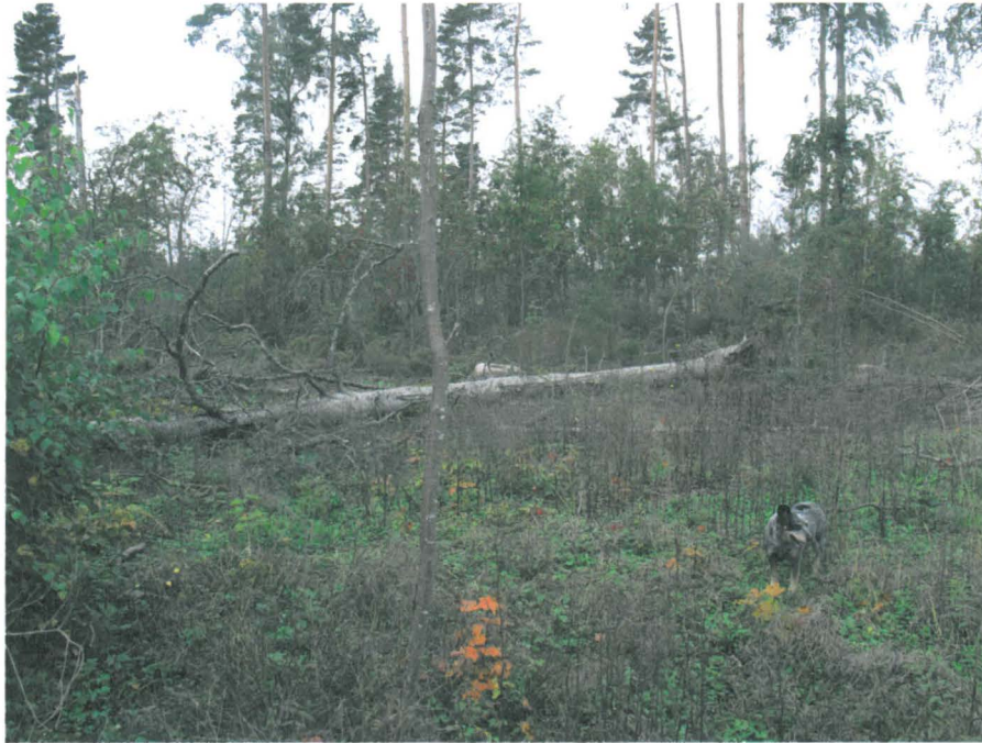
Kuva 3. Linnamäen laki. Kuvan keskellä olevan tuulenkaadon takana näkyy kärjäkivi. Kuvattu länsiluoteeseen.

Metsänhoidollisten toimenpiteiden synnyttämiä hakkuujätteitä ei nähdäksemme oltu siivottu kauttaaltaan pois. Hakkuujätteistä sekä tuulenkaadoista olivat jo lehdet ja neulaset varisseet pois, mikä osaltaan vaikeutti niiden erottamista toisistaan. Osittain muinaislinnan kivimuurin jäännöksiä peitti sakeakin oksien ja rankojen rytö, mitkä tarkastuskäynnin yhteydessä tulkittiin metsänhoidon aiheuttamaksi hakkuujätteeksi.