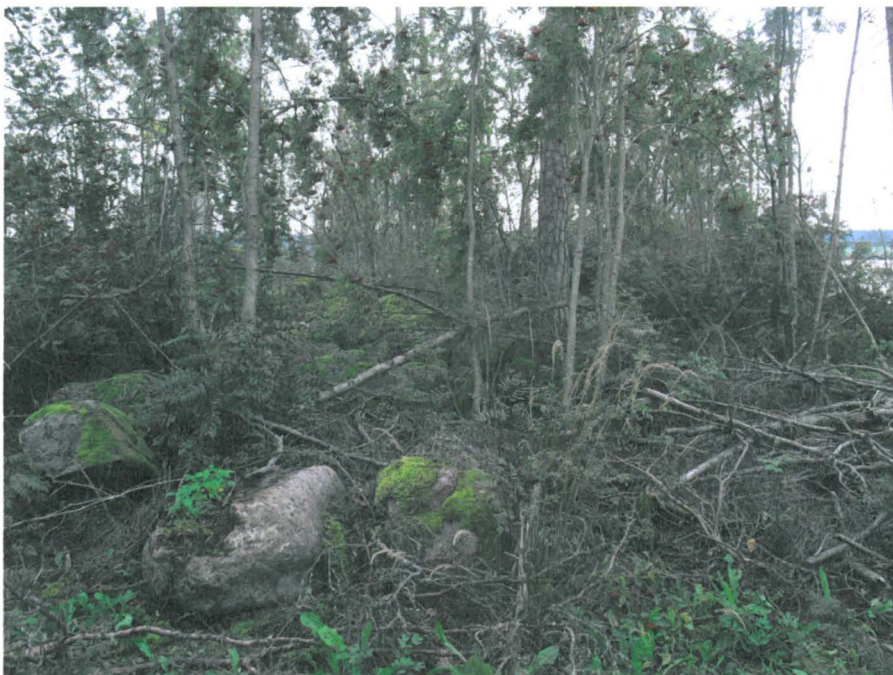
Kuva 4. Linnanmäen länsilaitaa. Kuvattu etelään.

Metsänhoidollisten toimenpiteiden synnyttämiä hakkuujätteitä ei nähdäksemme oltu siivottu kauttaaltaan pois. Hakkuujätteistä sekä tuulenkaadoista olivat jo lehdet ja neulaset varisseet pois, mikä osaltaan vaikeutti niiden erottamista toisistaan. Osittain muinaislinnan kivimuurin jäännöksiä peitti sakeakin oksien ja rankojen rytö, mitkä tarkastuskäynnin yhteydessä tulkittiin metsänhoidon aiheuttamaksi hakkuujätteeksi.