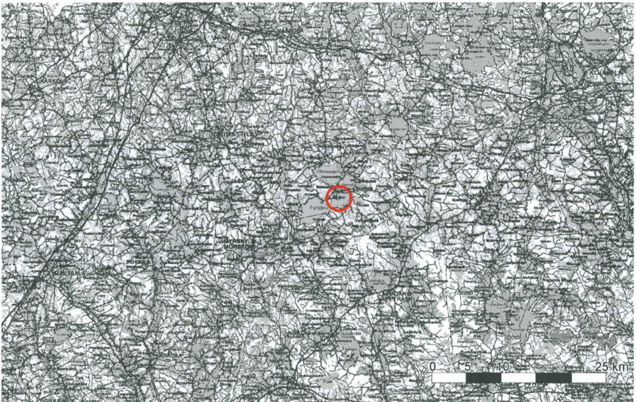
Kuva 1. Lähestymiskartta Linnanmäen sijainnista. Pohjakartta: Maanmittauslaitos 2012.

Kunta: Orimattila, entinen Artjärvi Kiinteistörekisteri nro: 560 - 427 - 1- 265 Maanomistaja: Pehr Evind Borup, Kinttulan Kartano Kinttulankuja 100, 16200 Artjärvi. Puh: 050 049 7150 Peruskartta: 3022 09 Artjärvi Koordinaatit ETRS-TM35FIN: 6733654.70, 449221.82, z n.50 alin (N60). Muinaisjäännösrekisteri: 15010001, Linnanmäki