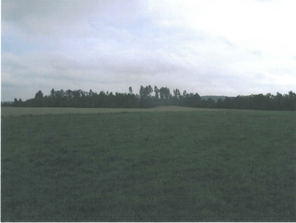
Kuva 7. Linnanmäki erottuu selvästi ympäröivästä metsästä harvennetun puuston vuoksi. Kuvattu itään.