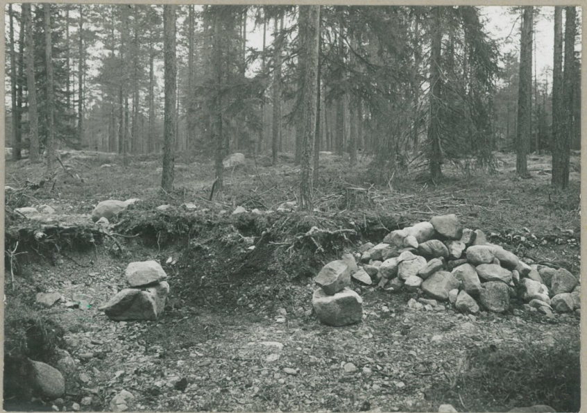
Kuva 2. Sama paikka itäkkäältä, mielit samoissa graikoissa kuin kuvassa 1, etualalla

Seisova vasarakirveiden löytöpaikalla. Valok. 27.8.1932.