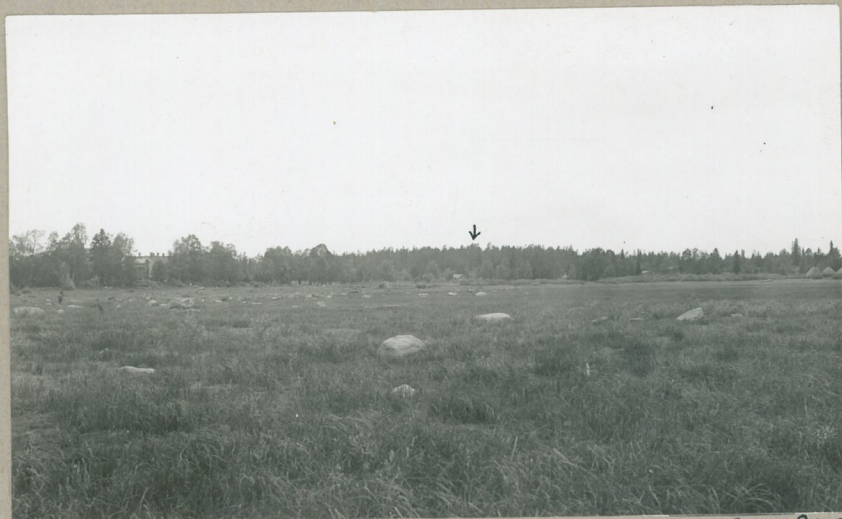
Kuva 4. Kuoppakan- gas (V) jokseenkin i- däntä, Tähkäjärven veni- jätiltä.