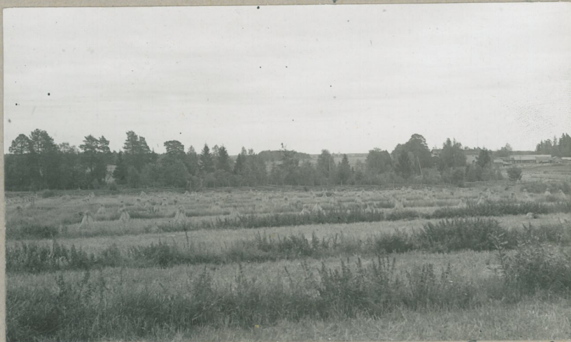
Kuva 5. Näköala Kuoppakangaan itäreu- nanta itäis. Tähkäjärven vesijätölle, jonka takaa näkyvät Merijärven Kirkko ja tupa- lat.

Vas. Tanskan Falaja. Valok. 27. 8. 1932.