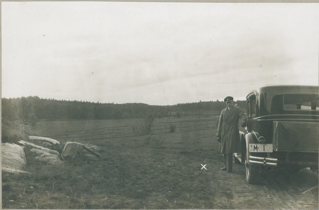
Mikkelin pitäjä, Mikkelin püriineli- sairaalaksi järjestetty Moirion tila Lato Kallion laita, myöhäisimmän rautaauuden löytöpaikka (x). Tatok. J. Ailio 9/VL 1931.