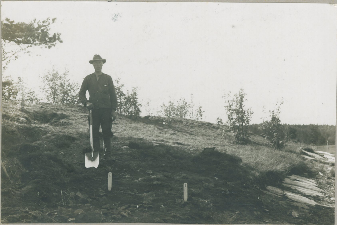
Mikkelin pitäjä, Moirion tila, Lato Kallion laita, myöhäisimmän rautaauuden arkuinen kodanpöytä, esillekavranut ja valokuvannut J. Ailio 10/VL 1931.