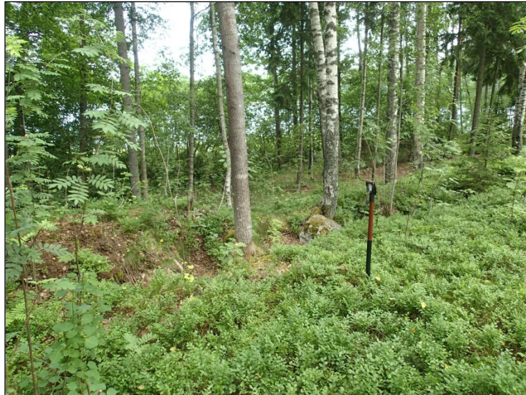
Rantatörmälle ja -vallille tehdyn juoksuhaudan jäännöksiä.