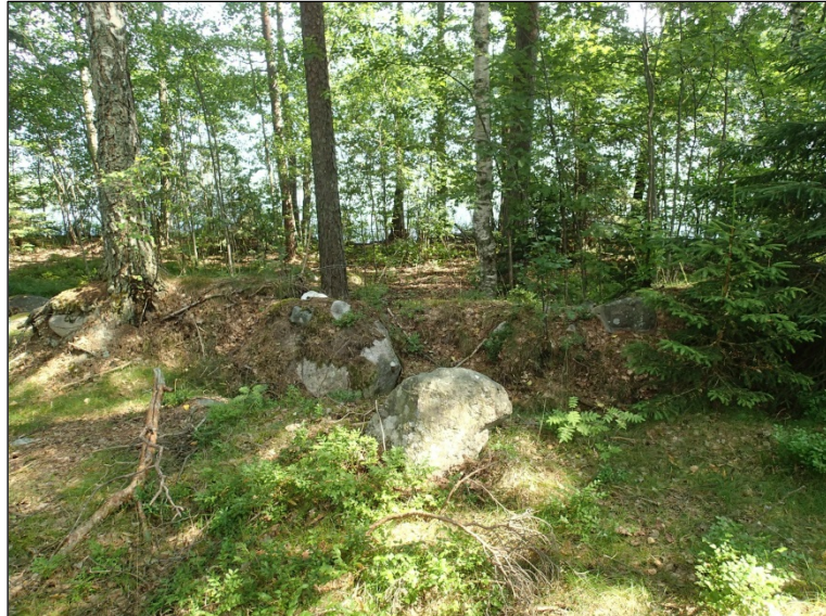
Rantatörmälle ja -vallille tehdyn juoksuhaudan jäännöksiä.