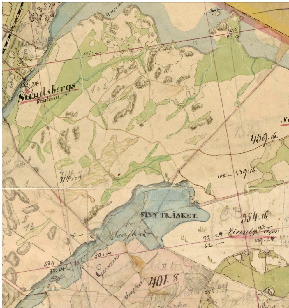
Ote Kirkkonummen pitäjänkartasta 1840-luvulta.