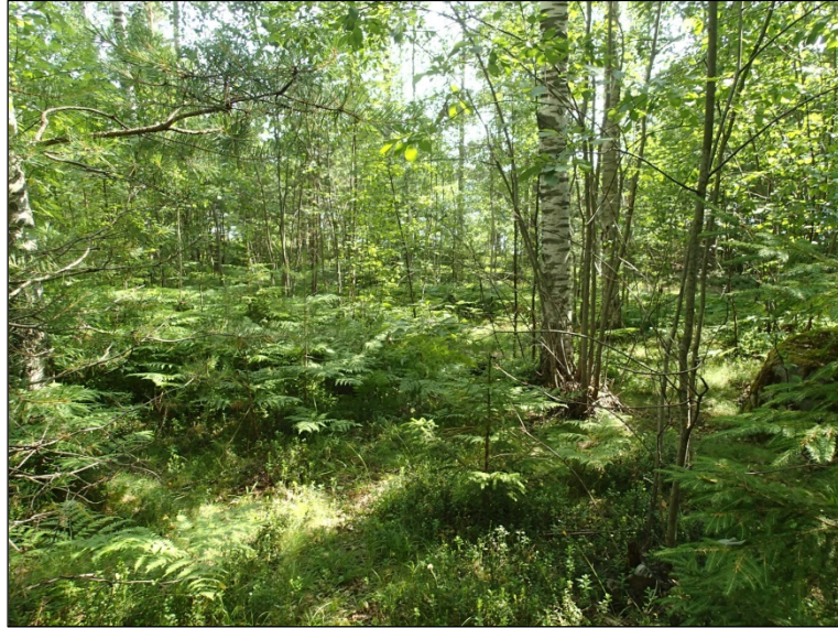
Vanhaa niittytaata alueen keskiosan rannan tuntumassa