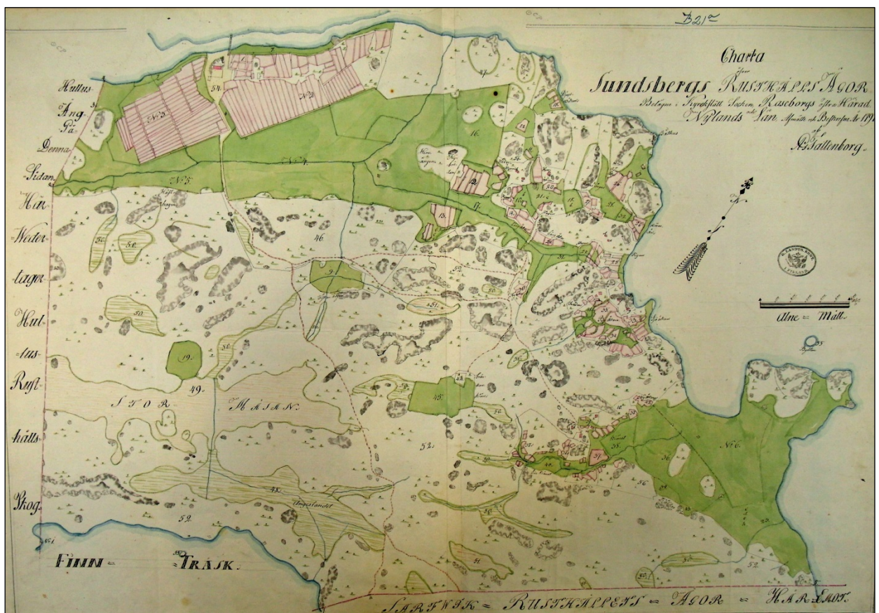
Sundsbergin Rusthollin isojaon toimituskartta v. 1791. (Kansallisarkisto B21a 18/2). Kartta kattaa tutkimusalueen sen osan joka ulottuu järven rantaan. Tutkimusalueen itäosasta jää kartan ulkopuolelle n. 400 m pitkä, kapea kaistale. Muiden karttojen perusteella sielläkään ei ole ollut asutusta hist. ajalla.