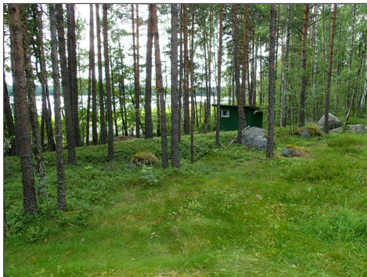
Vanha rantavalli alueen itärannalla.