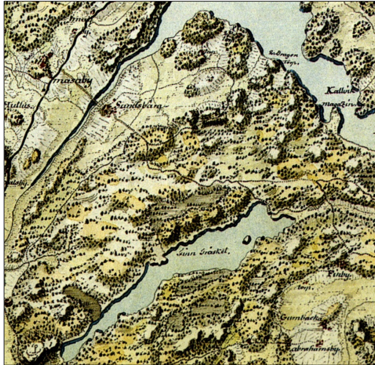
Ote ns. Kuninkaan kartasta 1700-l lopulta.