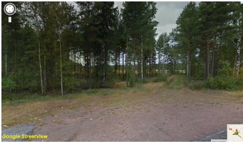
Putkilinjan maastoa valtatie (3) lounaispuolella, lounaaseen.