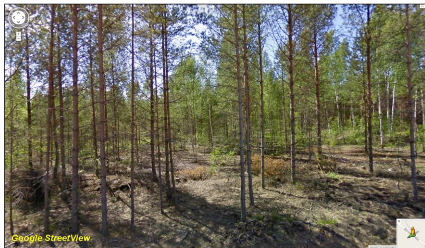
Putkilinjan maastoa Sievarintieltä lounaaseen.

Kameran vian takia raportissa on jouduttu turvautumaan Google StreetViewistä otettuihin kuviin.