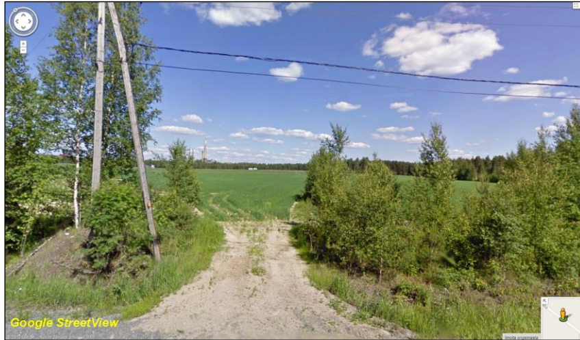
Putkilinjaa Sievarintieltä koilliseen