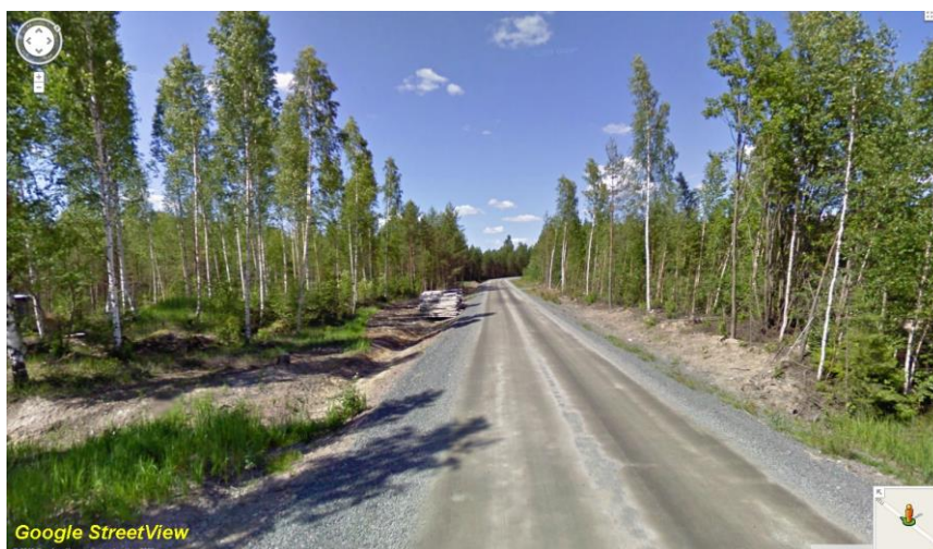
Putkilinja Sievarintien vartta vasemmalla, luoteeseen.