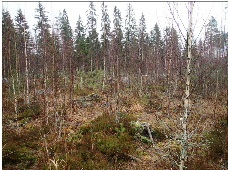
Tyypillistä melko kivistä hiekkamoreeni-alueita Leppäjärvien eteläpuolella. Kuvattu itään.