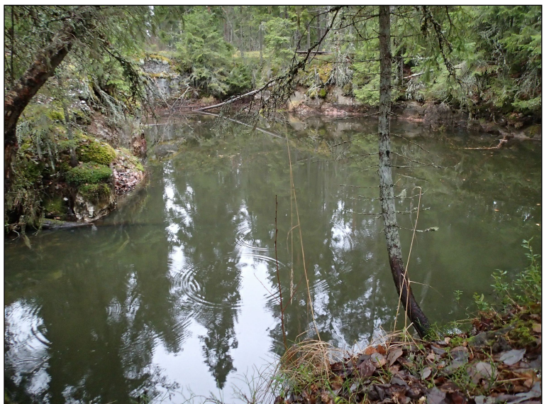
Pyörönmaan louhoskuoppa kuvattuna pohjoiseen.

Maastokartassa louhos on merkitty vain kuoppana, mutta tosiasiaassa se on noin 25 m pitkä ja enimmillään yli kymmenen metriä leveä jyrkkäreunainen lampi. Louhoksen eteläpää (N 6802085 E 338871) on parin kymmenen metrin päässä suunnitellusta voimalinjasta. Maastokartassa 120 m mpy. korkeuskäyrä rajaa louhoskuopan pohjoisosan. Kuopan ympärillä, varsinkin sen eteläpuolella, on jätäkiveä epätasaisena kerroksena, jonka rajoja on heinikkoisessa taimikossa vaikea hahmottaa. Louhos on kohde, joka on syytä huomioida linjan suunnittelussa, mutta sitä ei voitane ikänsä vuoksi pitää kiinteänä muinaisjäännöksenä.