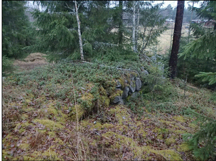
Kumpareen laelta pohjoiseen suuntautuva luonnonkivinen ajosilta. Taustalla pellolla näkyy Mattilan talon rakennuksia.

sessä on betonisia rakennuksen perustuksia ja metalliromua, joten paikalla on ollut rakennus vielä melko äskettäin. Ajosiltakaan tuskin on 1900-luvun alkua vanhempi, eikä sitä voitane pitää kiinteänä muinaisjäänöksenä. Eteläpuolella kumpareella ja muuallakaan lähiympäristössä ei havaittu muita rakennusjäänöksiä, joten ajosilta ja sen alla olevat rakennusjäänökset liittyvät todennäköisesti pohjoisempana pellolla olevaan Mattilan taloon (ks. kansikuva).