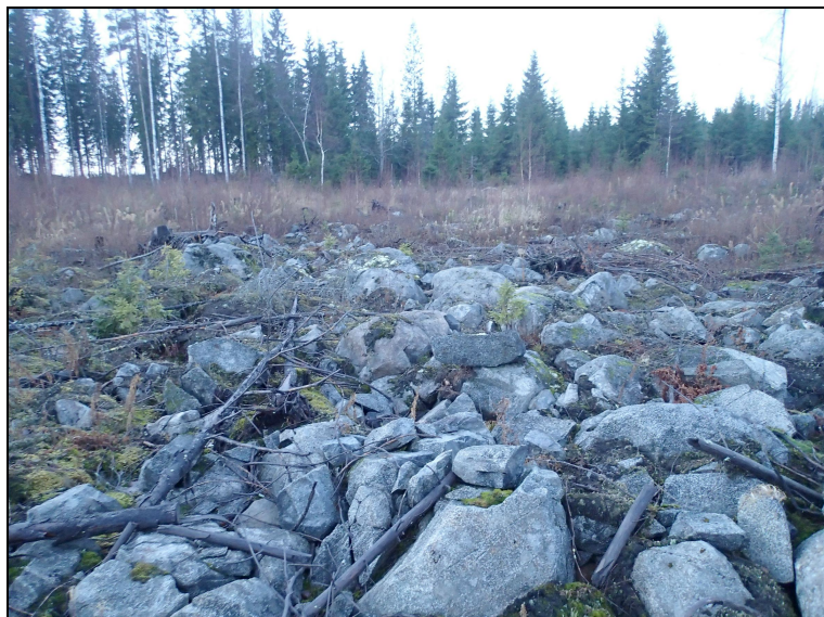
Louhikkoista moreeni-alueita Jäniskallion pohjoispuolella. Kuvattu pohjoiseen.

Koko voimalinja käveltiin läpi lukuun ottamatta seuraavia osia. Idässä tarkastamatta jäi yksi pylväsväli, koska linjaa pitkin länneä saavuttaessa Isosta Leppäjärvestä laskeva joki osoittautui