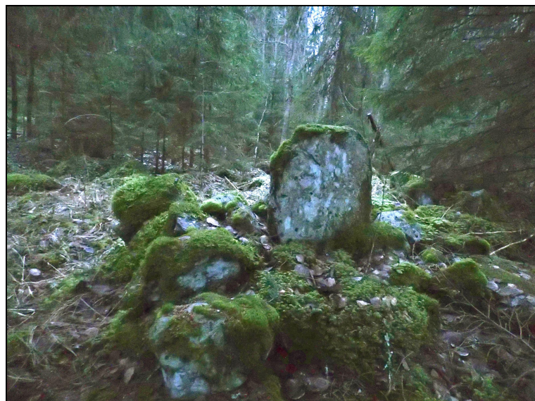
Rajamerkki kuvattuna etelään.

Entisen rajapisteen merkinä on noin 2 m x 2 m kokoinen ja noin 50 cm korkea suorakulmainen kivilatomus. Sen keskellä on noin 50 cm korkea, 50 cm leveä ja 15 cm paksu pystykivi. Kivi on silmämääräisesti arvioiden suunnattu rajapyykistä itään lähtevän entisen Kangasalan rajan suuntaisesti. Kiven pohjoissivulla on hakkaus: "184."