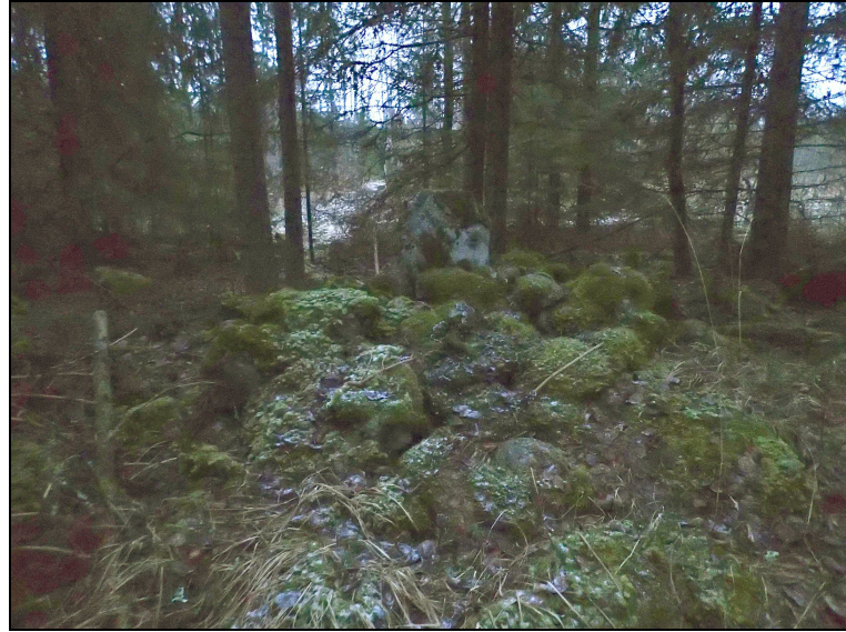
Rajamerkki kuvattuna pohjoiseen.