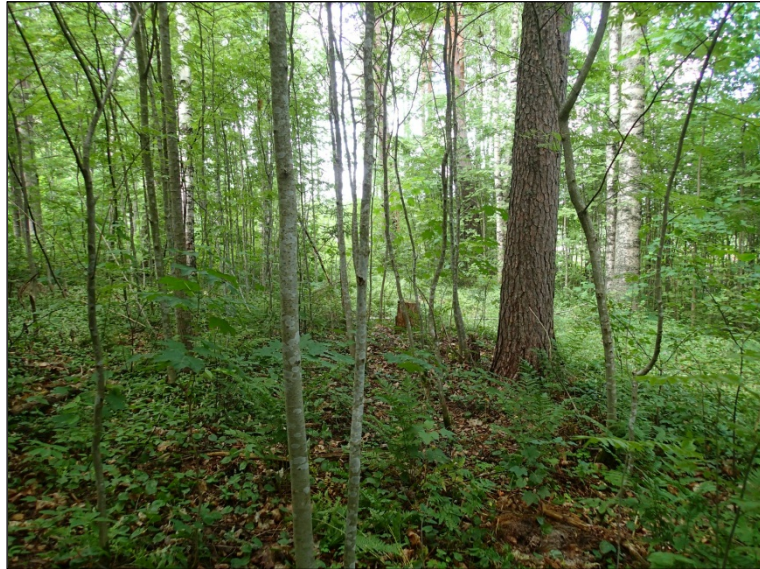
Tasanteen maastoa alueen pohjoisosassa. Taustalla näkyy tieura. Koilliseen.