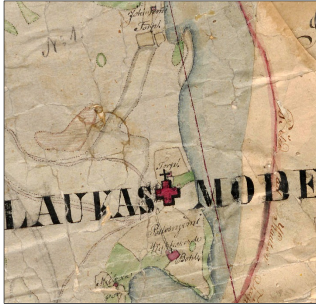
Ote 1840-I pitäjänkartasta