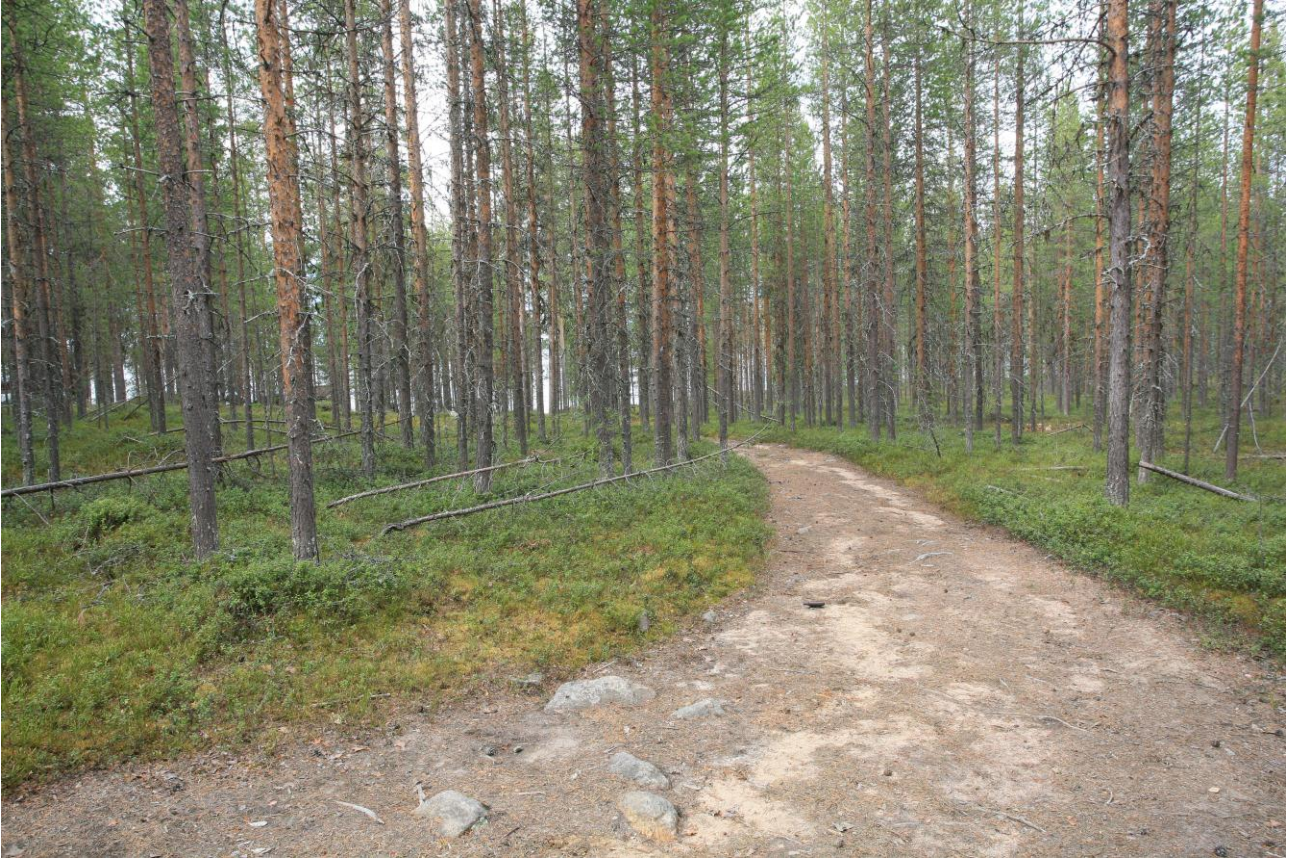
Kolari Pasmajärvi Piilola. Löytökohta etualalla, taustalla Pasmajärvi. Pohjoiseen.