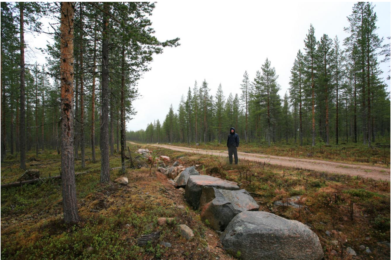
Kolari Kursunvuoma. Löytökohta tieleikkauksessa. Kuvassa EH. Länestä.