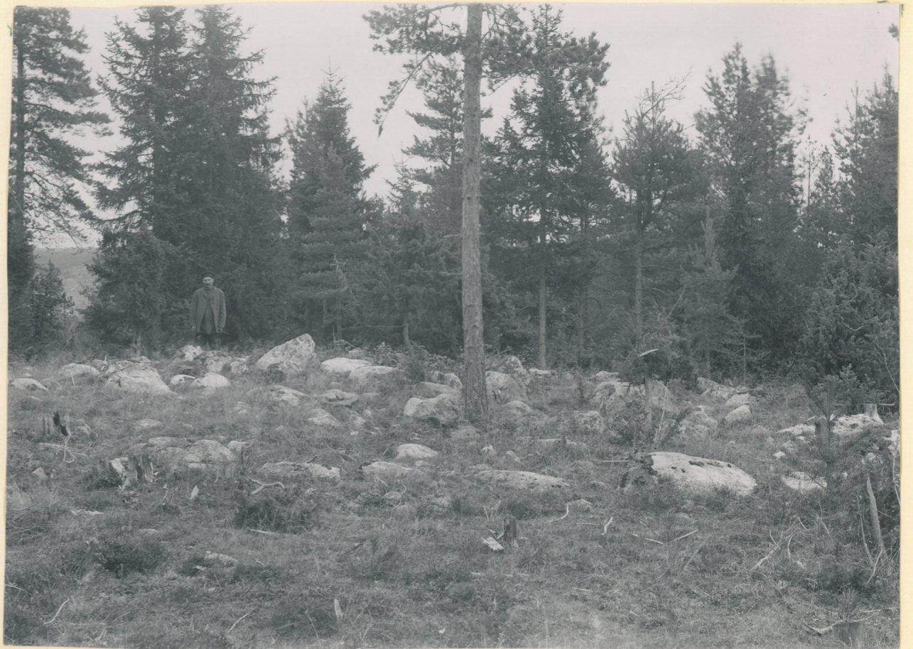
Botten af ett förstördt stenrummel i skogen 2991 N O från Sagu prästgård.