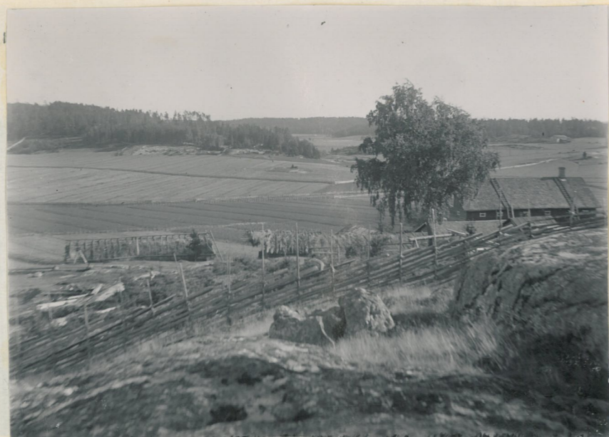
4. Myllymäki sett från N.W.