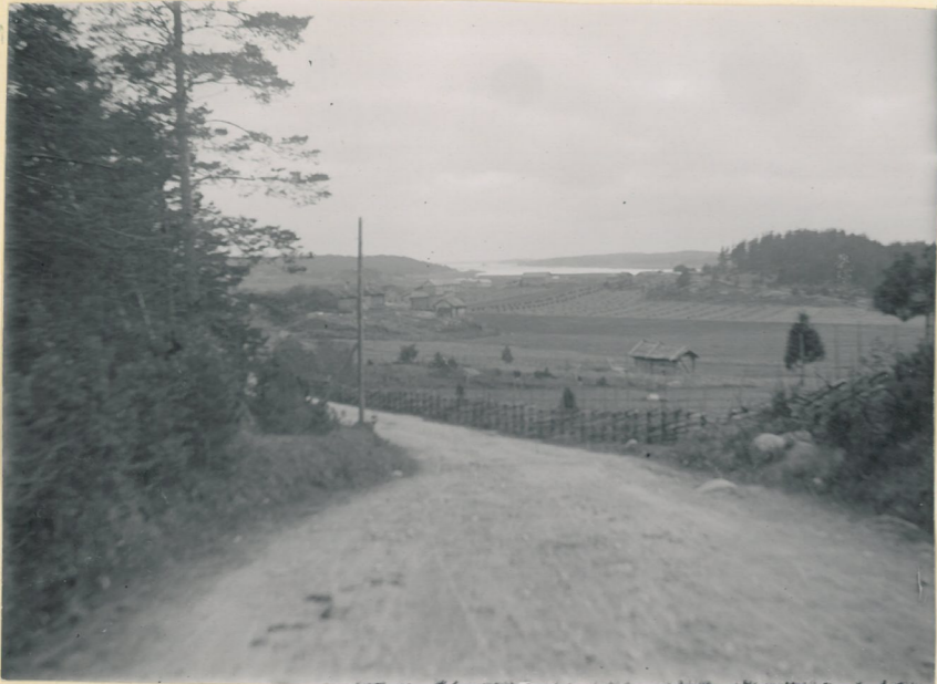
Utsikt öfver Remar-å dalen med 2974 Remarviken i fonden.