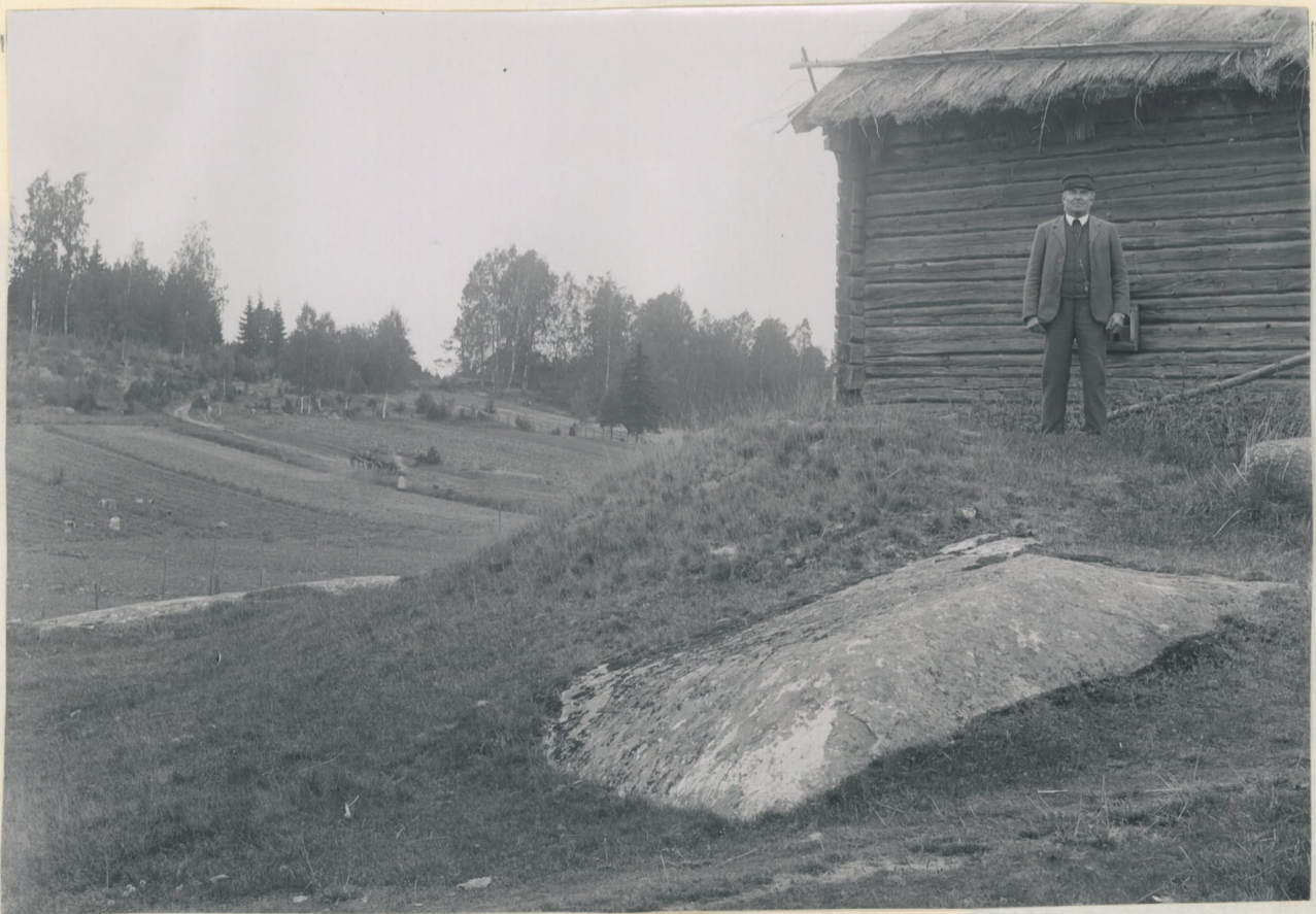
10. Lautakankareenniemi sedd från S, från Simaniemi.