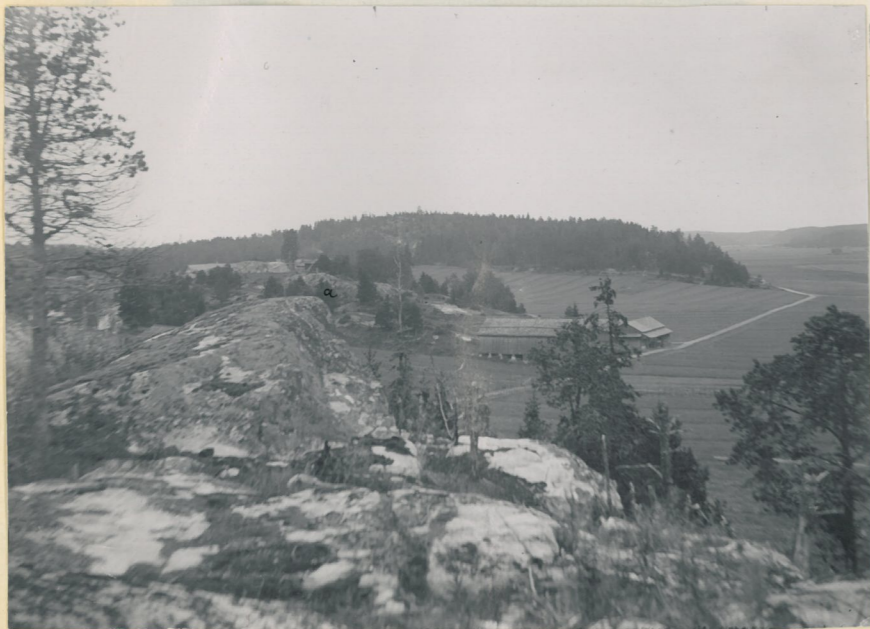
7. Linnamäki (a) och Lautakankarenmäki (b) sedda från SSW, från Hyllymäki vid Salmi by.