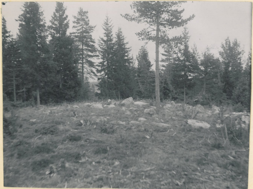
Botten af ett förstördt stenrummel i 2992 skogen N O från Sagu prästgård.