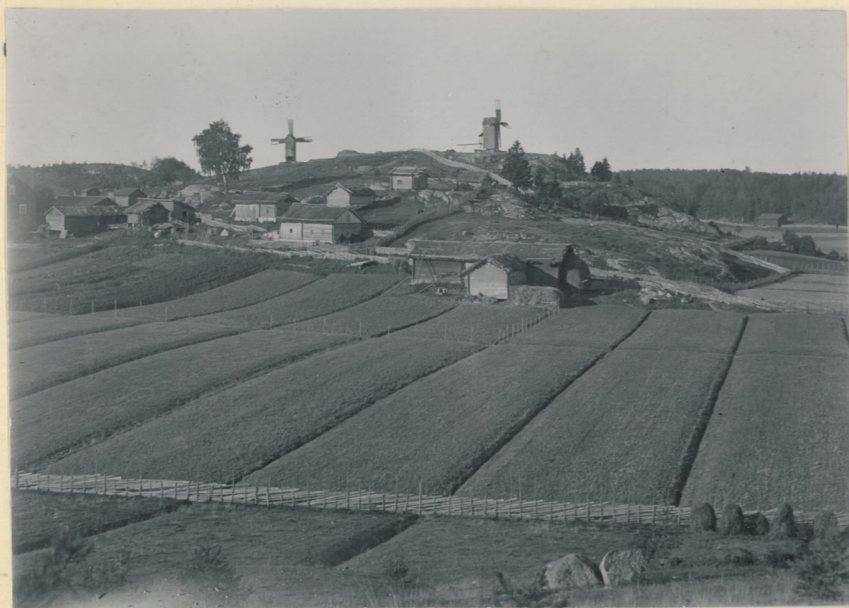
1. Salmi by och Myllymäki, sedda från NO.