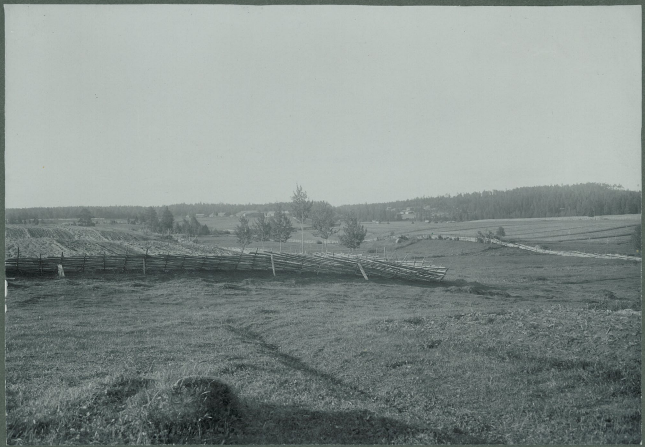
Kivikauden löytöpaikka Suodenniemessä Kukkulan torpan maalla, läh. Jyllin talon löytöpaikat Sharivainio oikealla Roikunmaa - kynnety pelto - vasemmalla; Hruustassa on Jyllin talon Savi- ja Lujiaisjoen tekemässä niemessä