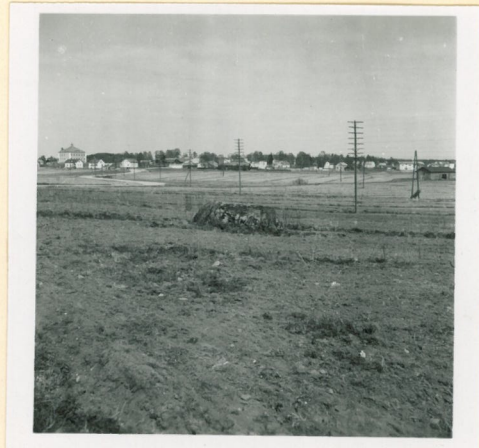
f. 17774. Syönä, Suur- kylä. Ulrikivi etualalla Takana Syönän keskus- taa, vasemmalla yhteis- koulu.