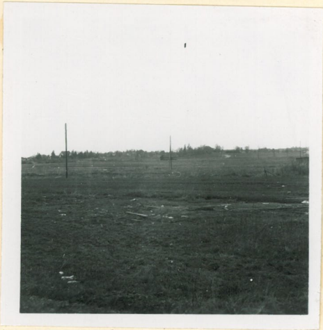
f. 17773. Syönä, vasemmalla Takana kirkko. keskellä sakana Suurkylän kartano. Pura otettu Syönän kes- kuksesta.