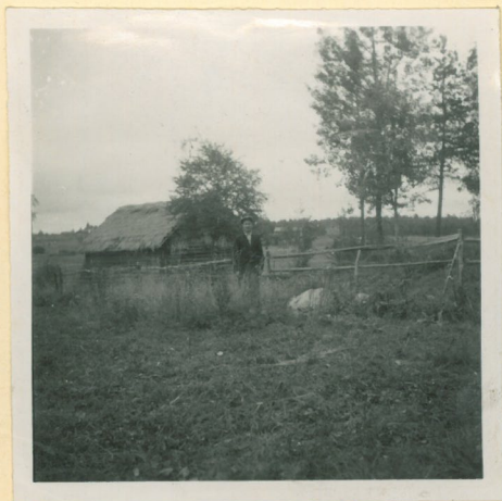
Liponmäki. Löytäjä Fortikka seisoo kätö paikalla ison hiven vieressä