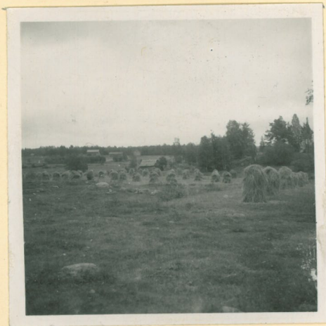
Liponmäen hopea- aartien löytöpaikka kuvattuna silan asuin- koneilta käsin