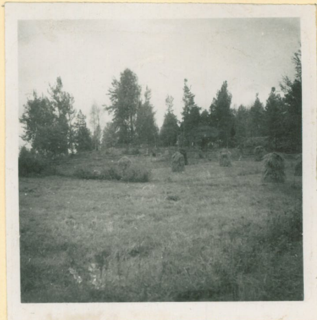
Liponmäen aartien löytöpaikalla seisovat löytäjä ja kirjakuopp. Larén