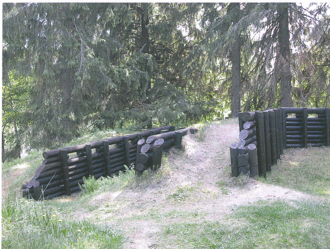
Kostianvirran eteläinen muinaisjäännösalue, varustuksen rekonstruktio, puut tervattu kesäkuussa 2013. Kuvattu lännestä.