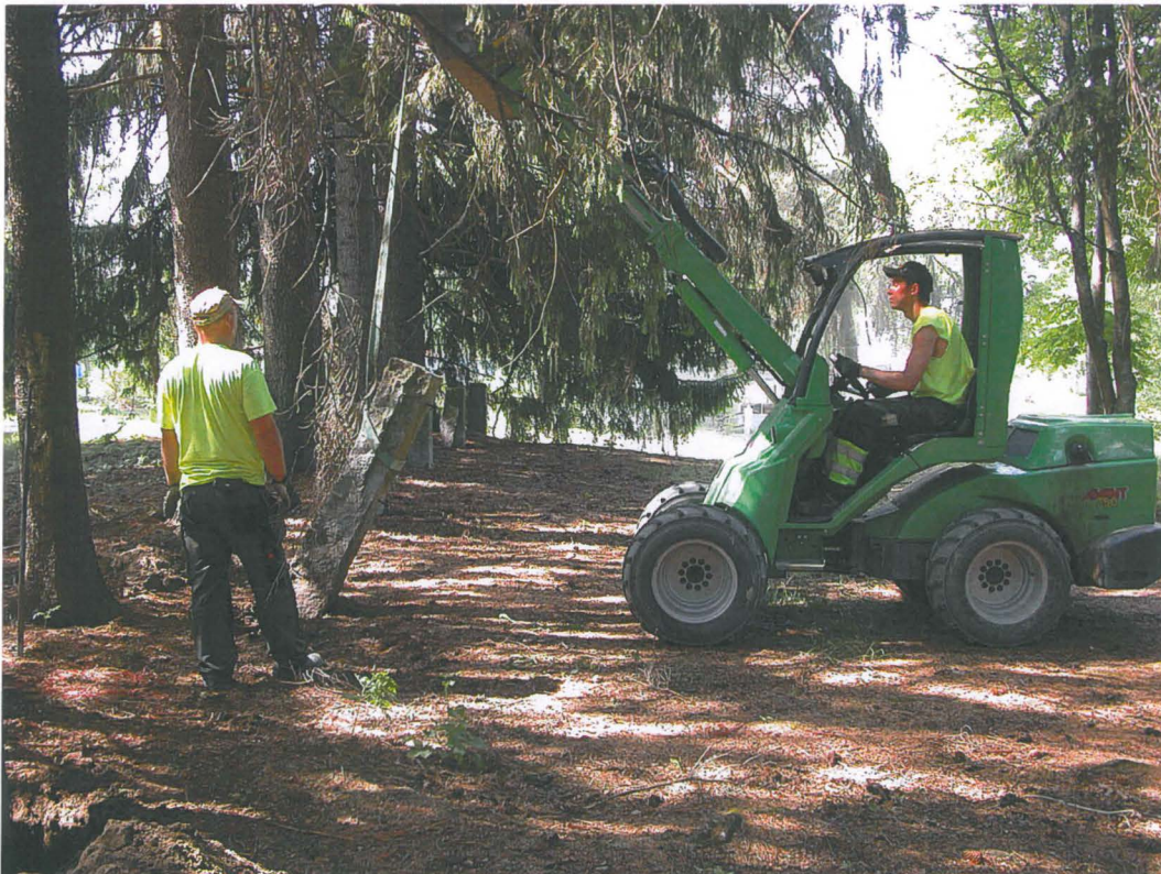
Pylvään nosto, kuvattu pohjoisesta. Ulla Lähdesmäki 3.6.2013.