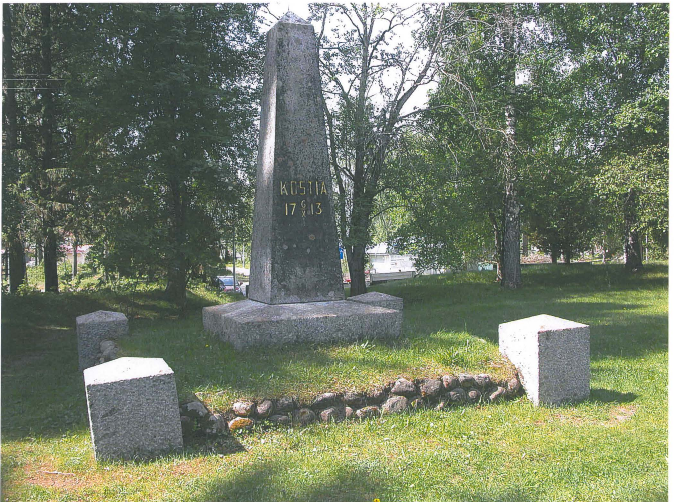
Muistokivi Kostianvirran taistelusta (6.10.1713), kuvattu kesäkuussa 2013 puhdistuksen jälkeen. Kuvattu koillisesta.

Museovirasto RHO:n arkisto. Pirkanmaan kiinteät muinaisjännökset 1996, nro 37 a ja b