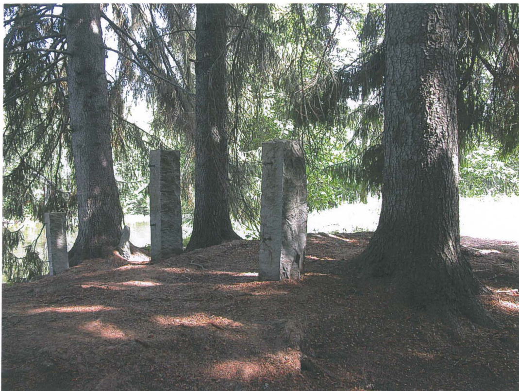
2. - 3. pylväs vaihdon jälkeen. Kuvattu lounaasta. Ulla Lähdesmäki 3.6.2013.