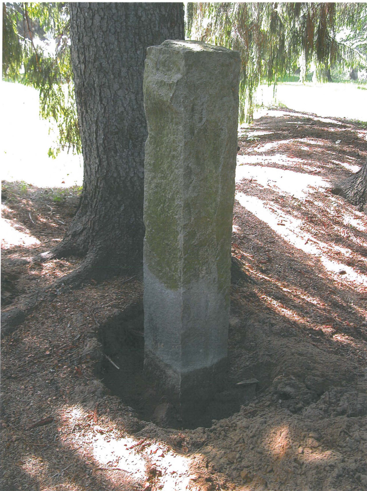
Pohjoisesta laskettuna 3. pylvään juurta kaivetaan esille, kuvattu lounaasta. Ulla Lähdesmäki 3.6.2013.