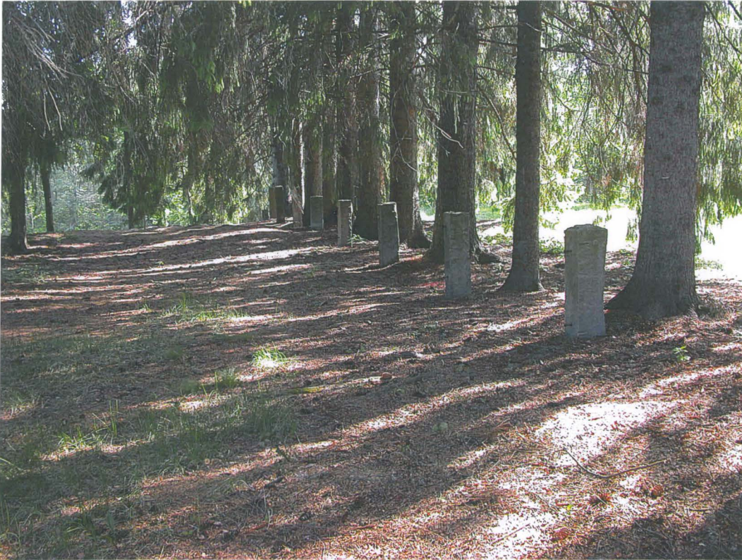
Aidan kivipylväistö Kostianvirran muistomerkin länsipuolella. Vaihdevat pylväät ovat 2.-3. pylväs kuvan taka-alalta laskettuna (aidan pohjoispää) ja 7.-8. pylväs (kuvan keskellä). Kuvattu etelälounaasta. Ulla Lähdesmäki 3.6.2013.