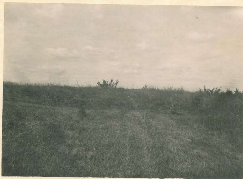
6301 Fot. f. O.