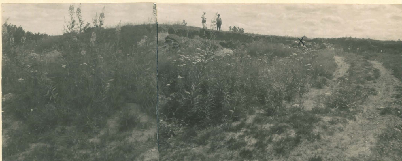
6299-300 Lunkankulla, Grind, fot. från V. Ungefär vid X hittades 8586