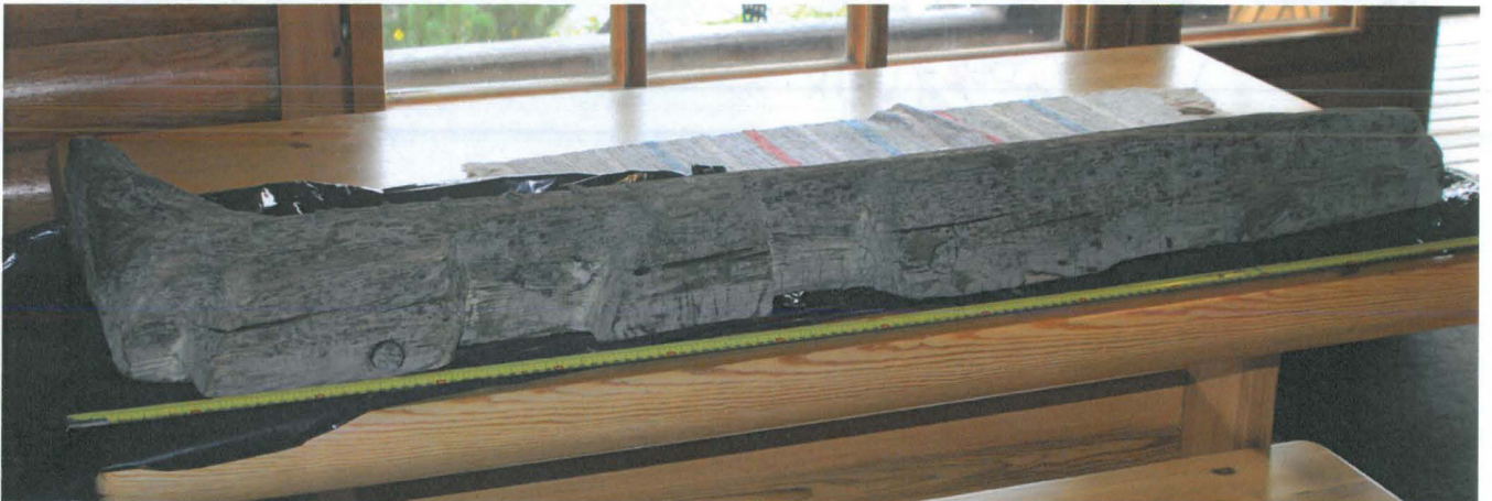
Polven takaosa, jossa loveukset.