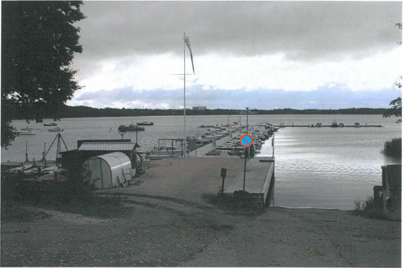
Ruukinrannan vierasvenesatama. Uusi laiturityömaa sijaitsee tämän pohjoispuolella eli kuvan ulkopuolella vasemmalla.