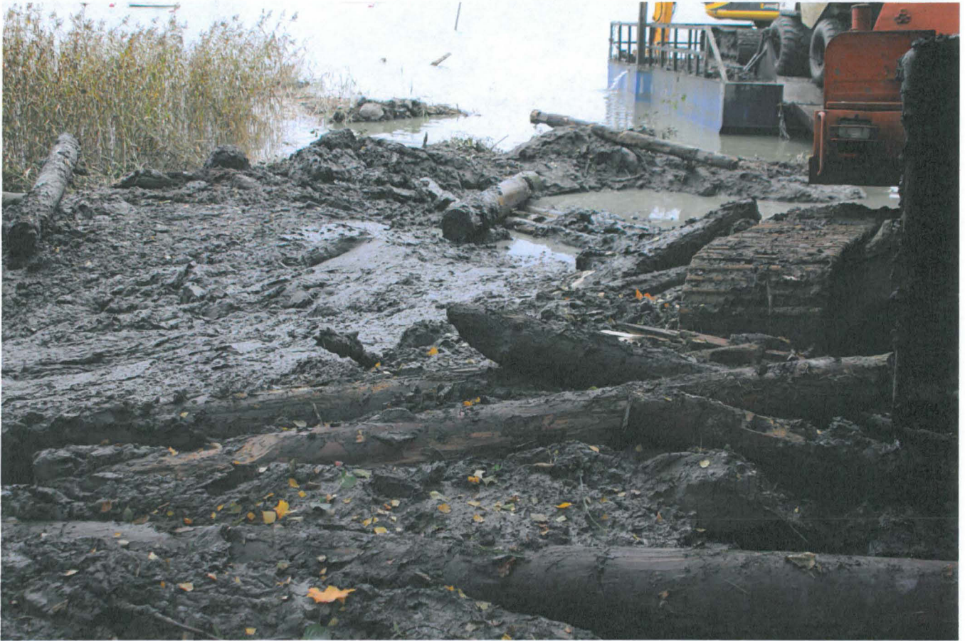
Ruopattuja hirsiiä rannassa.