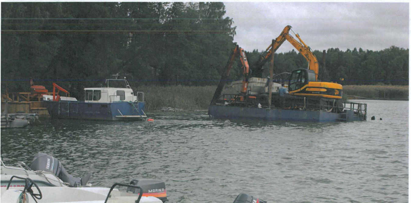
Ruoppaustyömaa. Kaivinkonelautan takana vedessä kelluu ruopattuja hirssiä. Työmaavene on kiinnitetty jo rakennettuun uuteen laituriin (vasemmalla), johon tulevat kaksi ponttonilaituria ja lisäosa kiinnitetään.