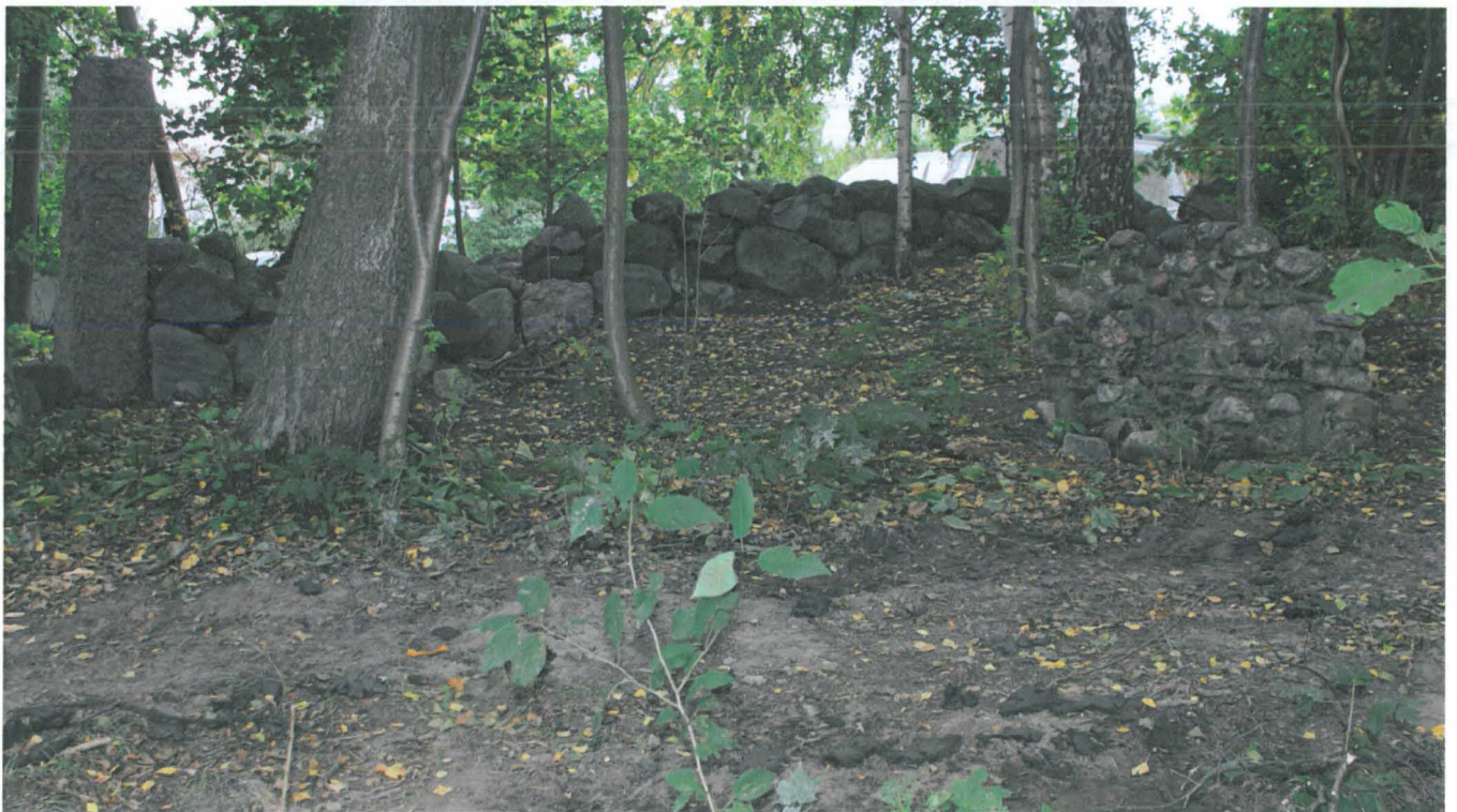
Åkerblomin kartanon kiviäitä ja portti, oikealla portinvartijan tuvan seinän jäännökset.