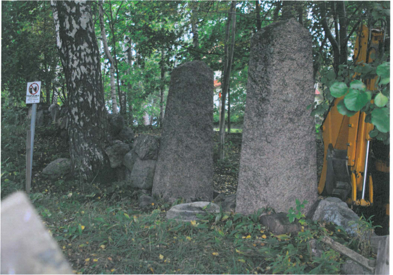
Ruoppausrannan yläpuolella Åkerblomin kartanon (rakennettu 1910) kiviäitä ja sisäänkäyntiportti.