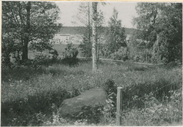
Laudentaan Kirkkovalkamaa onie- keanhiöntakivi vastamaantieltä, joks. edästä joäni.