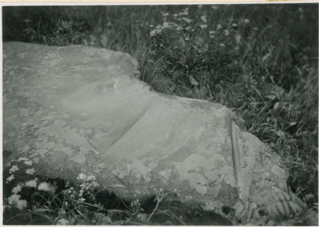
Sama kivi polyorisesta (tummempi kopia alis parempi)