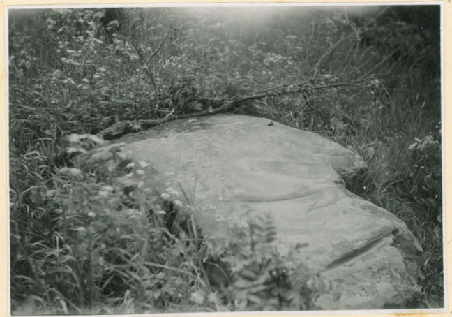
Sama kivi leateesta (tummempi kopia alis parempi)