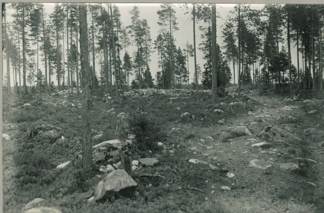
2. Tetei, Rääpingin kl. Salmela. Kuva Tetei SW-suunnasta (länneistä)