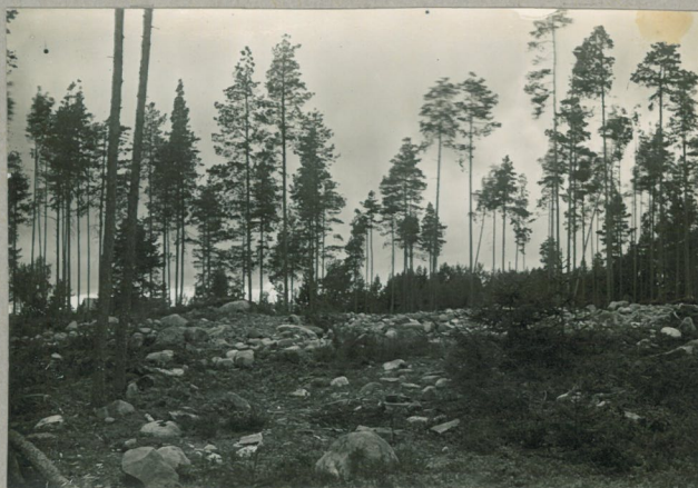
1. Tetei, Rääpingin kl. Salmela. Kuva Tetei NO (k. NNO) suunnasta.