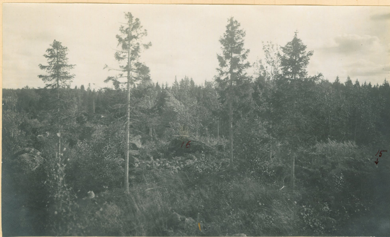
Kuva 4. Raunio n:o 16 (ks. Hackman, Die ältere Eisenzeit s. 91) Pajuperkionmäen luoteesta, raunio n:o 12 "Silmäkieppiä" valokuvattuna. Oikealla reunassa näkyy vähän raunioita n:o 15.