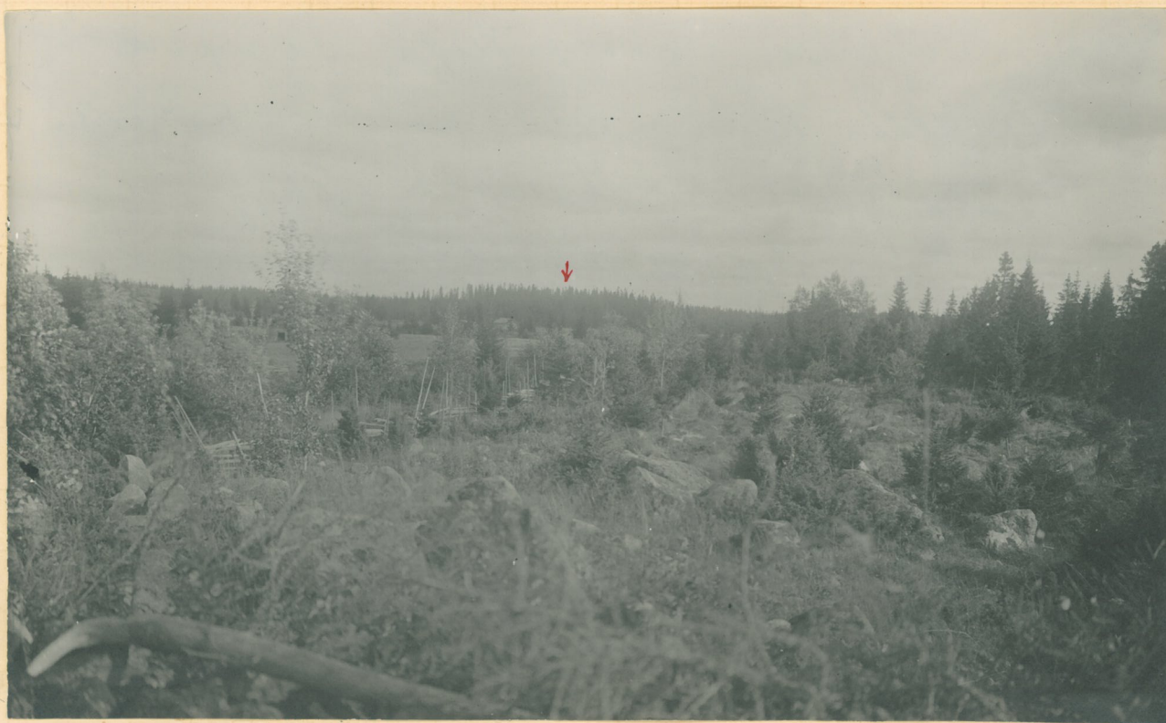
Kuva 2. Näköala raunio n:o 23 pääl- tä kaakkoon päin, tausta (puna- nuoli!) on Peltostenmäki , jolla useam- pia hautaraunioita (Aspelini n:rot 110-117).