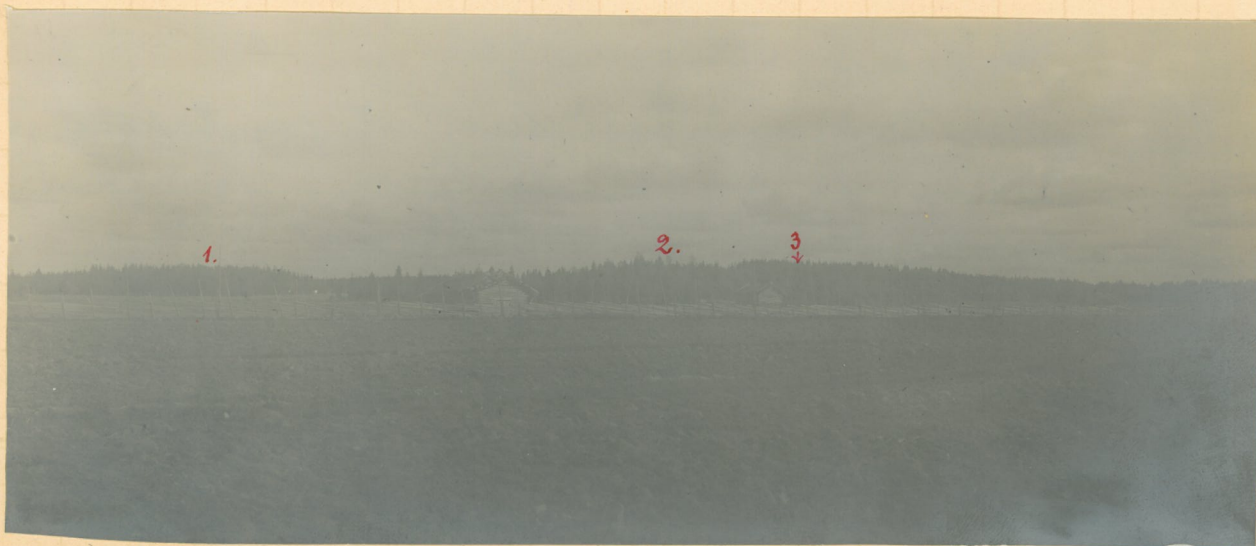
Kuva 3. Hautausmaailmia Tervajoen kylässä luoteesta päin läheeltä rautatie- valokuvattuina: 1. Hikonmäki ja sen takana Peltoskumäki. 2. Pajuperkionmäki (latojen rajoit- tamalla alueella). 3. Höyrymäki (oittaa Paji- perkionmäen takana).