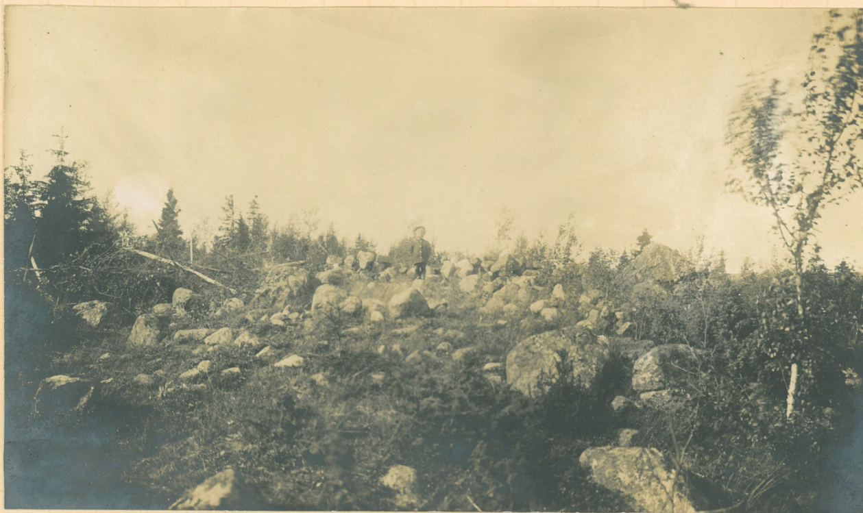
Kuva 1. Raunio n:o 23 (vrt. Hackman, Die ältere Eiszeit s. 91) Pajuperkiön mäellä, eteläkaakosta katsottuna (vrt. karttaan). Poika seisoo silmäkiven, jonka juurelta esi- neet Poljanmaan Hist. Museo n:o 2160 löy- tyivät.