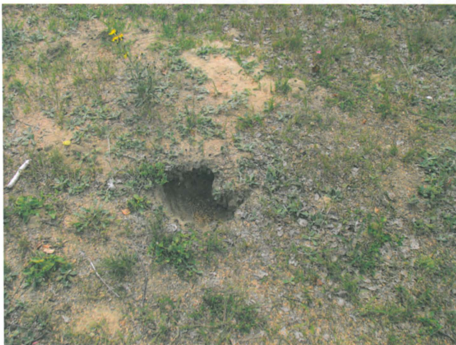
Keskellä kalmistokenttää oleva kaivelujälki, kuvattu lännestä