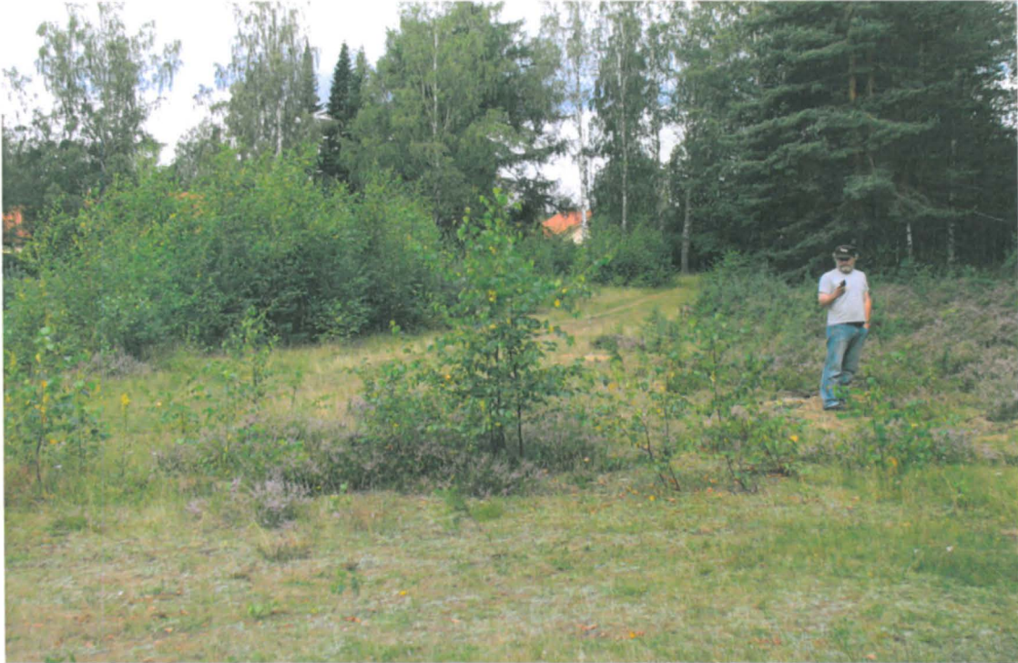
Intendentti Kaarlo Katiskoski ottaa koordinaattipistettä metsätieuran varteen kaivetulle kuopalle. Kuva idästä.