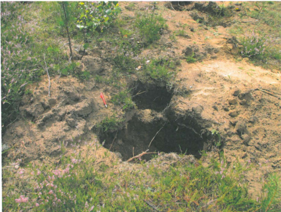
Edellisen kuvan alimmat kuopat kuvattuna lähempää