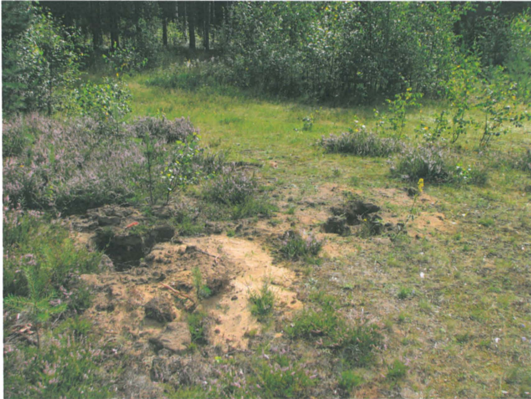
Metsätieuran varralla olevia kaivelukuoppia, kuvattu metsätieuralta, luoteesta