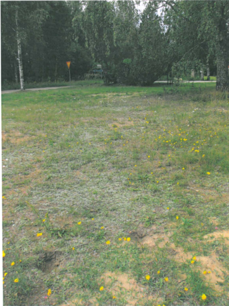
Taustalla Tuukkalan muistomerkki, edessä kaivelun jälkiä, kuvattu idästä