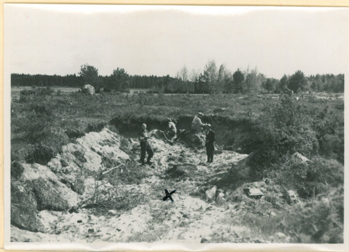
X Kerämii k an löytöpaikka