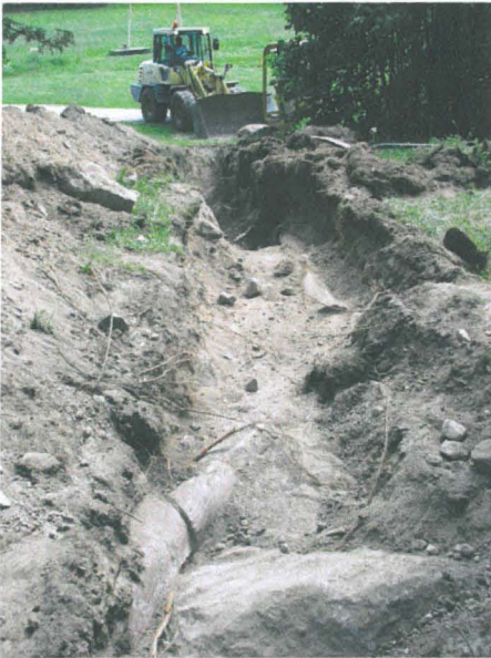
Oja 2, ojan yläosassa tuli vastaan betoniputkia

Ojan yläosassa, suunnilleen tuvan kohdalla, tuli vastaan betoniputkia, joten alue ei ollut koskematon, niin kuin oli suunnitteluvaiheessa luultu.