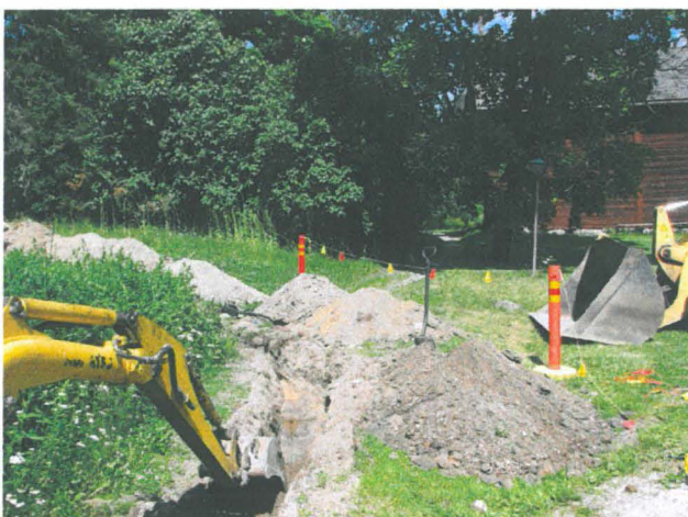
Oja 2, ojan loppupää alapihalla