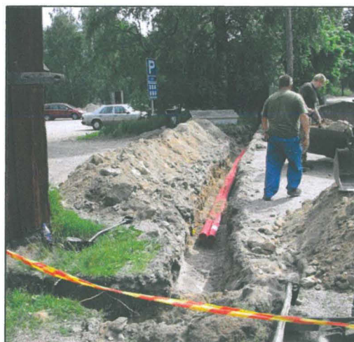
Oja 1 valokuvattu luoteesta kaakkoon (NW-SE). Kuvassa näkyy myös vaunuvajan kulma ja uuden vetokaivon paikka