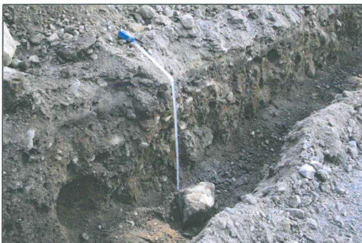
Oja 1. NE- profiili. Profiilin yläosassa oli havaittavissa n 3-10 cm paksuinen tumma kulttuurikerros. Muuten puhdasta moreenimaata.

Noin 3 m vajan kulmalta kulki yllättäen vanhempi sähkökaapelin kaivanto ja 1 m samasta kulmasta todennäköisesti puhelinkaapelin kaivanto.