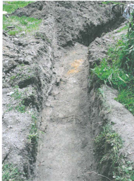
Oja 2, ojan alaosasta löytynyt puurakenne kuvan vasemmalla puolella