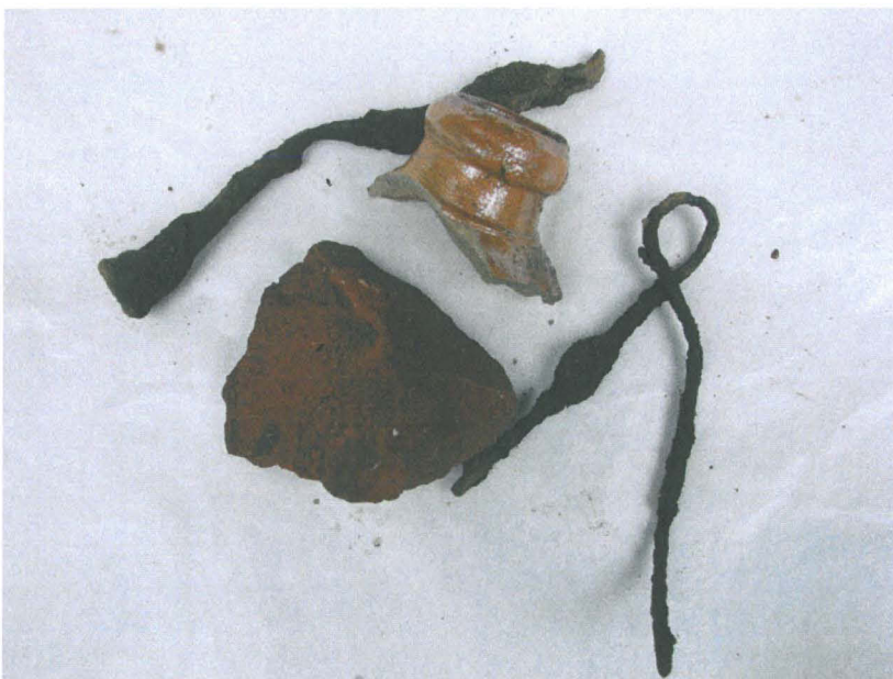
Löytöjä, oja 1