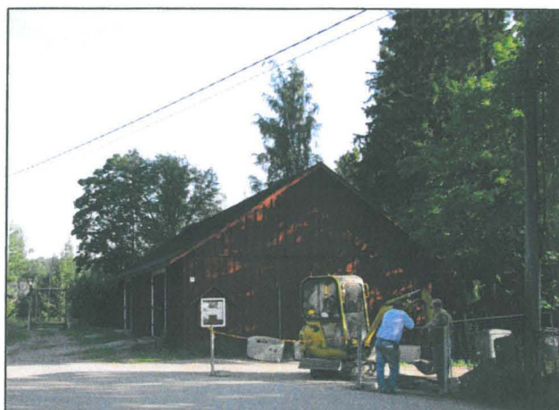
Oja 1 kaivaminen aloitetaan. Kuvassa myös Glimsin vaunuvaja.

Vuoden 2007 sähkötöiden yhteydessä jouduttiin tekemään kaivutöitä museon pihapiirissä. Kaivannot sijoitettiin pääasiassa jo ennestään kaivetuille alueelle, mutta linjaus sähköpääkeskuksesta vaunuvajalle (oja 1) ja tuvan koillispuolesta etelään (oja 2) oli vedetty alueille, joissa olisi saattanut olla säilyneitä kerroksia. Näitä linjoja kaivettiin pienellä bobcat-tyyppisellä kaivinkoneella arkeologin valvonnassa.