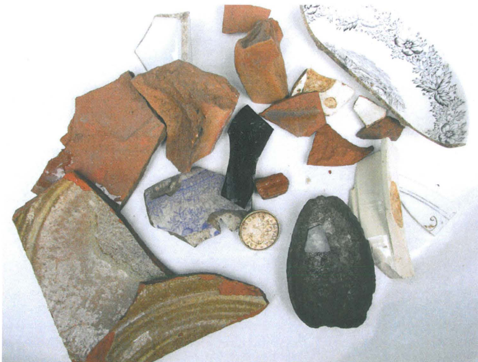
Löytöjä, oja 2

Löytöaineistossa ei ollut mitään keskiaikaan tai uuden ajan alkuun viittaavaa. Ojista ei myöskään löytynyt ollenkaan palanutta savea, jota yleensä tulee runsaasti vastaan keskiaikaisissa kohteissa.