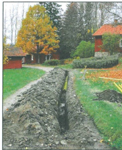
Kuvissa Glimesissa vuonna 2003 suoritetut kaivutöitä. Vasemmalla kaivanto pellolla, oikealla kaivanto Karvasmäen tieltä Glimesin alapihalle.