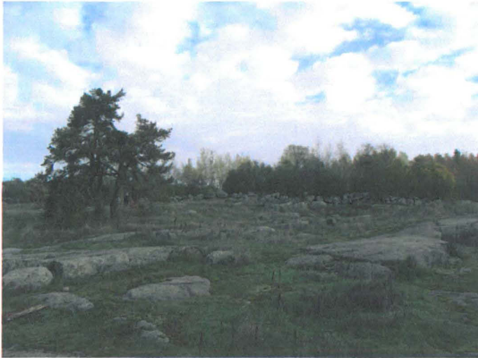
Kuva 1. Yleiskuva. Kiviainan rajaama Frisansin kartanon tonttimaata kuvattu tuulimyllyn paikalta. NE-SW. G.H. 2006.