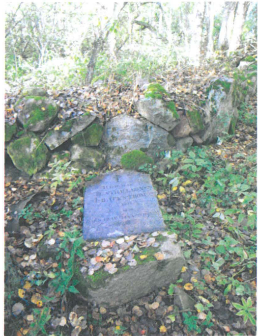
Kuva 16. Tonttimaata rajaavan kiviaidan kaakkoiskulma. Rusthollari Bäckströmin hautakivi. SE-NW. G.H. 2006.