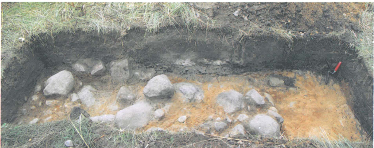
Kuva 9: Koekuoppa 36, josta löytyi haurasta tiiltä sekä paksu hiilikerros.

Entisen talouspihan alueelle tehtiin 20 koekuoppaa (koekuopat 22-41). Vuoden 2005 inventoinnissa tätä niittymäistä aluetta pidettiin mahdollisena kylätontin alueena. Osasta koekuoppia löytyi palaneen savun tai pikemminkin matalapolttoisen tiilen palasia, minkä vuoksi osaa alun perin noin 50 x 50 cm suuruisia koekuoppia laajennettiin. Osassa kuoppia pintamaa oli tiivistä karkeaa soraa, joka muistutti vanhaa tienperustusta, mikä tulkinta osoittautui karttojen tarkastelun jälkeen oikeaksi (mm. kuoppa 30). Useimmissa kuopissa oli multakerros tai savensekainen multakerros ja sen alla noin 25-40 cm syvyydessä pohjamaaksi tulkittu hiekka-, sora- tai kivikerros. Havaintojen perusteella alue tulkittiin kartanon talouspihaksi, jossa on 1800-1900-luvuilla tehty maansiirto- ja maanrakennustöitä.