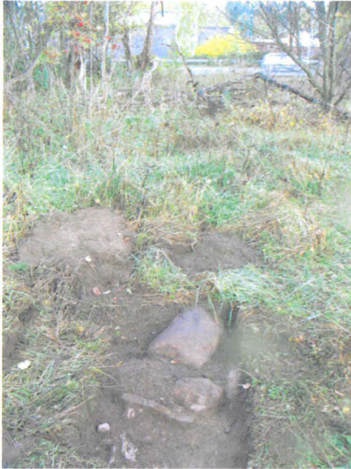
Kuva 24. Niitty, entisen talouspihan alue. Koekuoppa 25. Taustalla Länsiväylä. S-N. G.H. 2006.