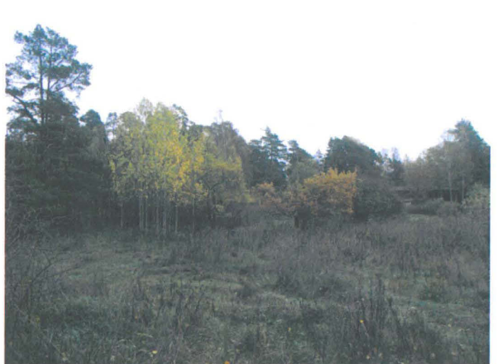
Kuva 22. Niitty, entisen talouspihan alue. Taustalla vasemmalla renkituvan paikan eteläpuolelle rakennettu omakotitalo. NW-SE. G.H. 2006.