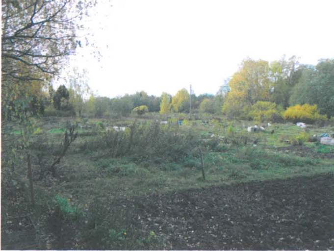
Kuva 34. Siirtolapuutarhaa (ent. Strandäkern), oikealla Finnoonjoen laakso. NE-SW. G.H. 2006.