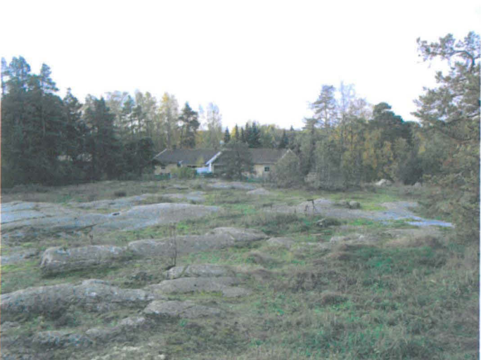
Kuva 36. Yleiskuva. Tonttimaalta lounaaseen. Paritalon edustalla uuninperustuksen paikka. NE-SW. G.H. 2006.