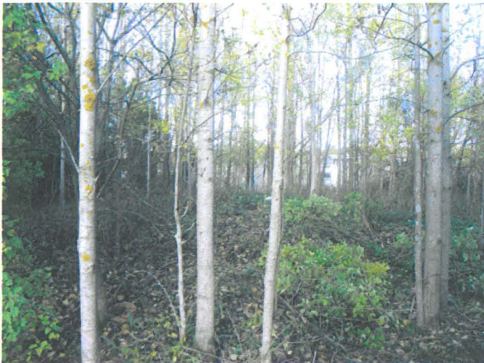
Kuva 13. Itäisen siipirakennuksen paikka/raunio. S-N. G.H. 2006.