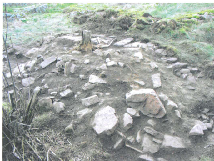
Kuva 44. Uuninperustus. Pintamaan poiston jälkeen. SW-NE. G.H. 2006.