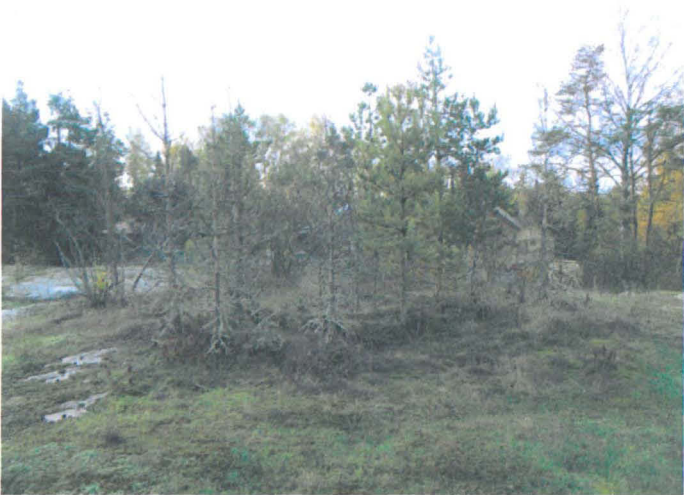
Kuva 14. Tuulimyllyn perustus. NE-SW. G.H. 2006.