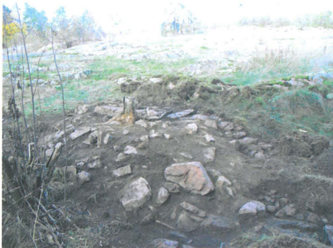
Kuva 40. Uuninperustus. Pintaturpeen poiston jälkeen. SW-NE. G.H. 2006.