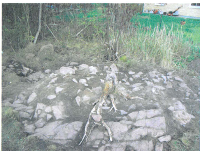
Kuva 42. Uuninperustus. Pintamaan poiston jälkeen. Etualalla kallio, taustalla paritalo. E-W. G.H. 2006.