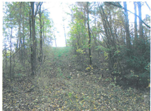
Kuva 14: Frisansin tonttimaalle kulkeva tie.