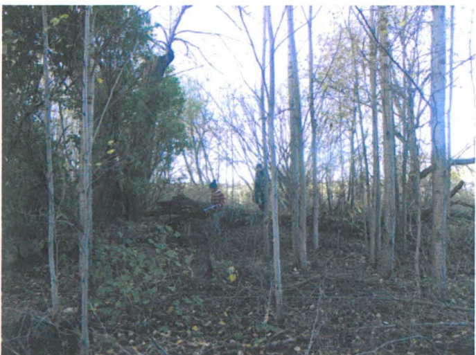
Kuva 15. Tonttimaata rajaavan kiviaidan itäisivua. Pakarirakennuksen paikka. S-N. G.H. 2006.