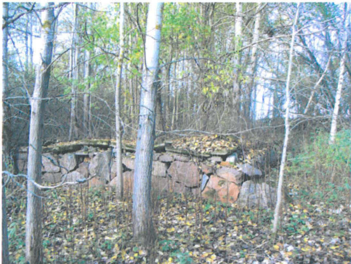
Kuva 19. Liiteri-, pesutupa- ja käymälärakennuksen kivijalka. S-N. G.H. 2006.