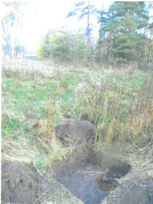
Kuva 25. Niitty, entisen talouspihan alue. Koekuoppa 36 ennen laajennusta. E-W. G.H. 2006.