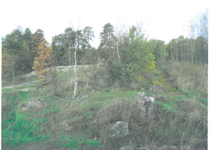
Kuva 12. Läntisen sivurakennuksen raunio. S-N. G.H. 2006.