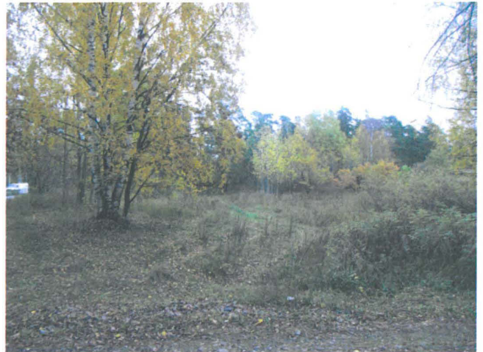
Kuva 21. Niitty, entisen talouspihan alue. Taustalla oikealla pilkottaa Länsiväylä. W-E. G.H. 2006.