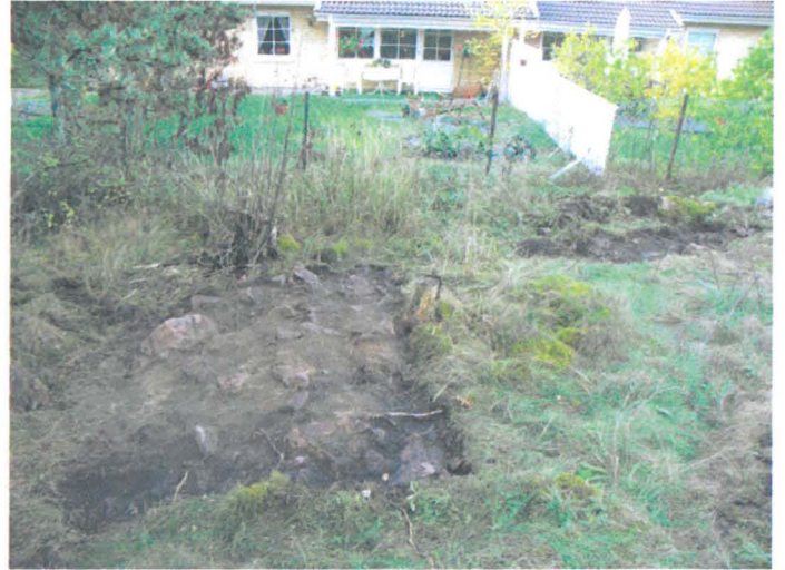
Kuva 37. Uuninperustus. Pintaturve poistettu kumpareen eteläpuoliskosta. Taustalla moderni paritalo. E-W. G.H. 2006.