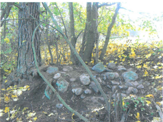
Kuva 31. Tiistinmäen luoteisrinteen alaosassa oleva uuninperustus. W-E. G.H. 2006.