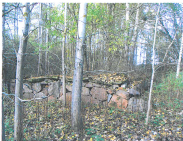
Kuva 8: Kiviaidan itäpuolella on sijainnut kartanon talousrakennuksia.