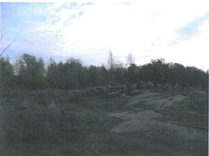
Kuva 3. Tonttimaata rajaavan kiviainan länsisivu ja portti. W-E. G.H. 2006.