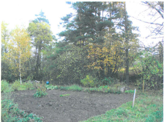
Kuva 28. Siirtolapuutarhaa Tiistimäen länsirinteen alla. W-E. G.H. 2006.