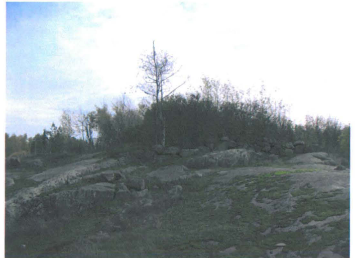
Kuva 4. Tonttimaata rajaavan kiviainan luoteiskulma. NW-SE. G.H. 2006.