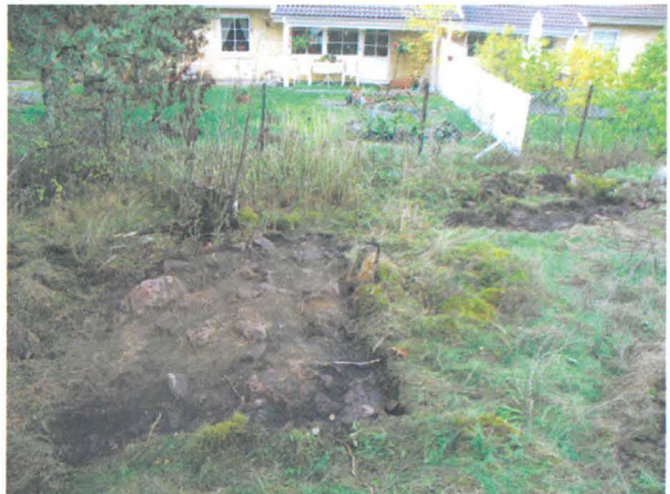
Kuva 11: Alueen lounaisrinteestä, avokallioalueen rajalta löydetty uuninperustus sijaitsee aivan pientalotontin rajan läheisyydessä

Kartanon aidatulta pihamaalta alkaa loivasti alaspäin viettävä laaja avokallio. Sen notkelmissa on paikoin maannosta, joka tarkistettiin kahden koekuopan (42, 43) avulla. Molemmissa kuopissa maannos oli pääosin pintaturvetta ja multaa, jonka alta jo noin 15 cm syvyydestä paljastui kallio. Havainnot eivät viittaa siihen, että Frisansin tonttimaan olisi ulottunut tälle kalliolle.