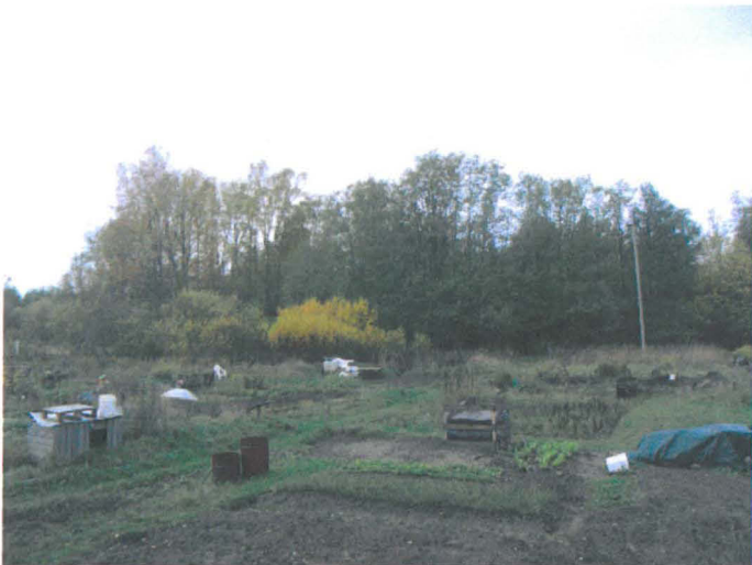
Kuva 35. Siirtolapuutarhaa (ent. Strandäkern), taustalla Finnoonjoen laakso ja matala kallio, jolla on ollut talousrakennuksia 1800- ja 1900-luvun vaihteessa. E-W. G.H. 2006.