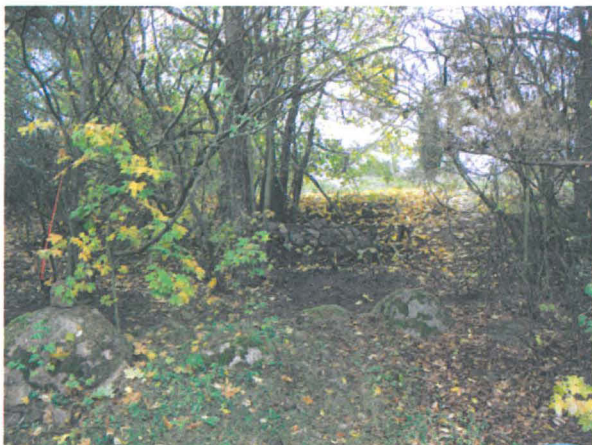
Kuva 13: Tiistinmäen länsipuolella sijaitsevan Strandäkernin itälaitaa seuraa pitkä maansekainen kivivalli.

Frisansin kartanon tonttimaan reunalta, Tiistinmäen luoteispuolelta on kulkenut tie länteen kohti Finnoon kylää. Tämä tielinja erottuu yhä maastossa olevana tierauniona, joka vie kohti Finnoonjoen ylittänyttä siltaa. Vuoden 1694 kartan mukaan paikalla on jo tuolloin kulkenut tie, joka on johtanut aina Frisansin kartanon tonttimaalle asti. (Kuva 14)