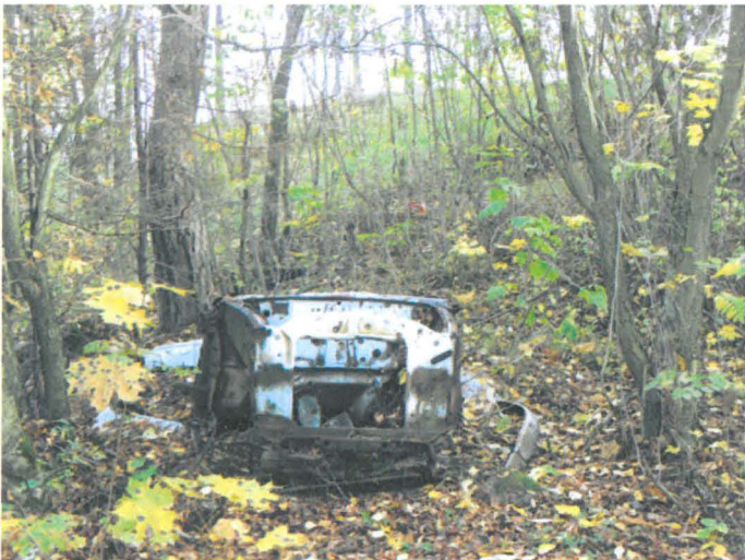
Kuva 47. Tiistinmäen luoteispuolella oleva vanha autonromu. Taustalla Finnoosta tuleva tie nousee oikealle kohti Frisansin kartanon tonttia. SW-NE. G.H. 2006.