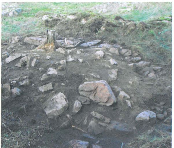
Kuva 12: Edellisen kuvan uuninperustus lähikuvassa.

Tiistinmäen lounaisosasta lähes avokallioalueen rajalta löytyi tutkimusten alkuvaiheessa matala kumpare, joka paljastui uuninperustukseksi (K). Se sijaitsi pienellä tasanteella, jota rajasi pohjois- ja