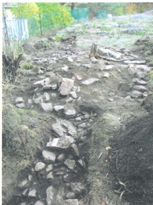
Kuva 43. Uuninperustus. Pintamaan poiston jälkeen. Etualalla perustuksen eteläpuolella ollut lattia (tms.) kiveystä. S-N. G.H. 2006.