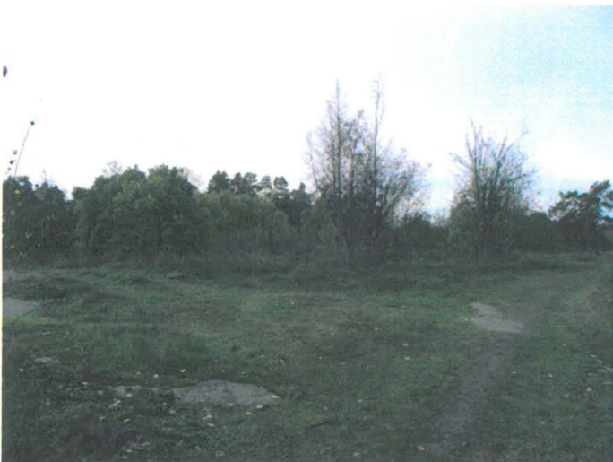
Kuva 9. Kartanon pihapiiriä. Keskellä päärakennuksen paikka. E-W. G.H. 2006.