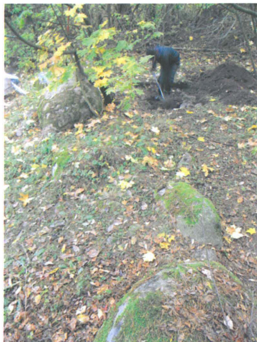
Kuva 33. Etualalla Strandäkernia reunustanut aitamainen peltoraunio ja sen takana koekuoppa 2. W-E. G.H. 2006.