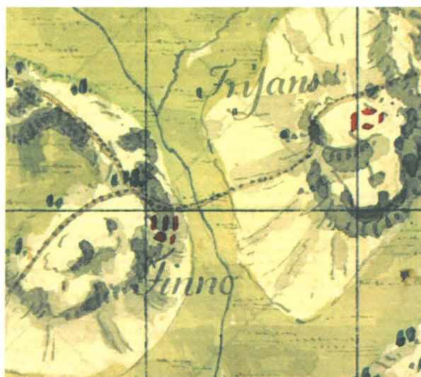
Kuva 3: Frisans ns. kuninkaankartaston merikartastossa 1700-luvun lopulla.