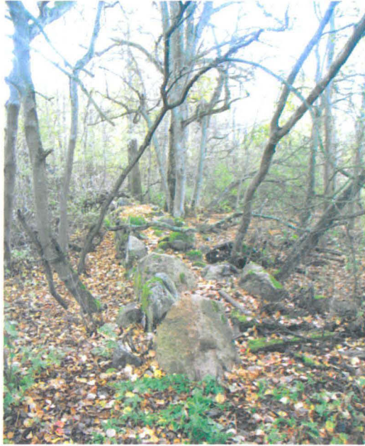
Kuva 7. Tonttimaata rajaavan kiviaidan itäisivua. N-S. G.H. 2006.