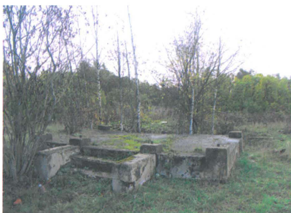
Kuva 7: Frisansin päärakennuksesta säilynyt betonista valettu kuistinperustus.