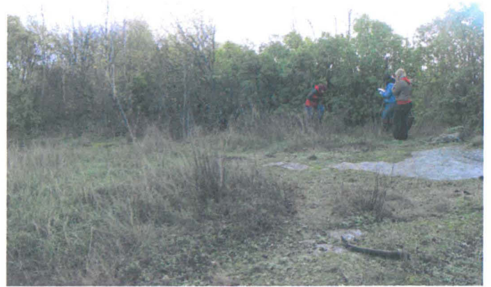
Kuva 48. Koekuopan kaivamista karatanon tonttimaan pohjoispuolella. N-S. G.H. 2006.