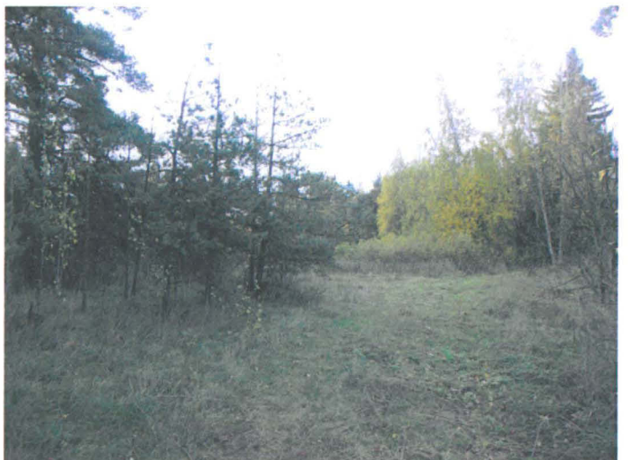
Kuva 23. Niitty, entisen talouspihan alue. NE-SW. G.H. 2006.