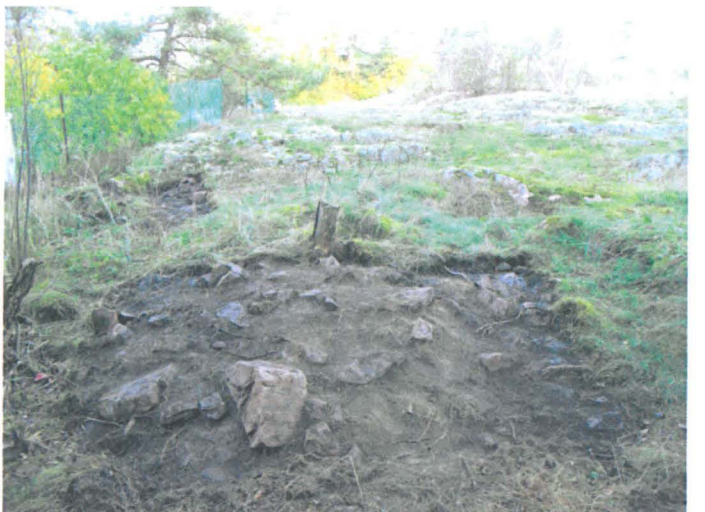
Kuva 39. Uuninperustus. Pintaturve poistettu kumpareen eteläpuoliskosta. SW-NE. G.H. 2006.