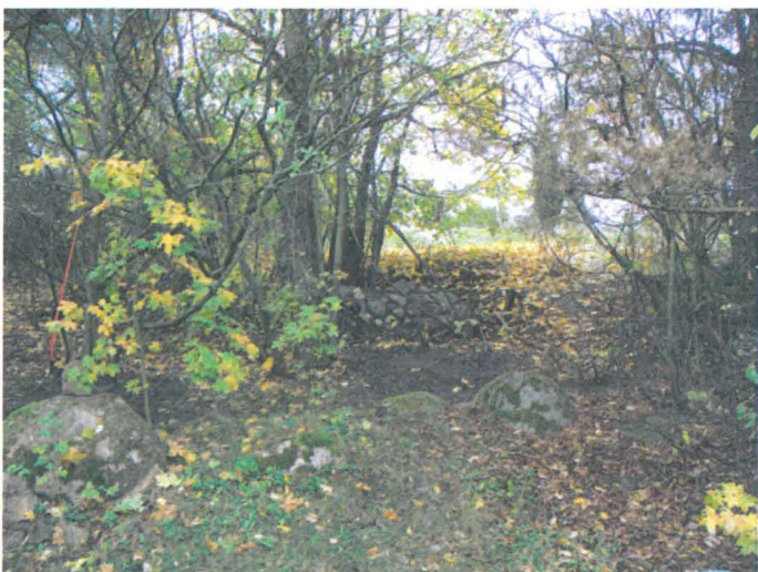
Kuva 30. Tiistinmäen luoteisrinteen alaosassa oleva uuninperustus. Etualalla Strandäkernia reunustanut aitamainen peltoraunio ja sen takana koekuoppa 3 täytettynä. W-E. G.H. 2006.