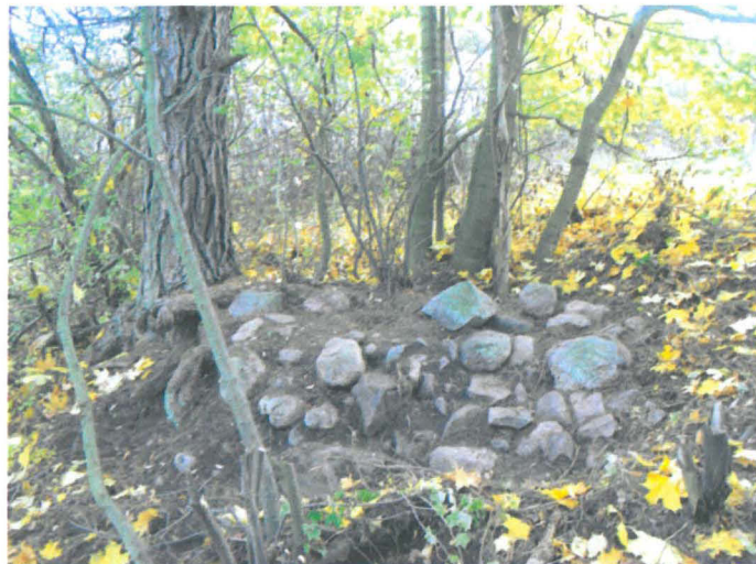
Kuva 32. Tiistinmäen luoteisrinteen alaosassa oleva uuninperustus. SW-NE. G.H. 2006.