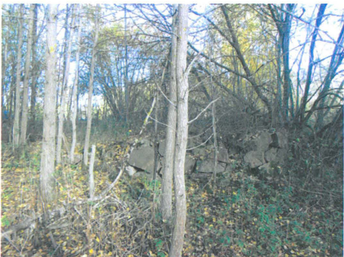
Kuva 20. Ajosilta tonttimaan kiviaidan itäpuolella. SW-NE. G.H. 2006.