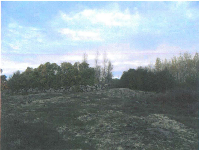
Kuva 2. Tonttimaata rajaavan kiviainan eteläsivu. S-N. G.H. 2006.