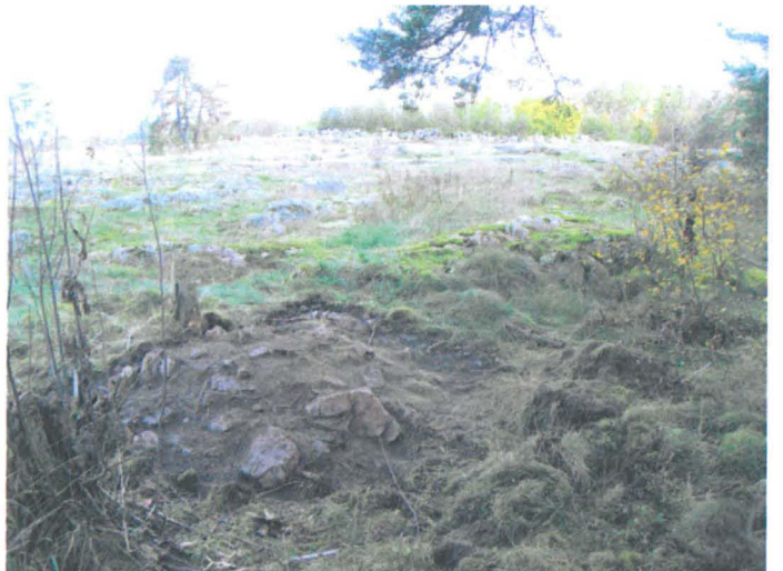
Kuva 38. Uuninperustus. Pintaturve poistettu kumpareen eteläpuoliskosta. SW-NE. G.H. 2006.