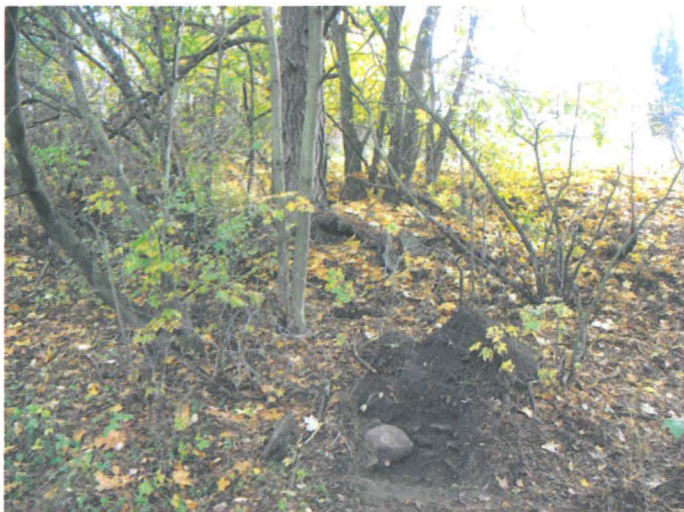
Kuva 29. Tiistinmäen luoteisrinteen alaosassa oleva uuninperustus. Etualalla koekuoppa 3. W-E. G.H. 2006.