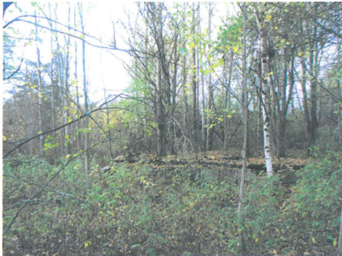
Kuva 18. Liiteri-, pesutupa- ja käymälärakennuksen kivijalka. E-W. G.H. 2006.