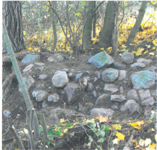
Kuva 10: Tiistinmäen länsipuolelta havaittu uuninperustus.

Alkujaan 50 x 50 cm kokoisesta kuopasta 36 löytyi palanutta savea tai matalassa lämpötilassa poltettua haurasta tiiltä sekä noin 20 cm pinnan alla noin 10-15 cm paksu hiilikkerros, minkä vuoksi kuoppaa laajennettiin. Lopulta kuopan koko oli 1 x 4 m. (Kuva 9) Tällöin kuopan länsipää oli noin 40 cm syvä, josta pinnalla noin 20 cm multaa ja sen alla punaista hiekkaa ja isoja kiviä sekä noin 10-15 cm paksu hiili- ja nokikerros. Itäpääty, jonne hiilikkerros ei ulottunut, oli noin 60 cm syvä. Täällä pinnalla oli noin 40 cm kerros savista multaa, jonka seassa oli isoja kiviä, ja alla noin 20 cm kerros punaista hiekkaa. Alueen keskiosassa oli erittäin vaaleata noensekaista hiekkaa. Koko alueella maa oli varsin sekoittunutta, mikä tulkittiin talouspihalla 1800-1900-luvulla tehtyjen maansiirto- ja rakennustöiden seuraukseksi. Paikalta löytyi tiiltä sekä modernia lasia ja posliinia.