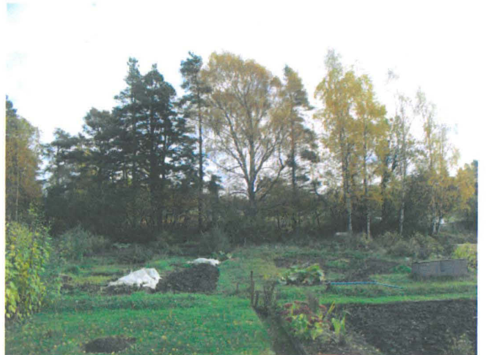
Kuva 27. Siirtolapuutarhaa (ent. Strandåkern), taustalla Tiistimäen länsirinne. W-E. G.H. 2006.