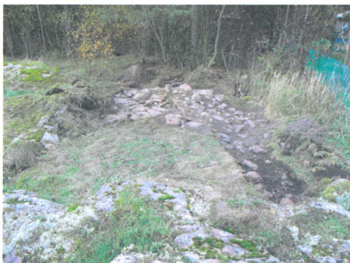
Kuva 41. Uuninperustus. Pintamaan poiston jälkeen. Etualalla uunin pohjoispuolella ollut tasanne. N-S. G.H. 2006.