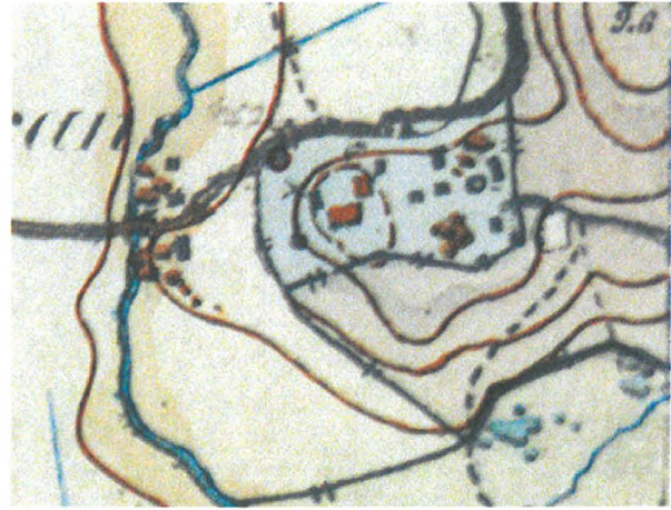
Kuva 5: Frisans Senaatin kartastossa vuodelta 1872

aivan kartanon tonttimaan pohjoispuolelta. Tie oli tuolloin vielä pieni verrattuna paikalle 1960-luvulla rakennettuun Länsiväylään. Tiistinmäen eteläpuolella ei vielä 1950-luvun puolivälissä ollut omakoti-asutusta kuten 1960-luvun lopulla. (Ks. EKM: Espoon pitäjänkartta VI:9 (1954).