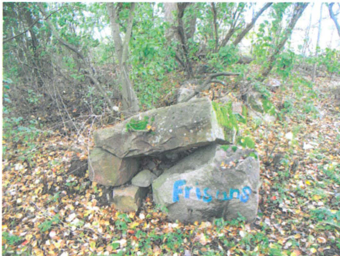
Kuva 8. Tonttimaata rajaavan kiviaidan itäisen portin pohjoispie- li. S-N. G.H. 2006.