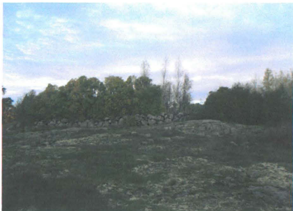
Kuva 6: Kartanon miespihaa kiertänyt kiviaidan itäreunaa.