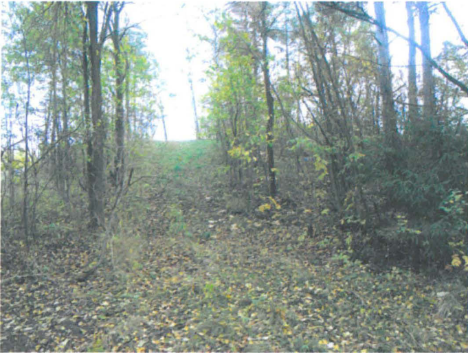
Kuva 46. Finnoosta tuleva tie nousee Tiistinmäelle kohti Frisansin kartanon tonttia. W-E. G.H. 2006.