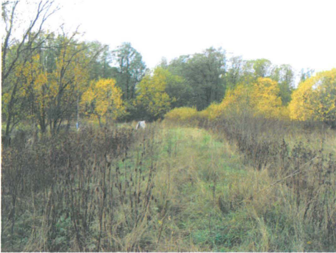
Kuva 45. Frisansista Finnooseen vieneen tie raunio. Vasemmalla vanha Strandåker. E-W. G.H. 2006.