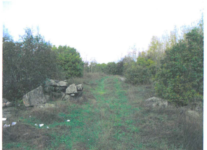
Kuva 5. Tonttimaata rajaavan kiviainan eteläinen portti. S-N. G.H. 2006.