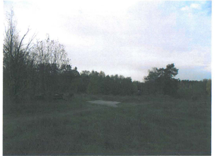
Kuva 10. Kartanon pihapiiriä. Oikealla päärakennuksen, keskel- lä läntisen sivurakennuksen paikka. NE-SW. G.H. 2006.