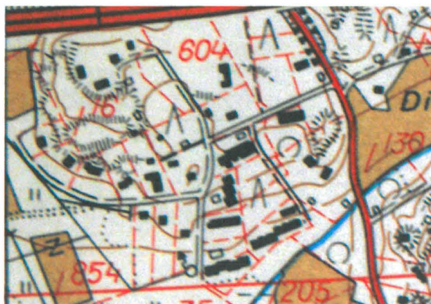
Kuva 1: Frisansin alue peruskartalla vuodelta 1967.

Frisansin kartano peltoineen alkoi 1960-luvulla jäädä kasvavan kaupunkirakentamisen puristukseen. Helsingistä länteen vievä moottoritie Länsiväylä rakennettiin 1960-luvulla siten, että se sivusi Frisansin tonttimaan pohjoisosaa. Osa kartanon pelloista jäi uuden tien alle ja osa sen pohjoispuolelle. (Kuva 1) Frisans jäi pian asumattomaksi ja 1970-luvulla sen rakennukset purettiin, mutta rakennuskanta on vanhojen valokuvien ja Espoon kaupunginmuseon keräämän muistitiedon avulla yhä hahmotettavissa. Viimeisten 20-30 vuoden ajan alue on ollut joutomaana. Selvimpänä muistona kartanosta on vanhaa tonttimaata rajannut, kallionlakea kiertävä kiviaita, joka hallitsee yhä Frisansin ympäristön maisemaa.