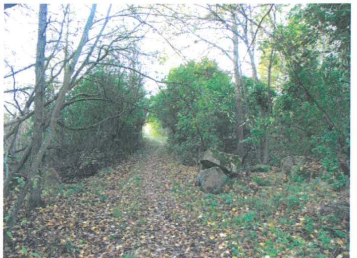
Kuva 6. Tonttimaata rajaavan kiviainan itäinen portti. E-W. G.H. 2006.