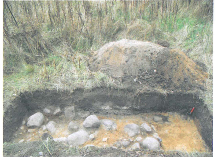
Kuva 26. Niitty, entisen talouspihan alue. Koekuoppa 36 laajennettuna. N-S. G.H. 2006.