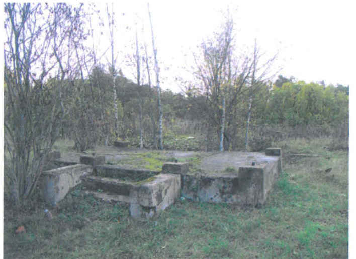
Kuva 11. Päärakennuksen raunio. Etualalla kuistin perustus be- toniportainen. N-S. G.H. 2006.