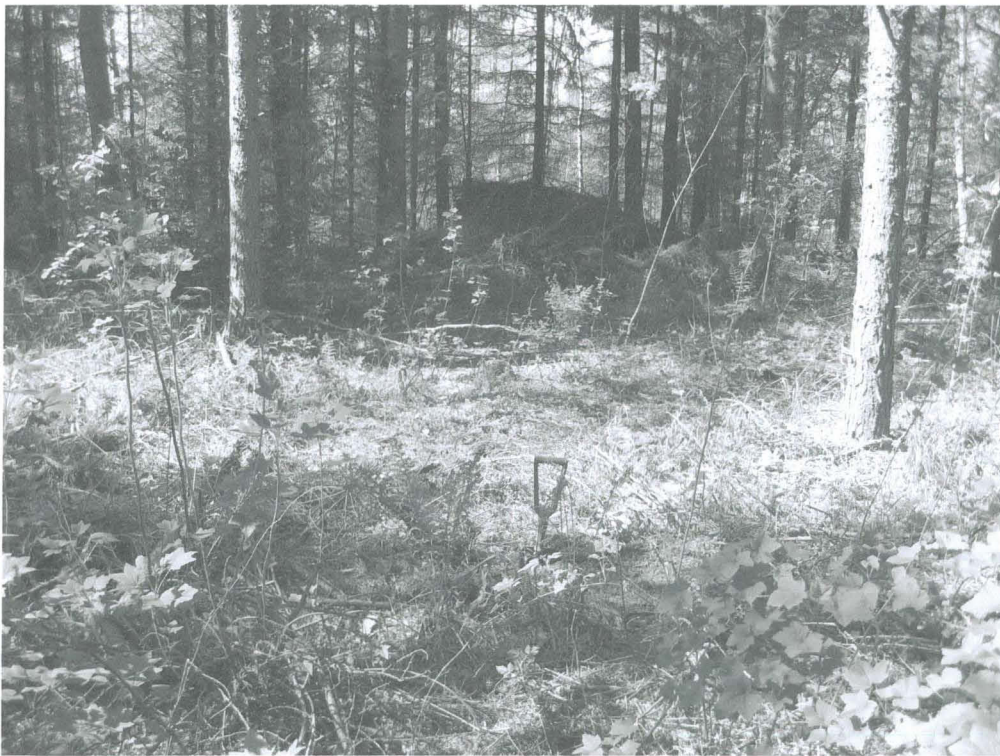
Koekuoppa 8. Idästä. 28.5.2006. Koekuopasta ei löytöjä. Taustalla hämöttää Vanajavesi sekä 9000 auringonkiertoa –leirin laavurakennelma.