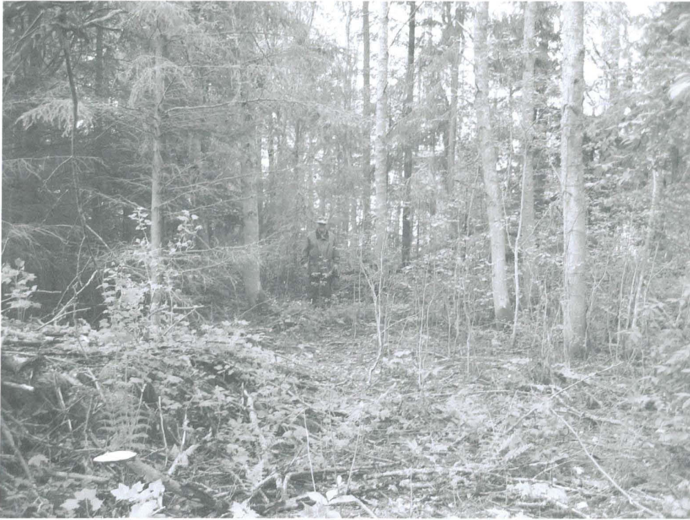
Koekuoppa 5. Kaakosta. 28.5.2006. Koekuopasta löytänä yksi savitiivisten pala. Taustalla Vanajavesi.