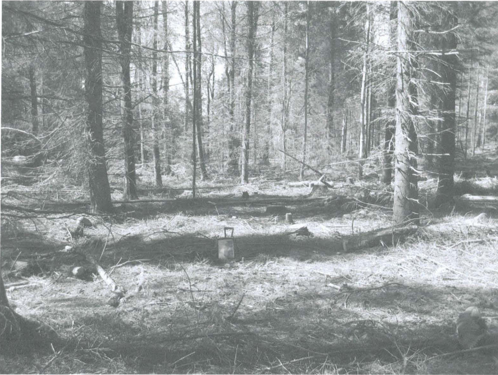
Koekuoppa 9. Kaakosta. 28.5.2006. Koekuopasta löytöinä saviastianpala ja palanutta savea. Taustalla häämöttää Vanajavesi.