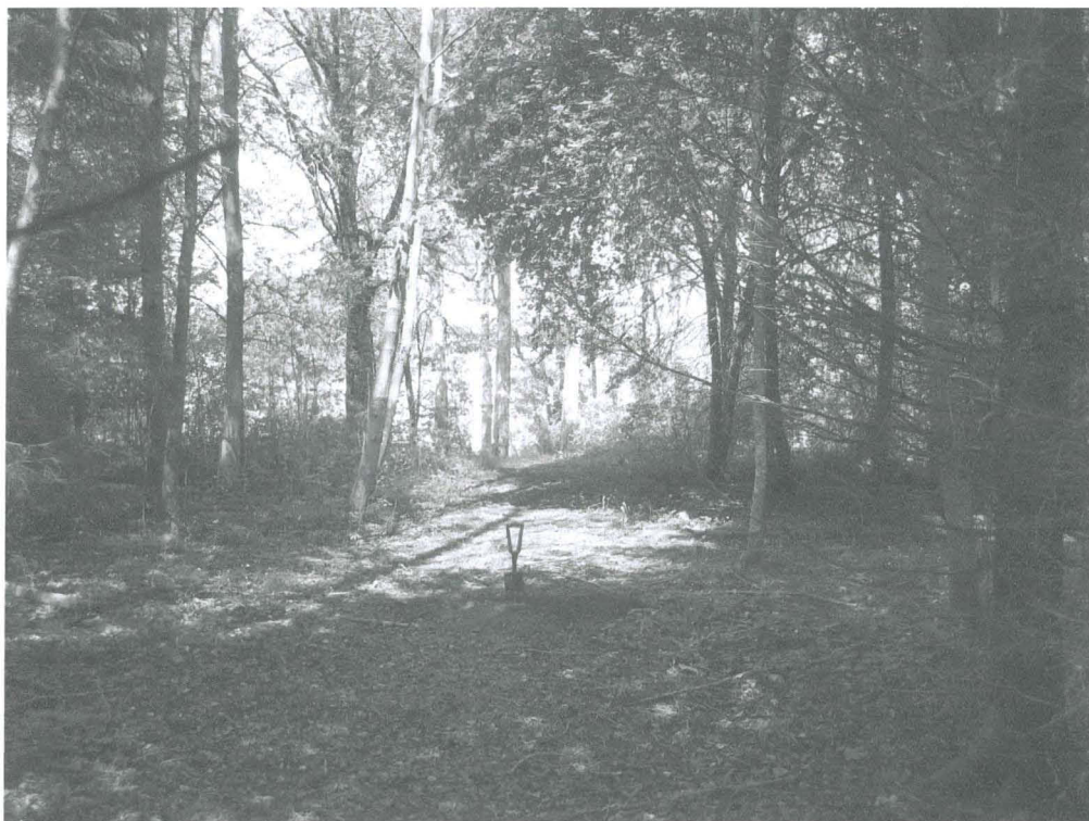
Koekuoppa 4. Etelästä. 28.5.2006. Taustalla Vanajavesi. Koekuopasta löytönä yksi saviastian pala.