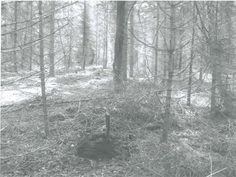
Koekuoppa 1. Pohjoisesta. 28.5.2006. Kuopasta ei löytöjä.