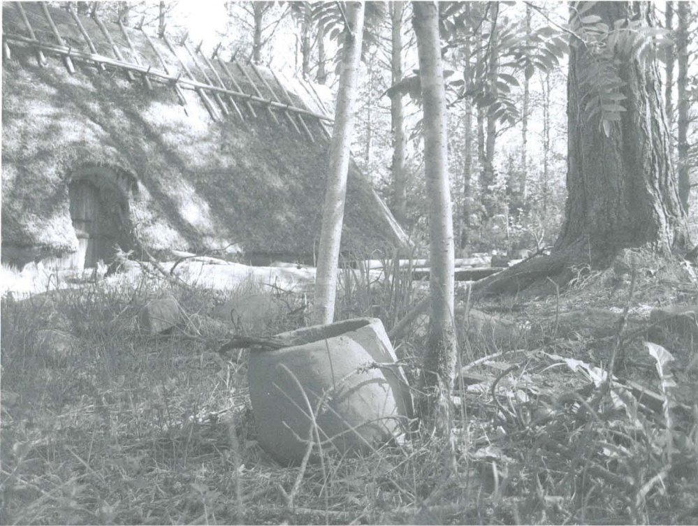
Viikinkitalo ja edustalla oleva saviastia. Lounaasta 28.5.2006