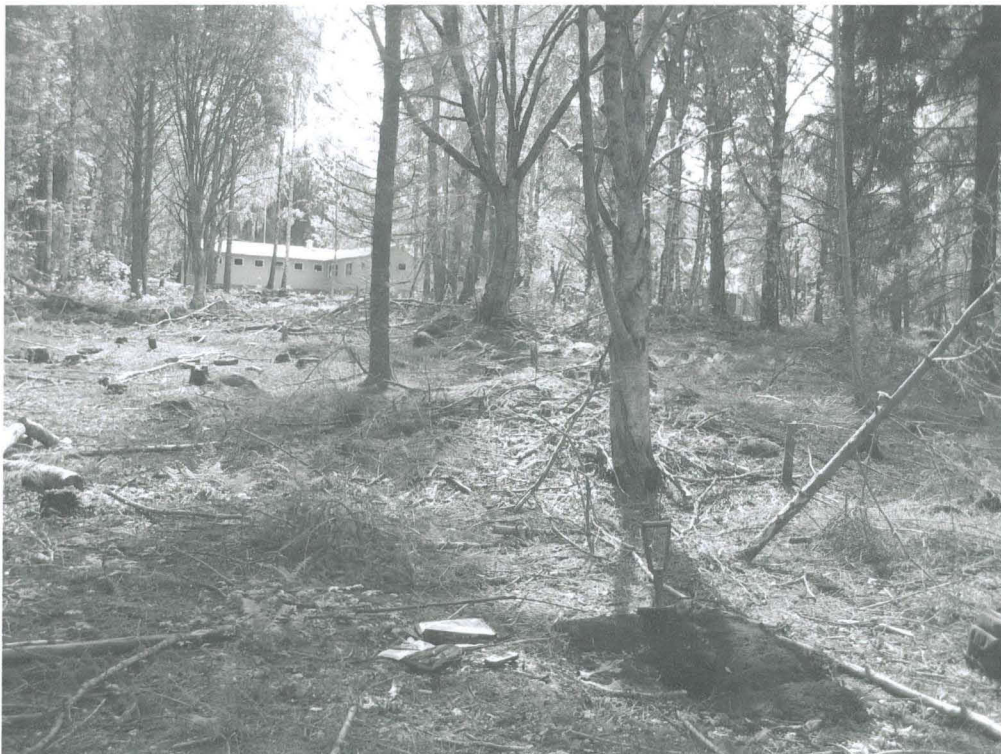
Koekuoppa 2. Pohjoisesta. 28.5.2006. Kuopasta löytöinä saviastian pala ja palanutta savea sekä tiiltä.