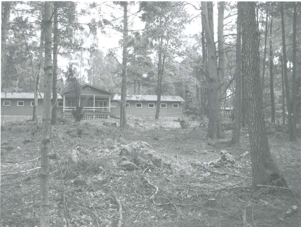
Vanhoja viljelysröykkiöitä rakennusten ja rannan välissä. Lännestä. 28.5.2006. Taustalla Hämeenlinnan entisen kesäsiirtolan lähinnä rantaa oleva rakennus.