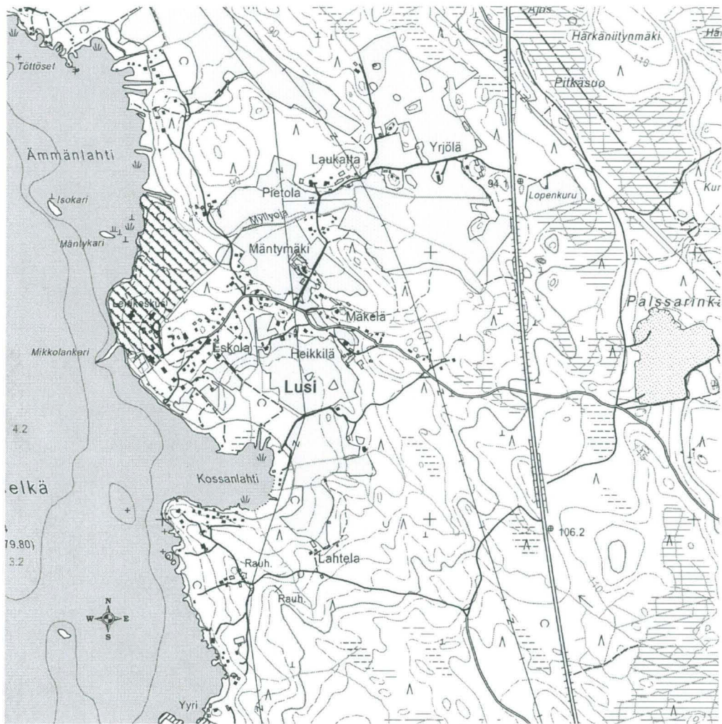
Hattula Lusi Myllyaro-Mikkola Peruskarttaote, mittakaava 1:20 000