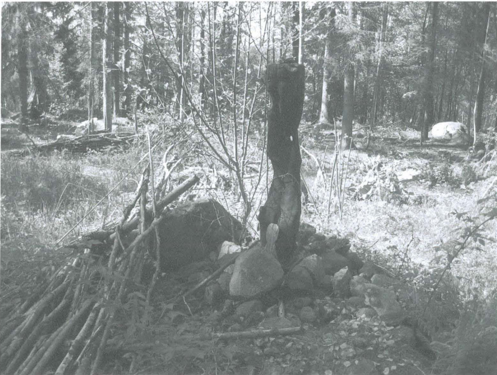
Röykkiön nro 1 keskelle pystytetty totemipaalu Viikinkitalon länsipuolella. Röykkiössä myös saviastian palasia. Idästä. 28.5.2006.