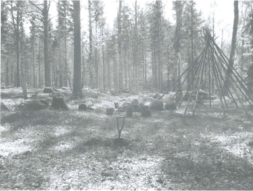
Koekuoppa 7. Pohjoisesta. 28.5.2006. Koekuopasta ei löytöjä. Taustalla 9000 auringonkiertoa –leirin rantanuotiopaikka rakennelmineen.