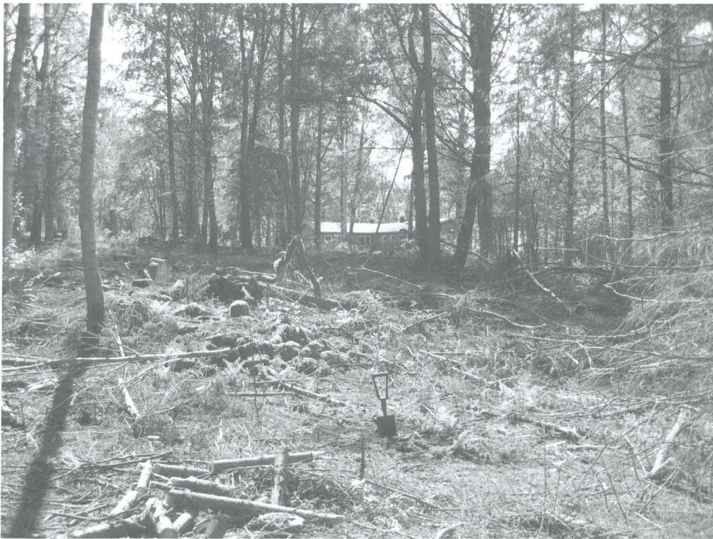
Koekuoppa 6. Koillisesta. 28.5.2006. Koekuopasta ei löytöjä. Taustalla Hämeenlinnan vanhan leirikeskukseen lähimpänä rantaa oleva rakennus.