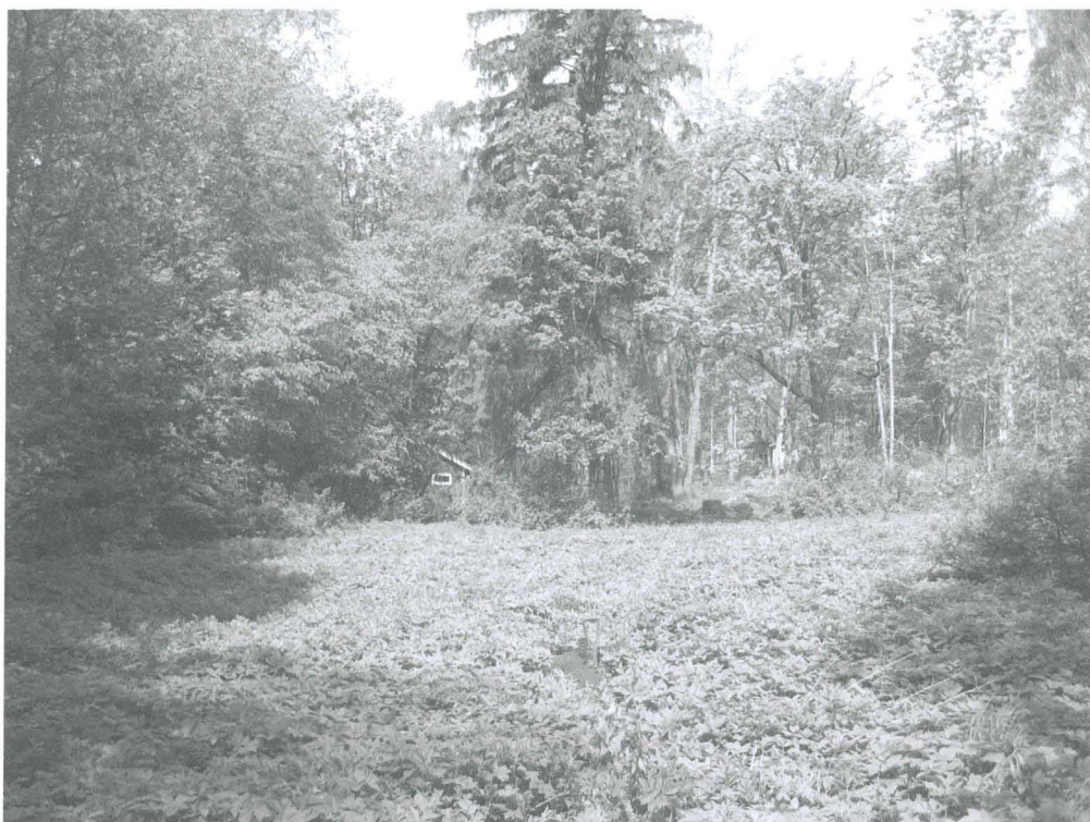
Koekuoppa 3. Etelästä. 28.5.2006. Koekuopasta ei löytöjä. Ko. alueelta on 1900-luvun alussa löydetty soikea tuluskivi ja kivinen kaksoiskirves.