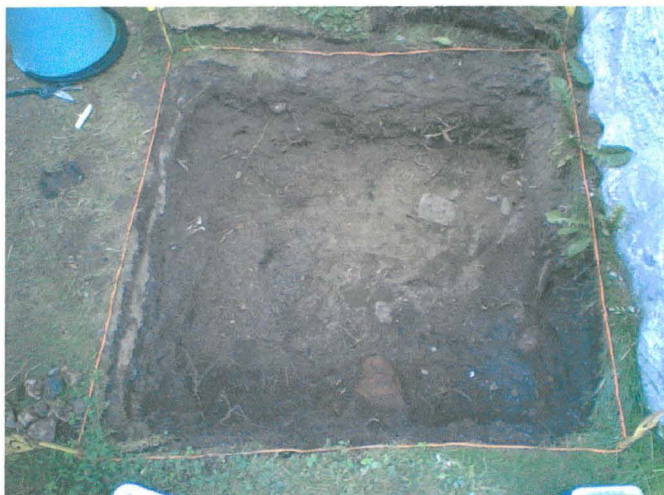
Provgrop 2 efter att grästorven avlägsnats. Foto fr. söder.

Provgrop 2 grävdes alldeles intill Hertonas gårds vägg, vid gårdens sydöstra hörn. Den tjocka grästorven avlägsnades med spade varefter grävningen fortsatte med murslev. Gropen innehöll förhållandevis mycket modernt material, flaskglas m.m. och gav överlag ett omrört intryck. Ganska obetydliga fynd av äldre irriserat flask- och fönsterglas, kakel och keramik kom fram i de nederst belägna utgrävningslagren.