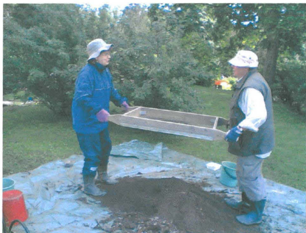
Den grävda jorden från provgrop 2 sållas. Foto från norr.

Gruslagret överst i provgrop 1 avlägsnades med spade varefter själva utgrävningen företogs med murslev och sopskyffel i grävningsskikt om 10 cm. All grävd jord sållades genom ett finmaskigt såll.