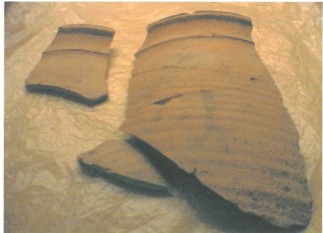
Lerkärlsbitar från de sista grävningsslagren (ihoplimmade), ev. fabriken produktion? Provgrop 1 lager 7.

På två av takteglarna kunde ett stämpelavtryck med bokstäverna H.N. skönjas. Sannolikt är stämpeln en förkortning av Hertonäs (HärtoNäs) dvs. takteglarna kunde tänkas härstamma från det av