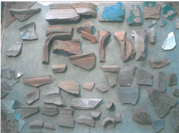
Fynd av kakel, bitar av fat, irriserat fönsterglas m.m. från provgrop 1, lager 2.

Under detta översta lager tog fabriken och fabriksbyggnadens avfallslager genast vid. Fynden bestod framförallt av mängder av svartglaserade taktegel (från fajansfabriken tak), tegelkross och bitar av kakel och keramik.