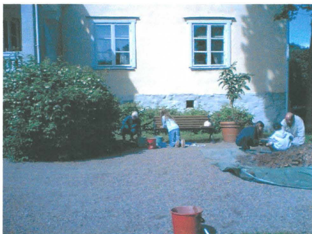
Provgrop 1 utgrävs. Foto från söder

Gruslagret överst i provgrop 1 avlägsnades med spade varefter själva utgrävningen företogs med murslev och sopskyffel i grävningsskikt om 10 cm. All grävd jord sållades genom ett finmaskigt såll.