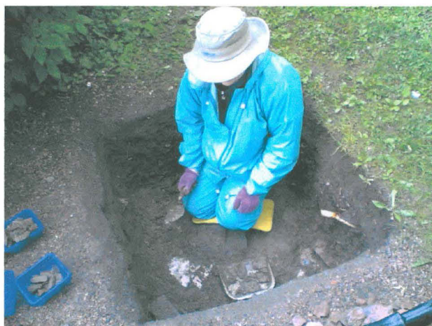
Provgrop 1 utgrävs med murslev och sopskyffel. Fr. öster.