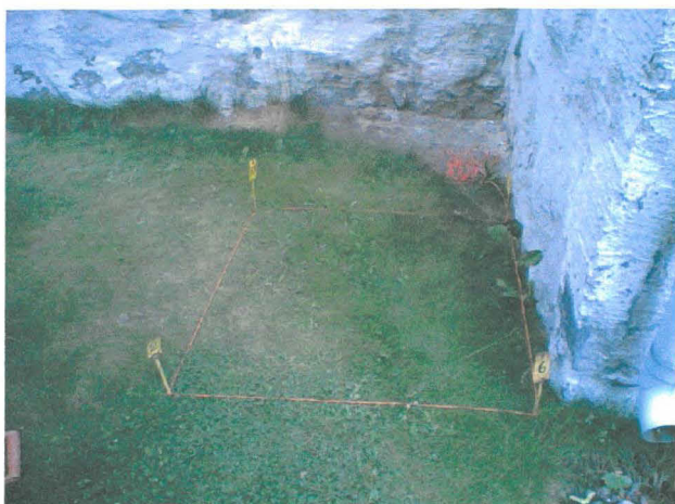
Provgrop 2 före utgrävningen. Foto från söder.

Provgroparnas platser utmärktes med metallpinnar och avgränsande snören före utgrävningens inledande. För att skona den ömtåliga parken bestämdes att åtminstone de första provgroparna skulle grävas invid herrgårdens södra fasad, närmare bestämt på dess grusbelagda sydterass så nära karaktärsbyggnaden som möjligt. Provgroparnas storlek bestämdes inledningsvis till en kvadratmeter. Eftersom redan den första provgropen träffade rätt och för att inte skada fornlämningen före de egentliga utgrävningarna grävdes sammanlagt endast 3 provgropar.